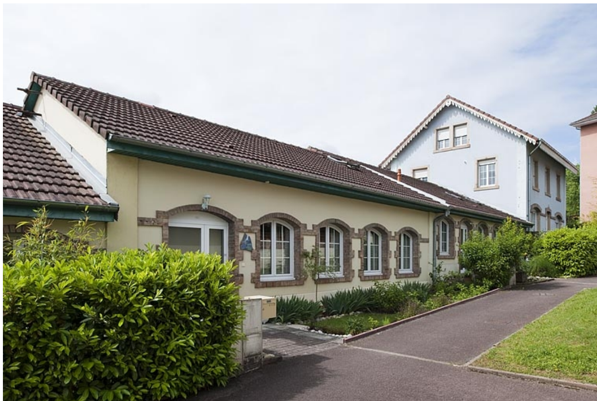
Atelier de fabrication, et bâtiment abritant le bureau et le logement.

25, Montbéliard, 13 avenue du maréchal Foch