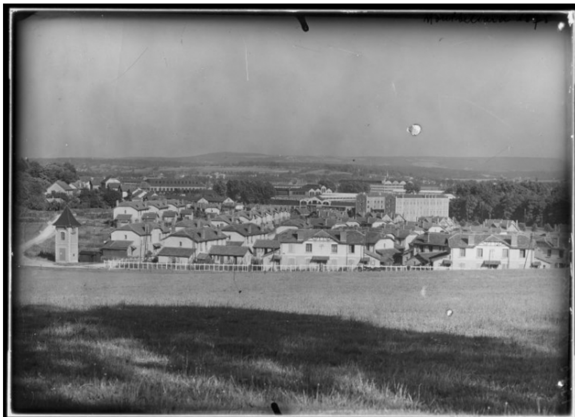
[Vue d'ensemble depuis le nord-ouest]. 25, Montbéliard, lieudit : sous le Parc