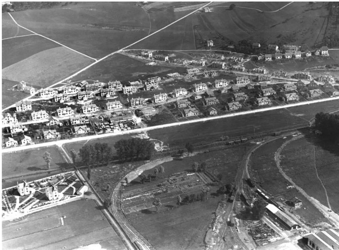
Vue aérienne depuis le sud-ouest. 25, Montbéliard, lieudit : sous le Parc