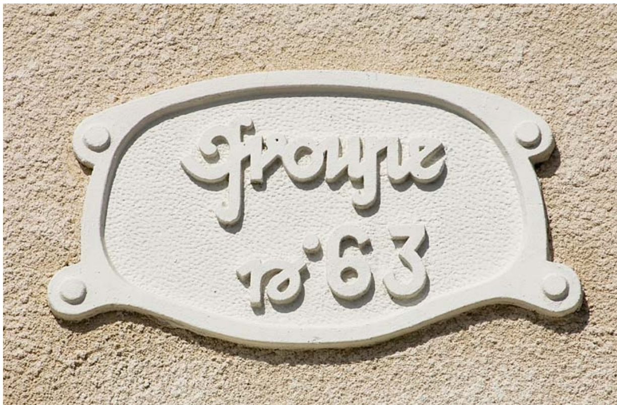
Habitation à 4 logements. Cartouche sur la façade antérieure.