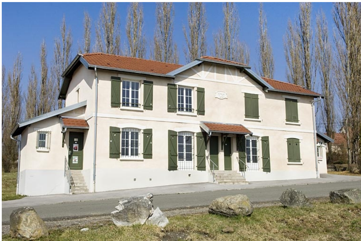
Habitation à 4 logements. Façade antérieure. 25, Montbéliard, lieudit : sous le Parc