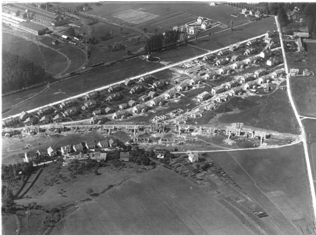
Vue aérienne depuis le nord-est. 25, Montbéliard, lieudit : sous le Parc