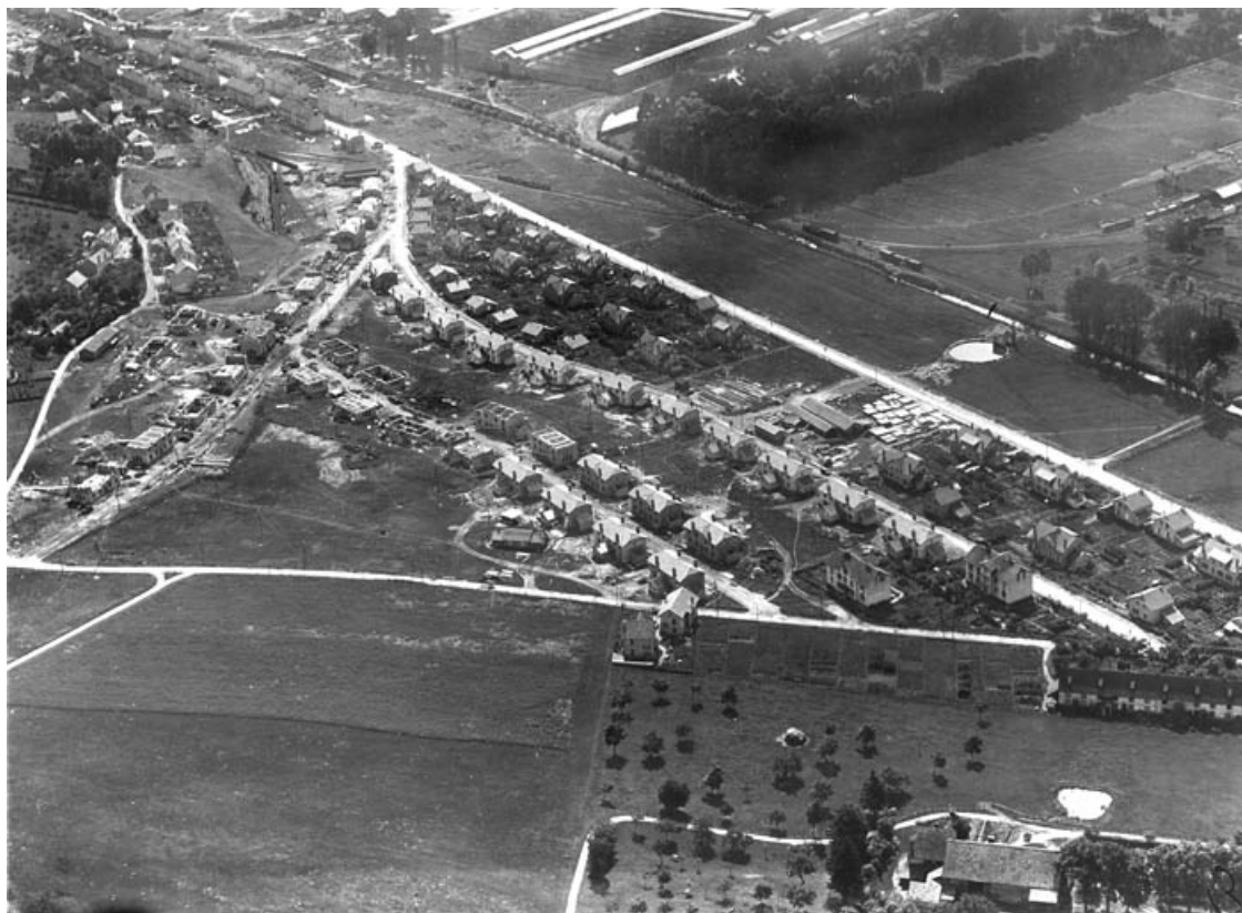
Vue aérienne depuis le nord-ouest.