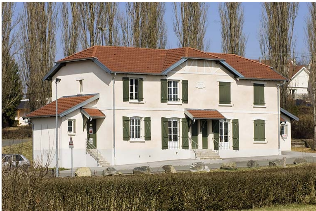
Habitation à 4 logements vue depuis le sud-ouest.