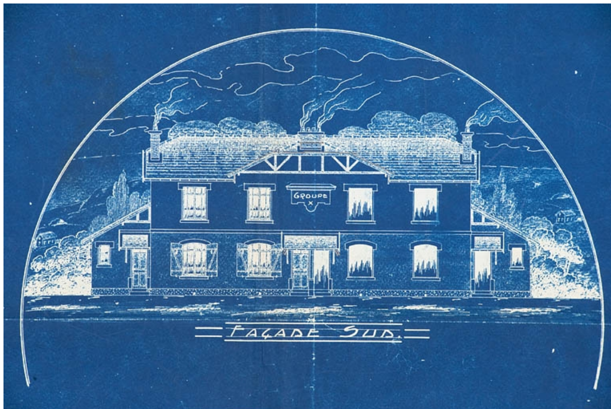
Projet d'habitation ouvrière de 4 logements de 4 pièces. Façade sud.