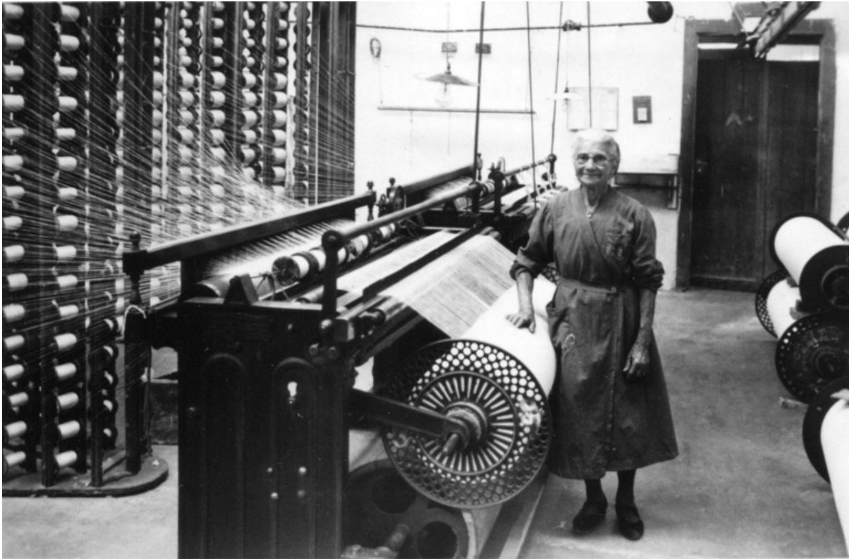
Ouvrière devant un ourdissoir.

25, Montbéliard, 97, 99 faubourg de Besançon