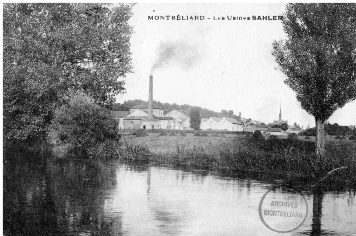
Montbéliard - Les usines Sahler.

25, Montbéliard, 97, 99 faubourg de Besançon