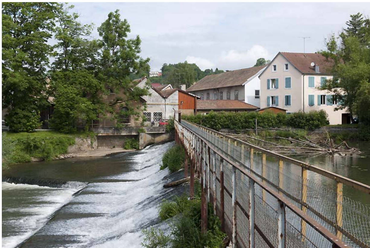
Vue d'ensemble depuis l'extrémité sud du barrage. 25, Montbéliard