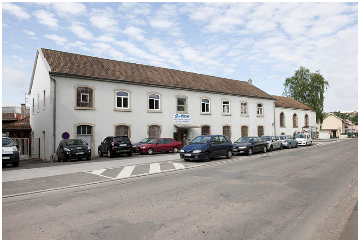
Bâtiment administratif (?) longeant le faubourg de Besançon.

25, Montbéliard, 97, 99 faubourg de Besançon