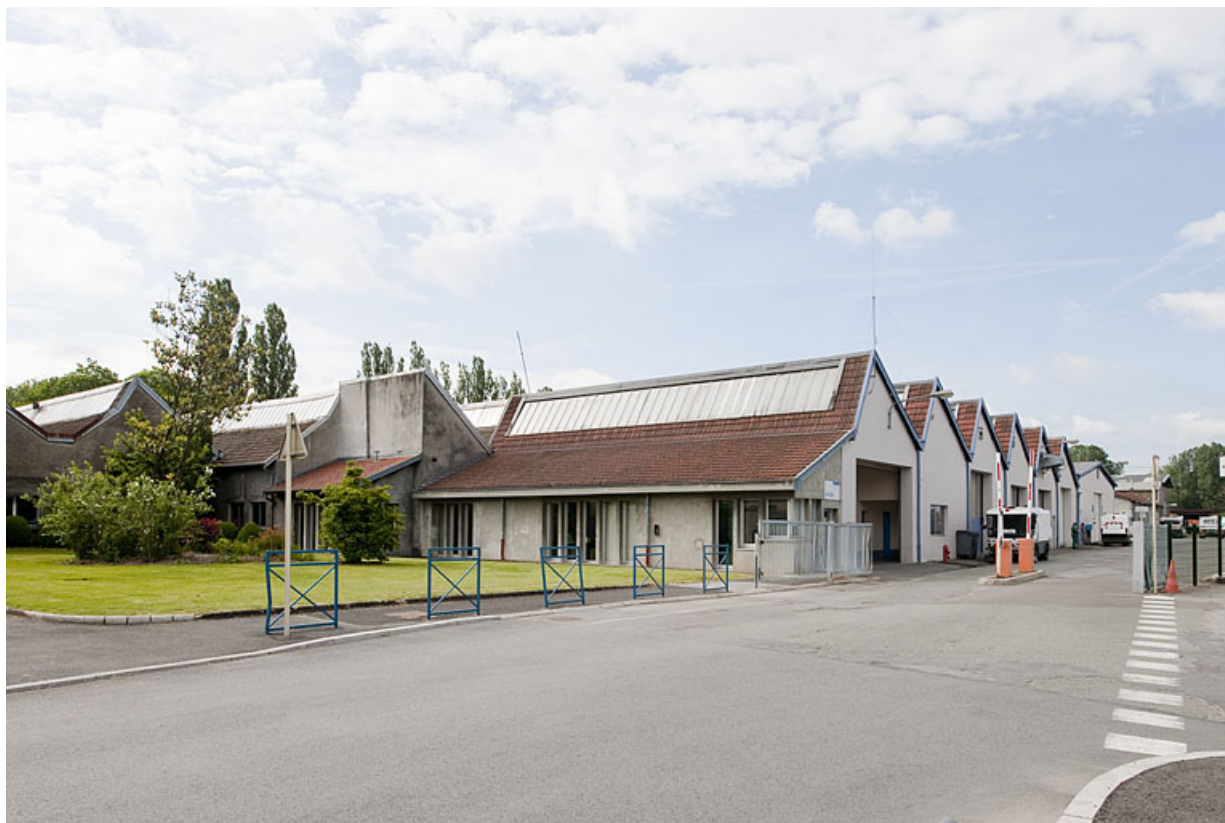
Entrée du site depuis la route.

25, Montbéliard, 97, 99 faubourg de Besançon