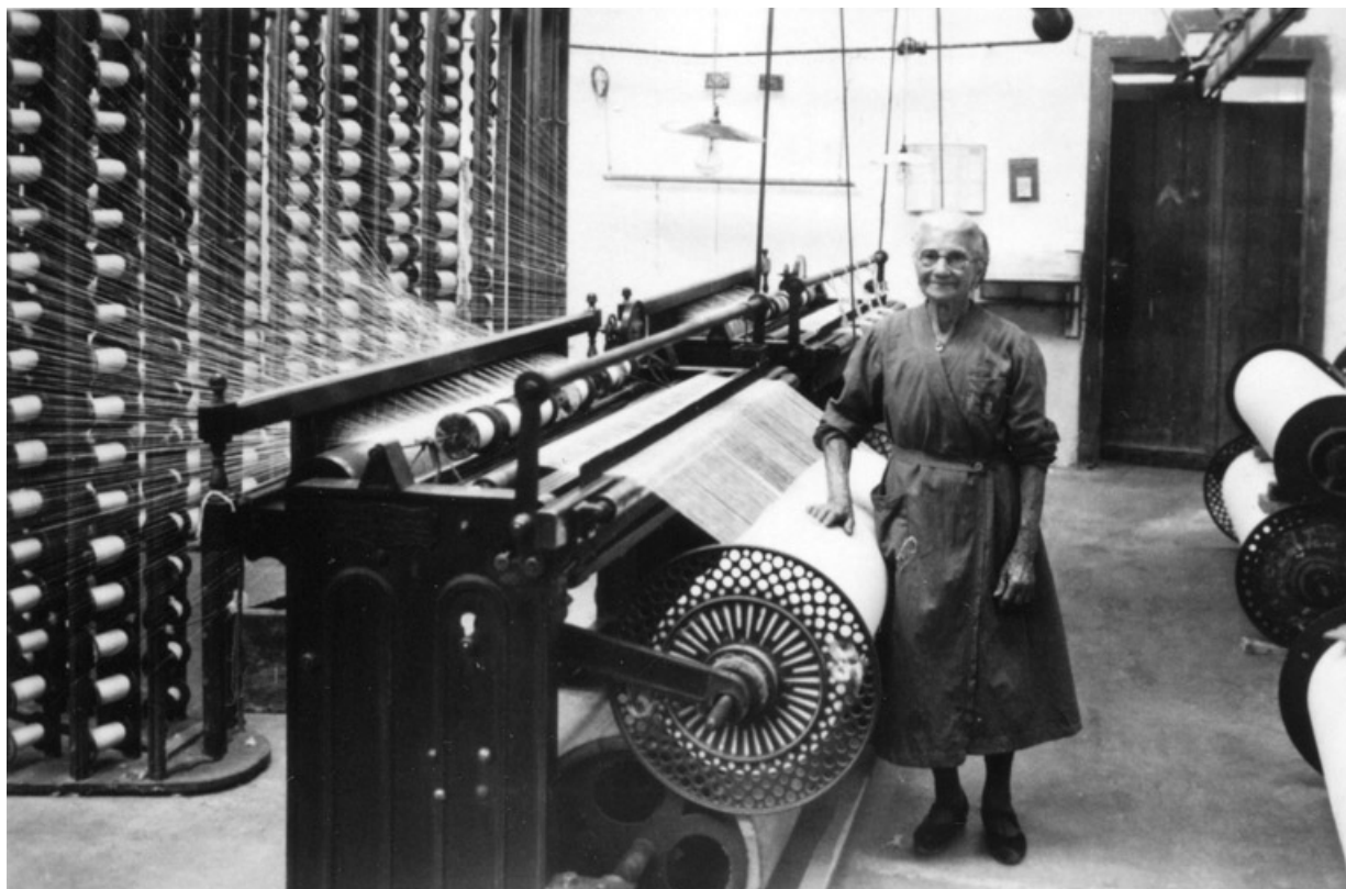
Ouvrière devant un ourdissoir.

25, Montbéliard, 97, 99 faubourg de Besançon