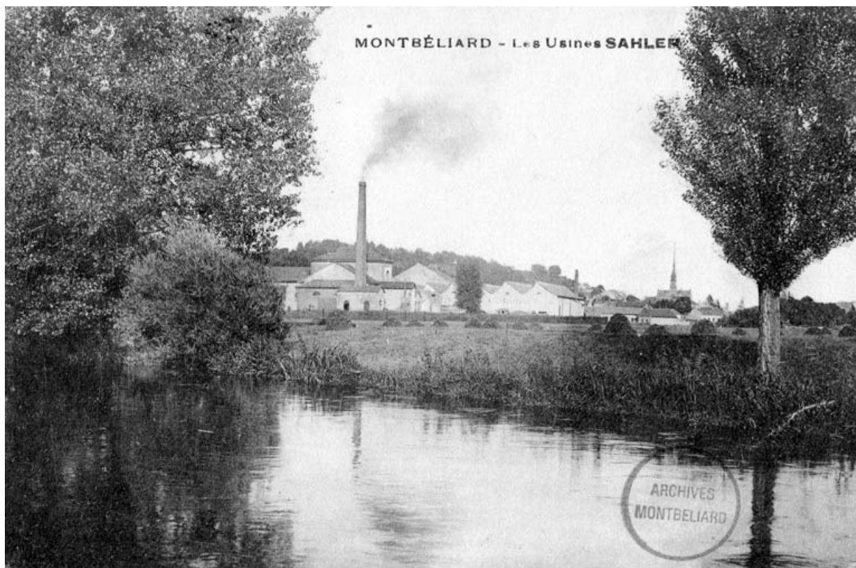
Montbéliard - Les usines Sahler.

25, Montbéliard, 97, 99 faubourg de Besançon