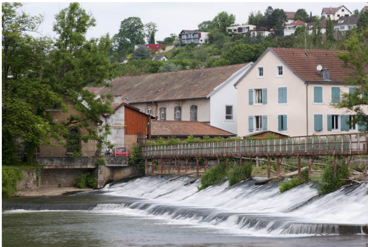
Barrage et bâtiments de la filature depuis le sud.

25, Montbéliard, 97, 99 faubourg de Besançon