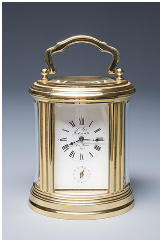
Pendulette d'officier L'Epée.