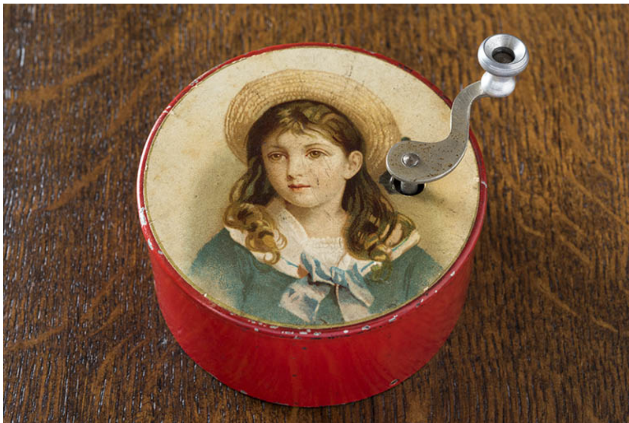
Boîte à musique, vers 1880 (collection Jean Lenôte, Seloncourt). 25, Sainte-Suzanne, 61 rue de Besançon