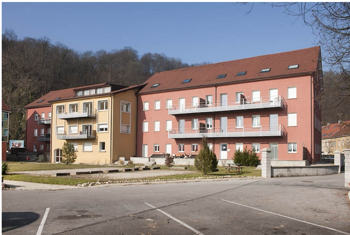
Façade postérieure des bâtiments sur rue (ateliers de fabrication et d'outillage, bureau d'études, service administratif). 25, Sainte-Suzanne, 61 rue de Besançon