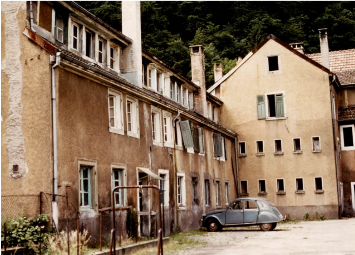
Façade sur cour de l'aile sud.