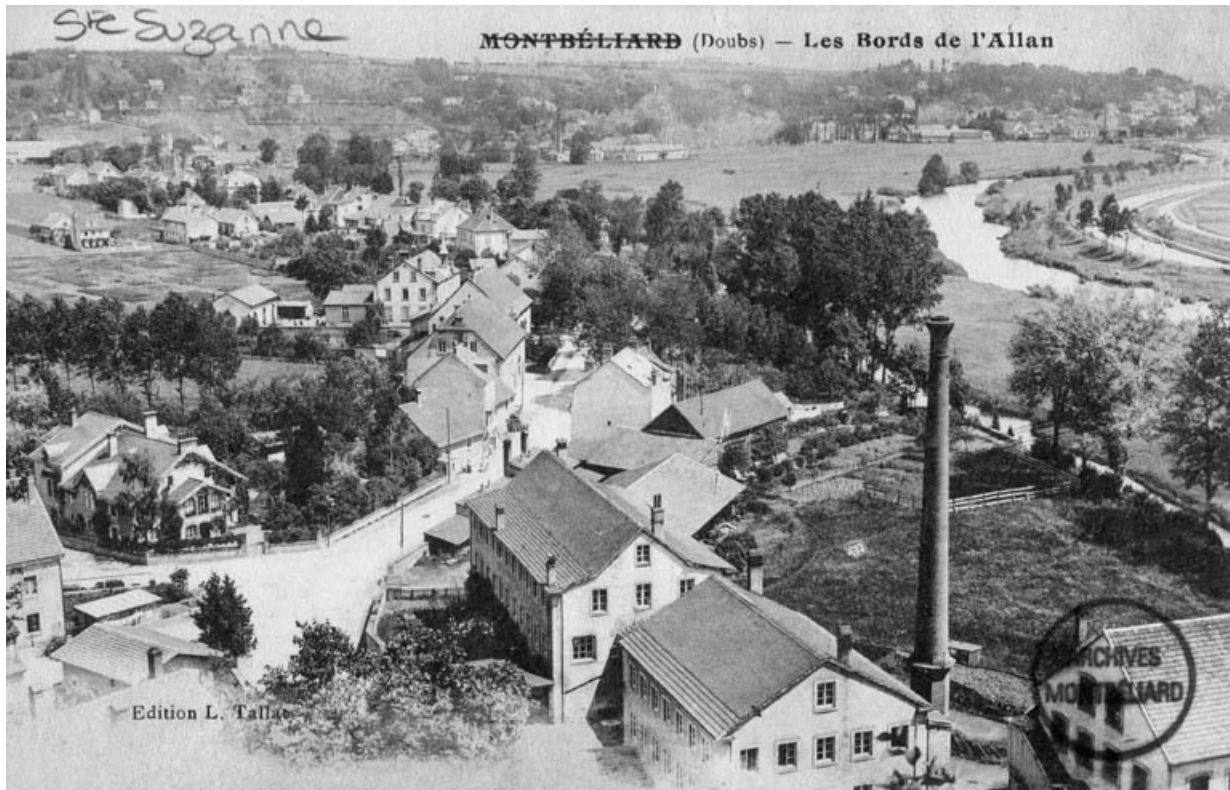
Montbéliard (Doubs) - Les bords de l'Allain.