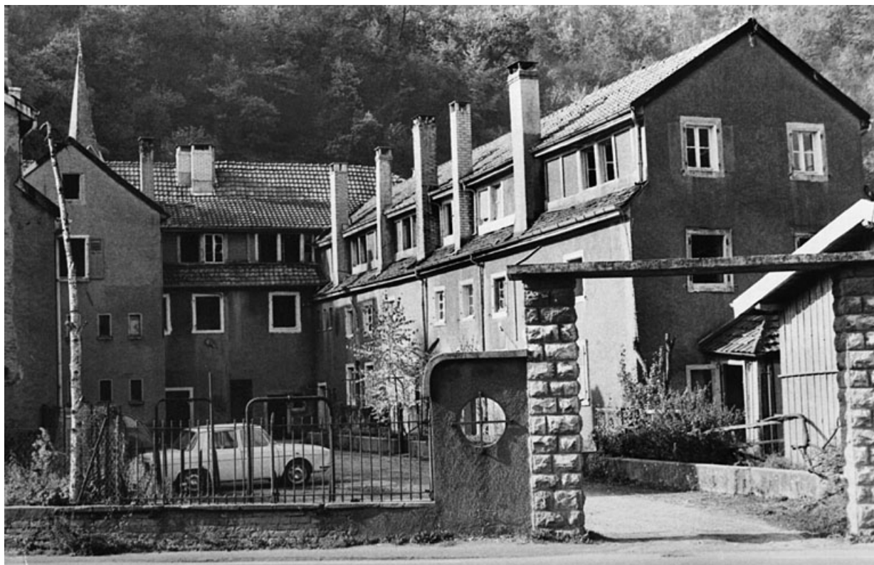
Bâtiments industriels situés à l'ouest de la route nationale.