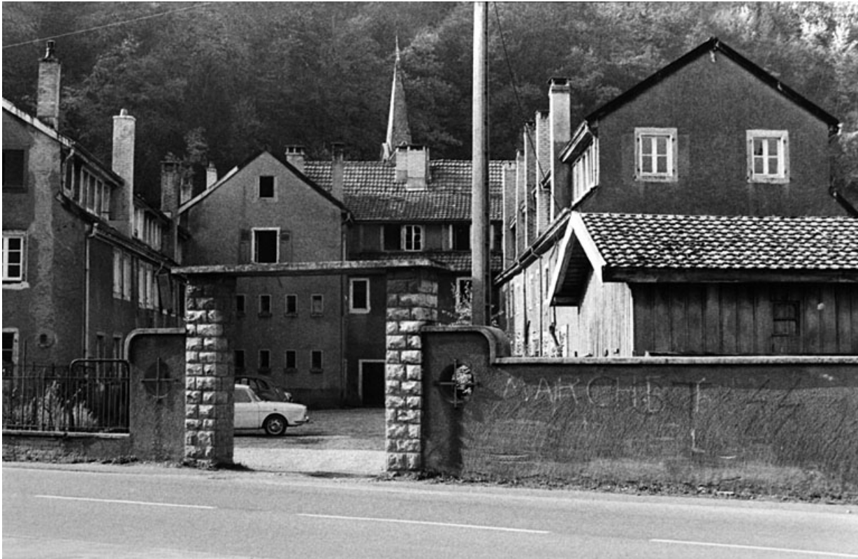
Bâtiments industriels situés à l'ouest de la route nationale.