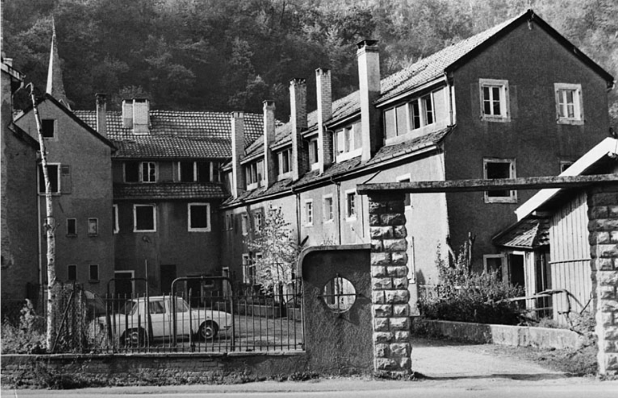
Bâtiments industriels situés à l'ouest de la route nationale. 25, Sainte-Suzanne, 61 rue de Besançon