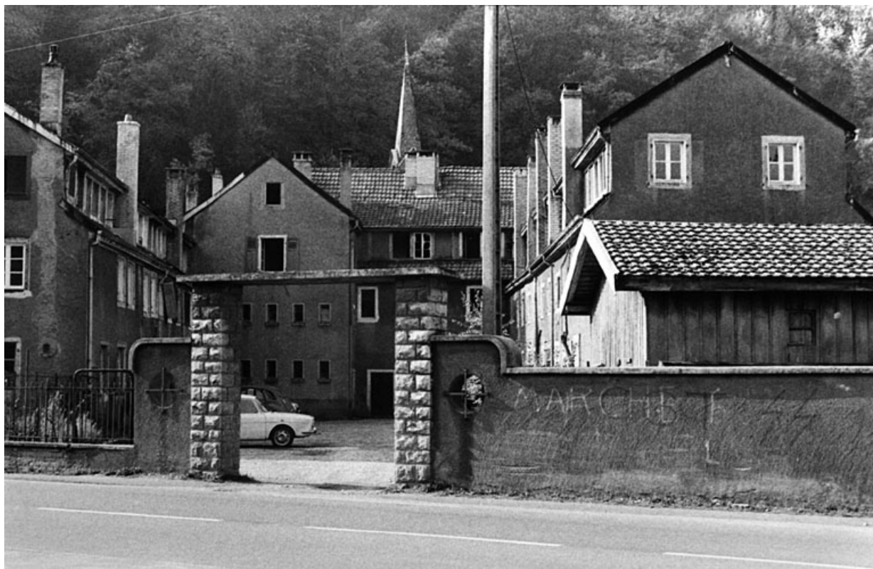
Bâtiments industriels situés à l'ouest de la route nationale.