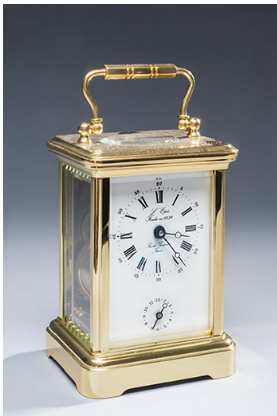
Pendulette d'officier l'Epée. Vue de trois quarts.