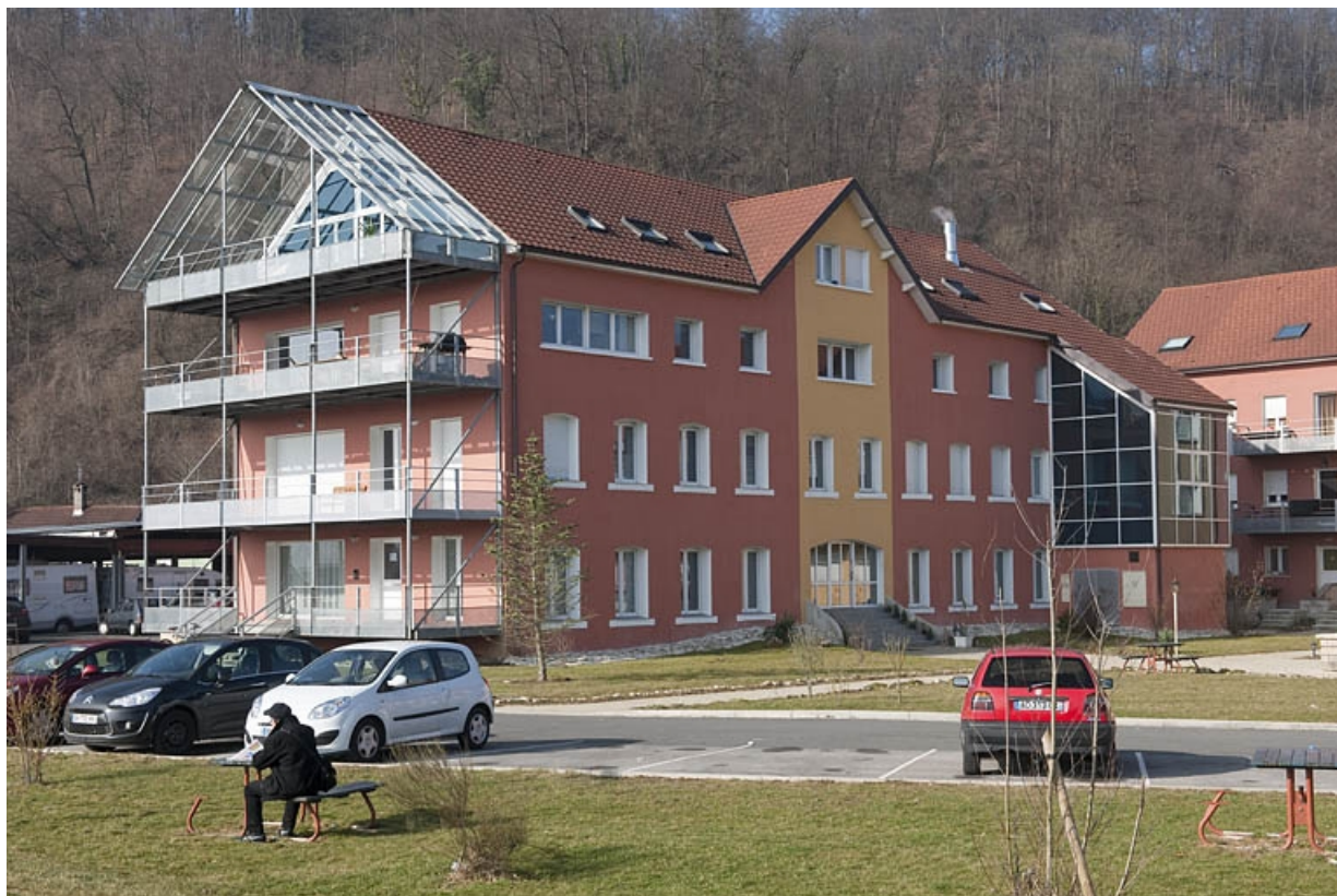
Atelier de fabrication vu de trois quarts. 25, Sainte-Suzanne, 61 rue de Besançon