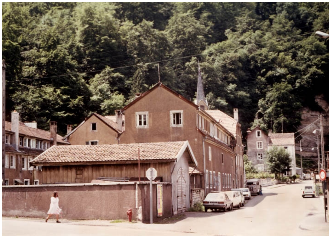
Vue d'ensemble des ateliers d'origine, depuis l'est.