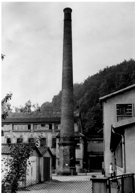
Cheminée de l'usine.