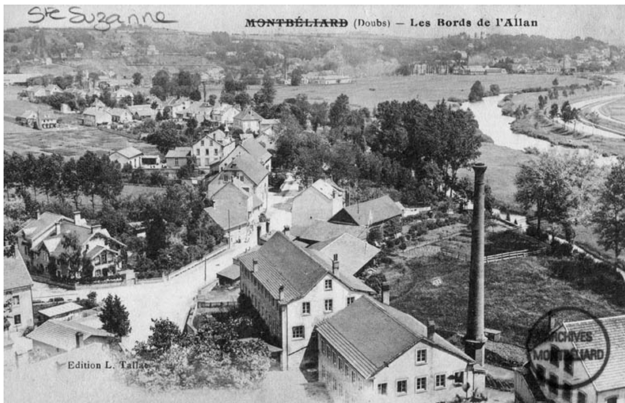
Montbéliard (Doubs) - Les bords de l'Allan.