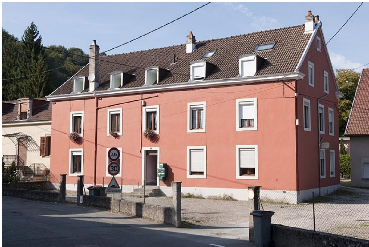
Logement ouvrier (2 rue de la République). 25, Sainte-Suzanne, 61 rue de Besançon