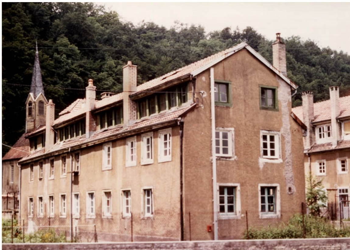
Vue d'ensemble des ateliers d'origine, depuis le sud-est.