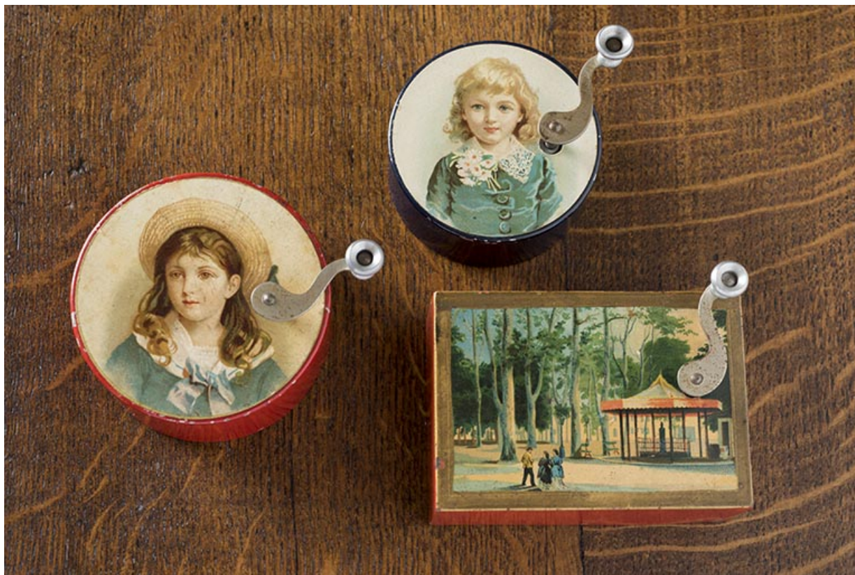
Ensemble de boîtes à musique L'Epée (collection Jean Lenôtre, Seloncourt).