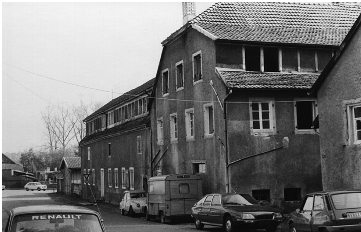
Vue des bâtiments depuis l'ouest.