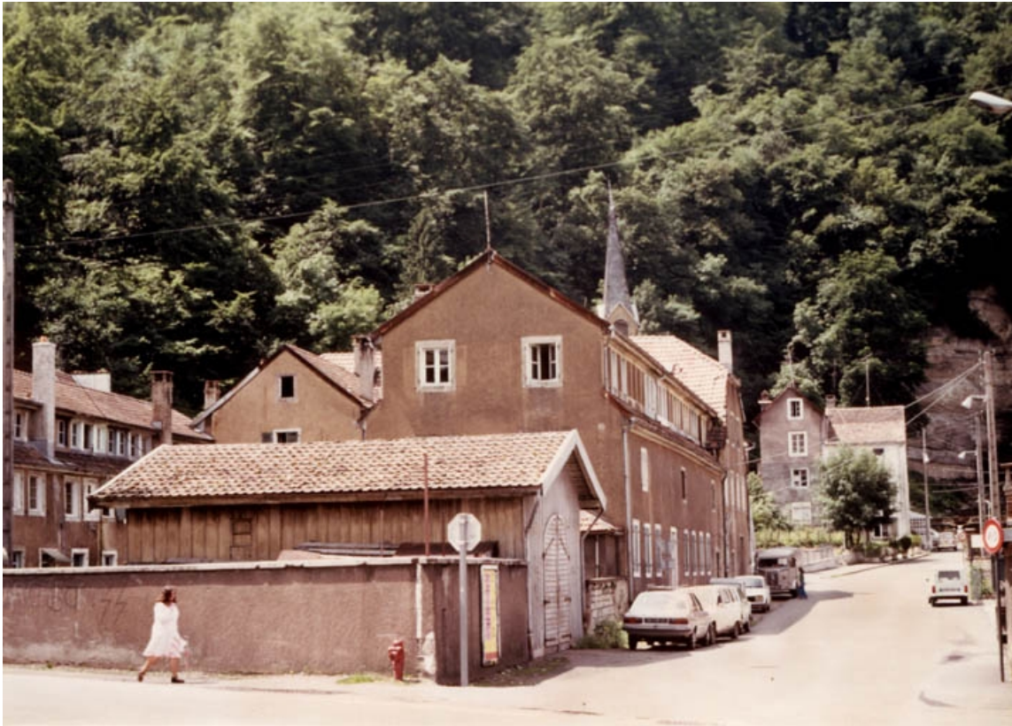
Vue d'ensemble des ateliers d'origine, depuis l'est.