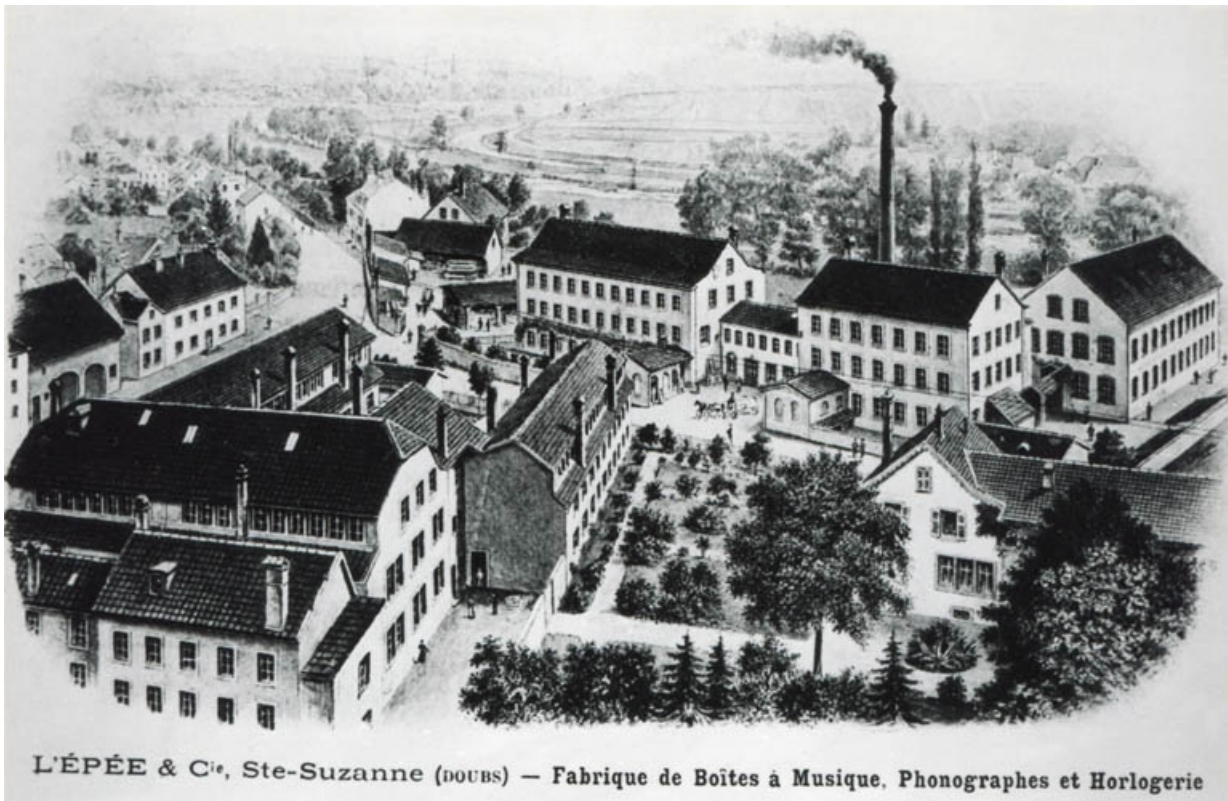
L'Épée et Cie, Sainte-Suzanne (Doubs) - Fabrique de boîtes à musique, phonographes et horlogerie. 25, Sainte-Suzanne, 61 rue de Besançon