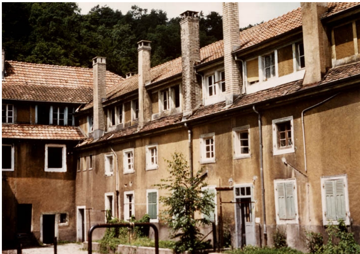
Façade sur cour de l'aile nord.