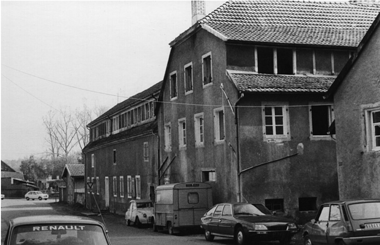
Vue des bâtiments depuis l'ouest.