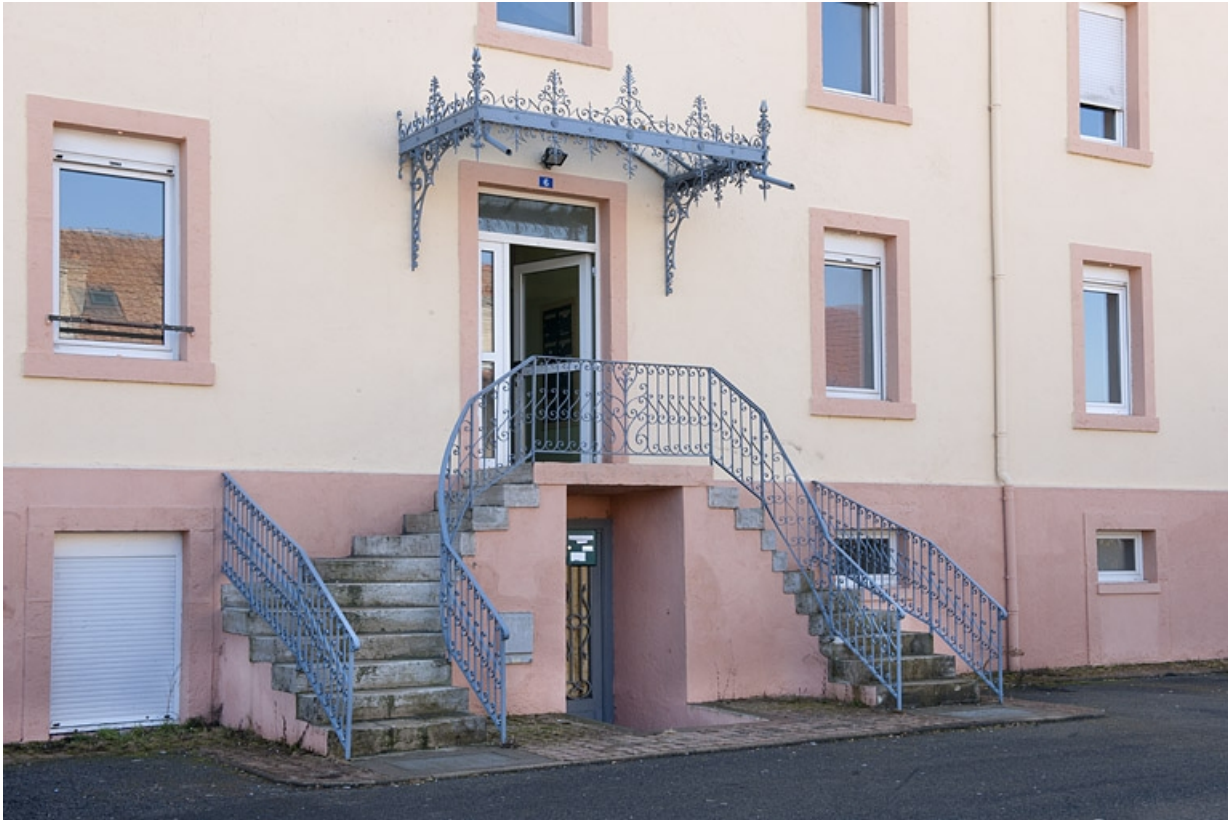
Façade antérieure. Entrée principale.

25, Fesches-le-Châtel, 6 impasse des Sapins