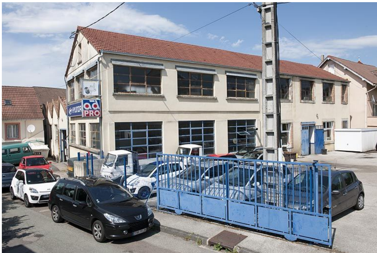
Atelier de fabrication vu de trois quarts. 25, Étupes, 1 rue Emile Beley