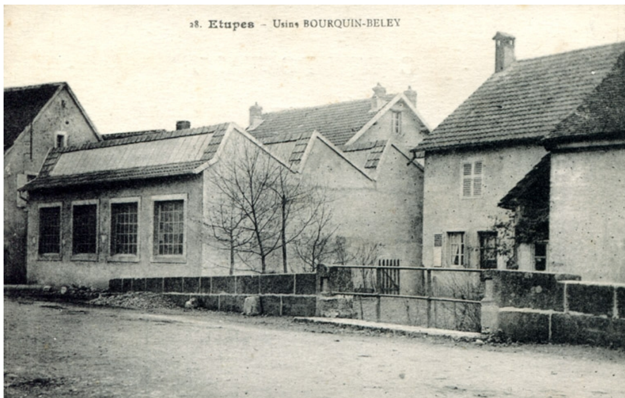
Etupes - Usine Bourquin-Beley.