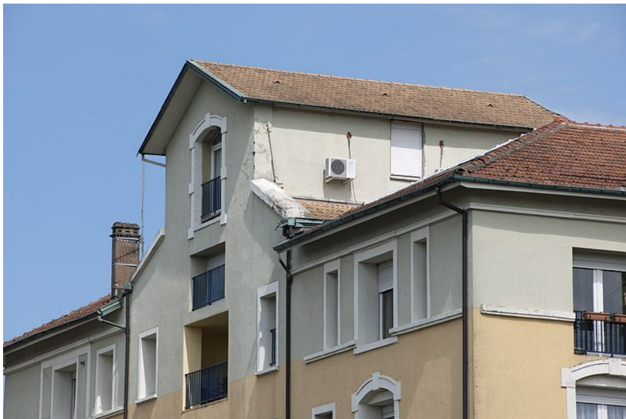
Partie supérieure de la façade postérieure. 25, Étupes avenue du général de Gaulle