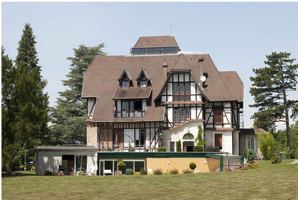
Façade sud depuis le parc. 25, Exincourt rue sur le Mont