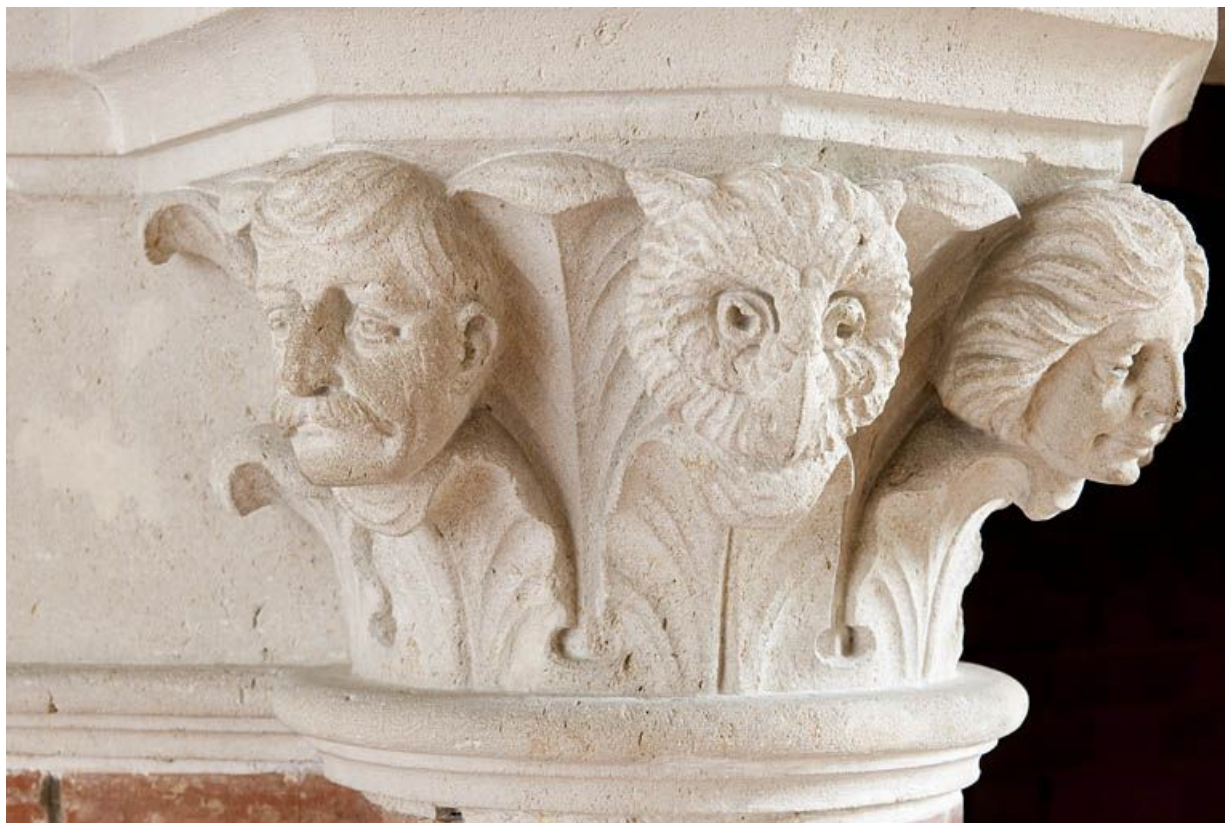
Cheminée du salon. Chapiteau sculpté.