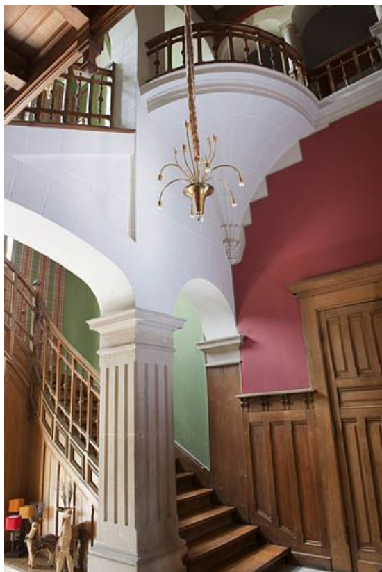
Cage d'escalier depuis le rez-de-chaussée. 25, Exincourt rue sur le Mont