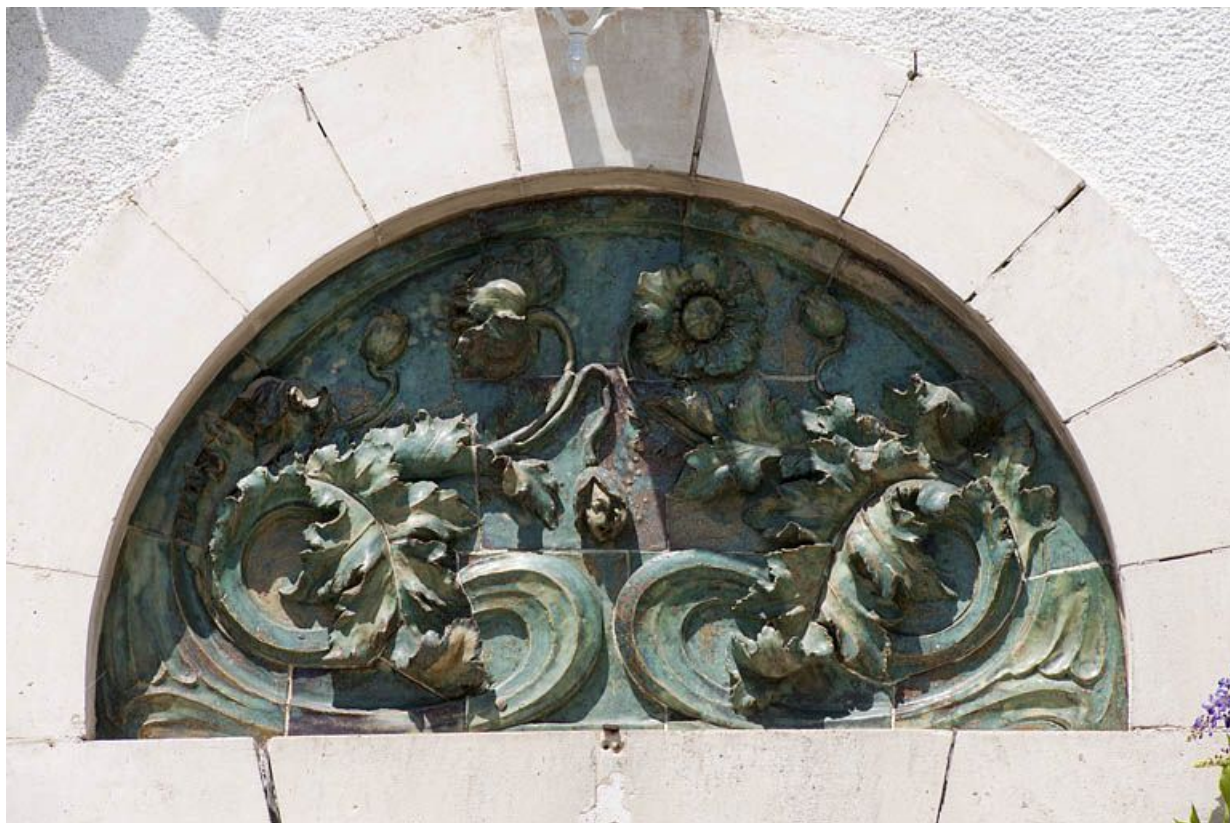
Tympan orné de terre cuite. 25, Exincourt rue sur le Mont