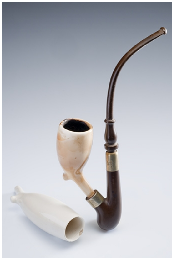
Pipe en ébonite, bois et faïence.

25, Villars-lès-Blamont, 11 rue de Damvant