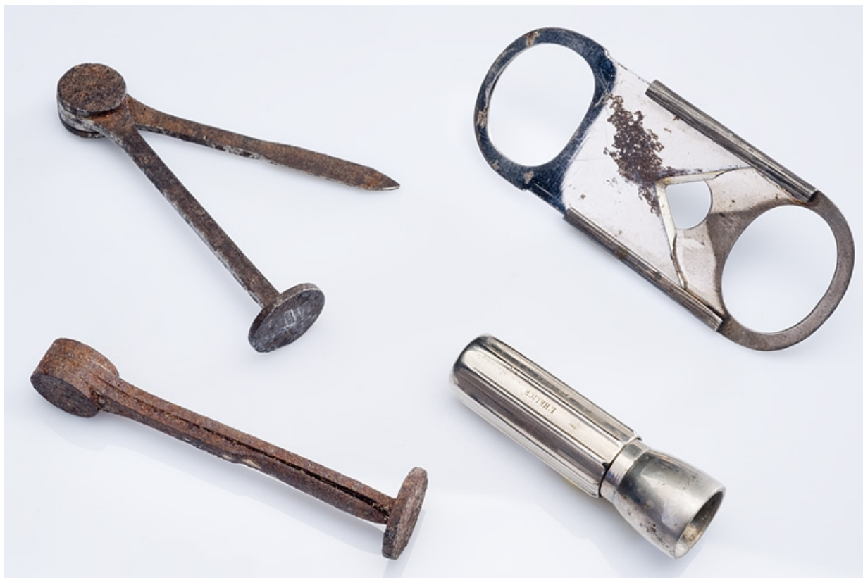
Cure-pipes, perfore-cigares et coupe-cigares.