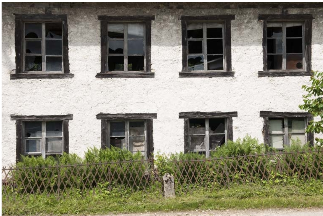
Détail de la façade est de l'atelier.

25, Villars-lès-Blamont, 11 rue de Damvant