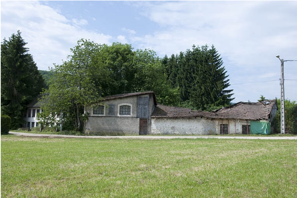
Vue d'ensemble depuis le nord-est.

25, Villars-lès-Blamont, 11 rue de Damvant