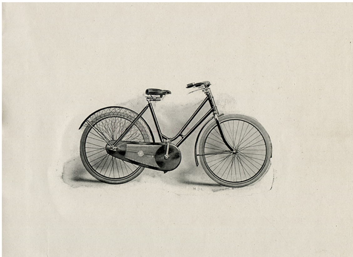
[Bicyclette pour dames ou ecclésiastiques], [décennies 1890-1900]. Document extrait d'un catalogue de production : Automobiles, motocyclettes, vélocipèdes Jeanperrin Frères [...]

25, Glay, 8 rue des Automobiles JeanPerrin