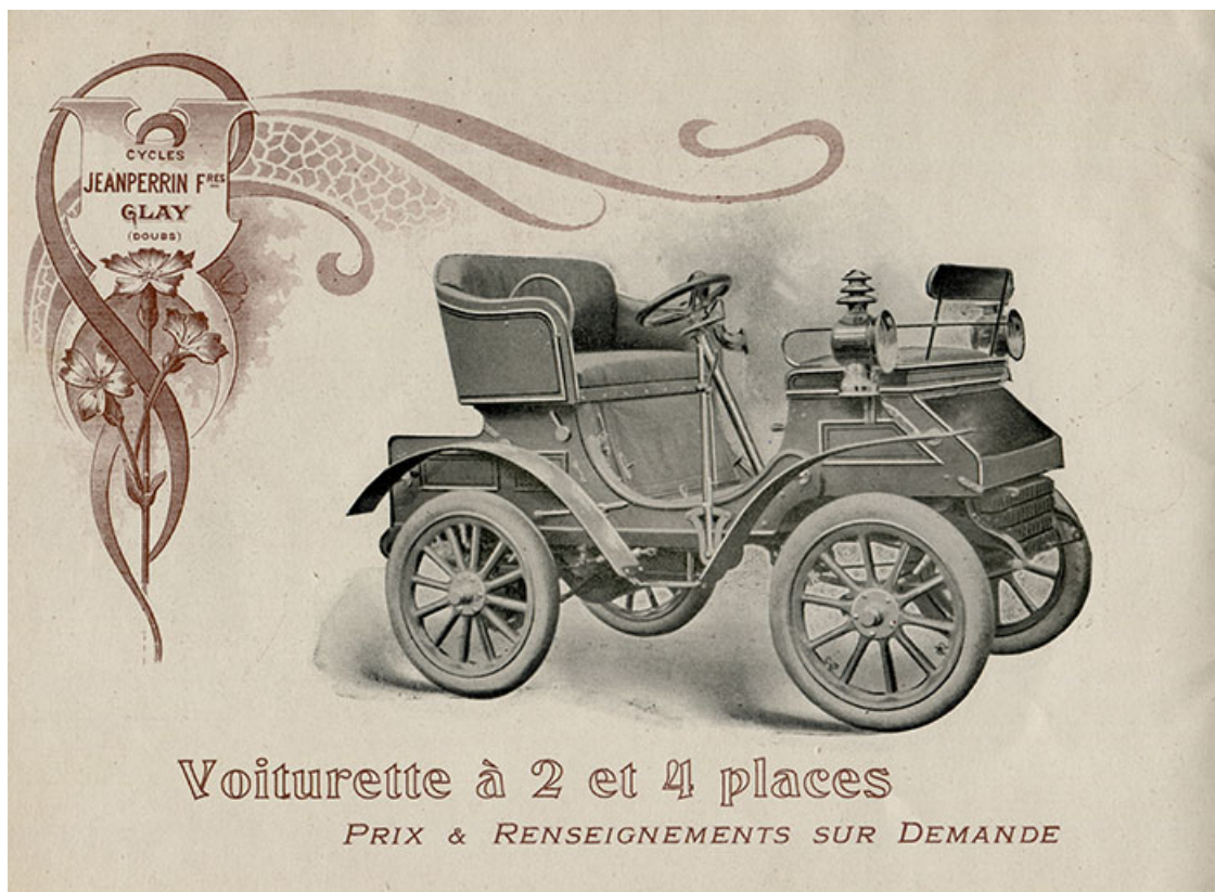
Voiturette à 2 et 4 places, [décennies 1890-1900]. Document extrait d'un catalogue de production : Automobiles, motocyclettes, vélocipèdes Jeanperrin Frères [...]

25, Glay, 8 rue des Automobiles JeanPerrin