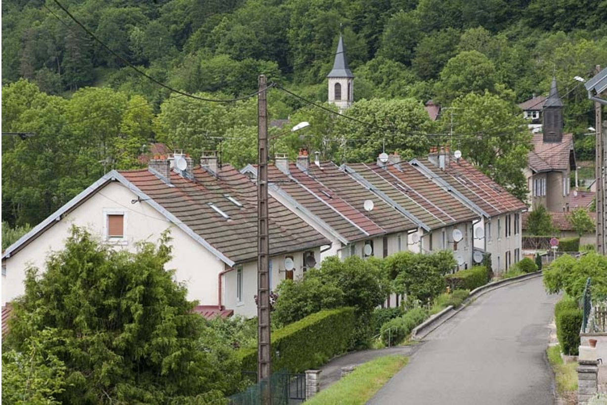
Logements ouvriers depuis le sud.

25, Glay, 8 rue des Automobiles JeanPerrin