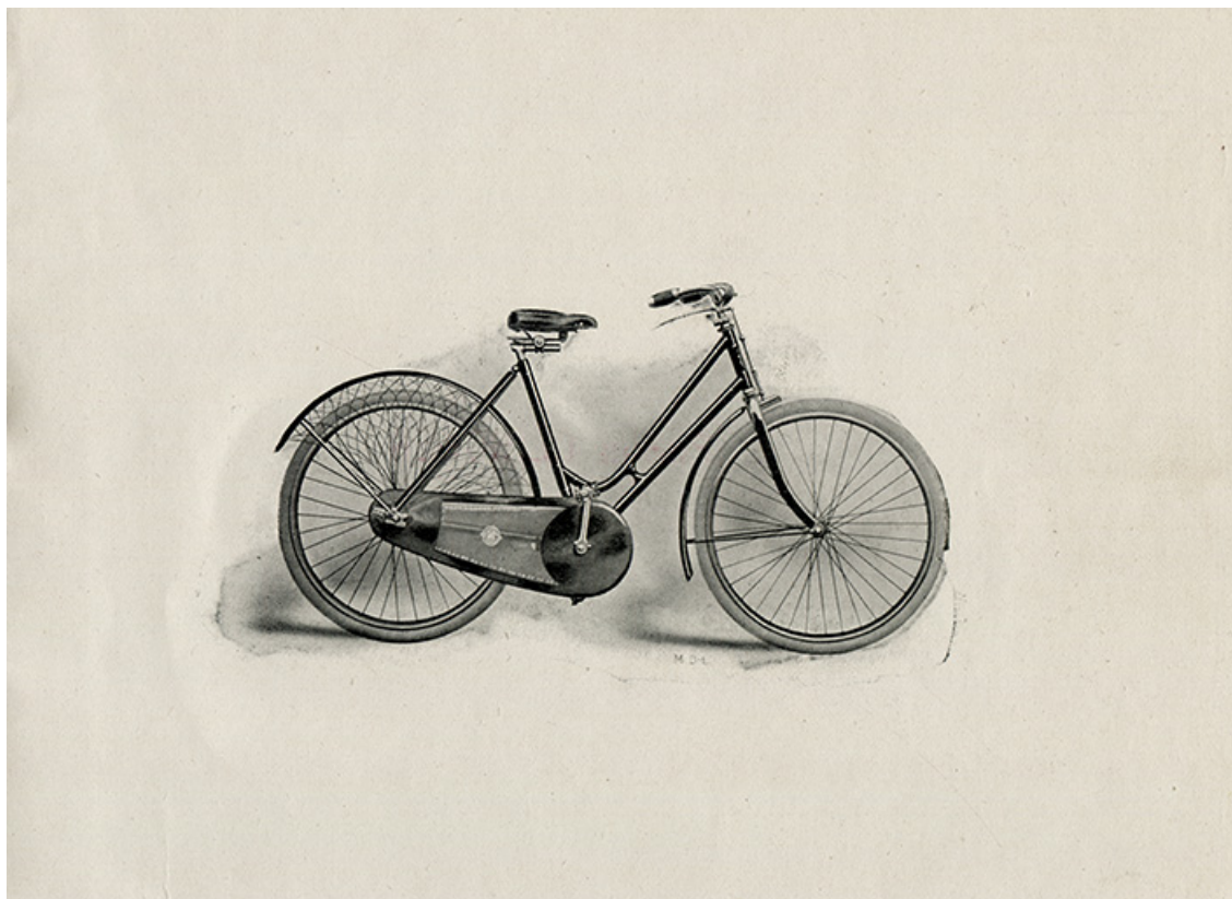
[Bicyclette pour dames ou ecclésiastiques], [décennies 1890-1900]. Document extrait d'un catalogue de production : Automobiles, motocyclettes, vélocipèdes Jeanperrin Frères [...]

25, Glay, 8 rue des Automobiles JeanPerrin