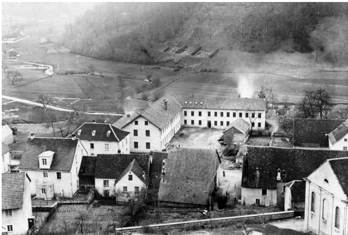
[L'usine Jeanperrin à Glay en 1895].

25, Glay, 8 rue des Automobiles JeanPerrin