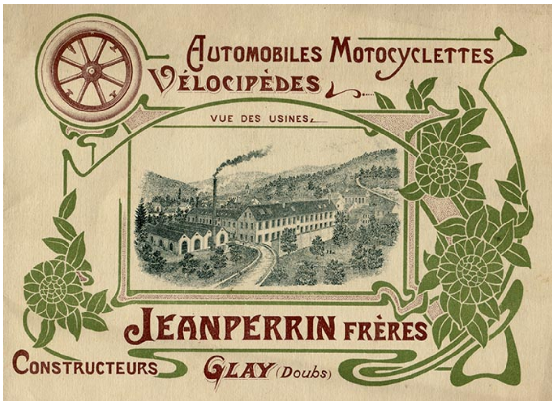
Automobiles, motocyclettes, vélocipèdes Jeanperrin Frères constructeurs, Glay (Doubs) [catalogue de production : 1ère de couverture], [décennies 1890-1900].

25, Glay, 8 rue des Automobiles JeanPerrin