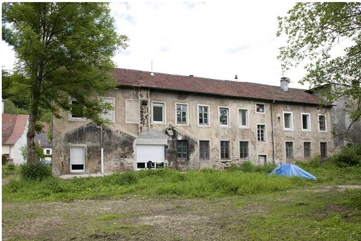
Façade postérieure des logements et bureaux.

25, Glay, 8 rue des Automobiles JeanPerrin