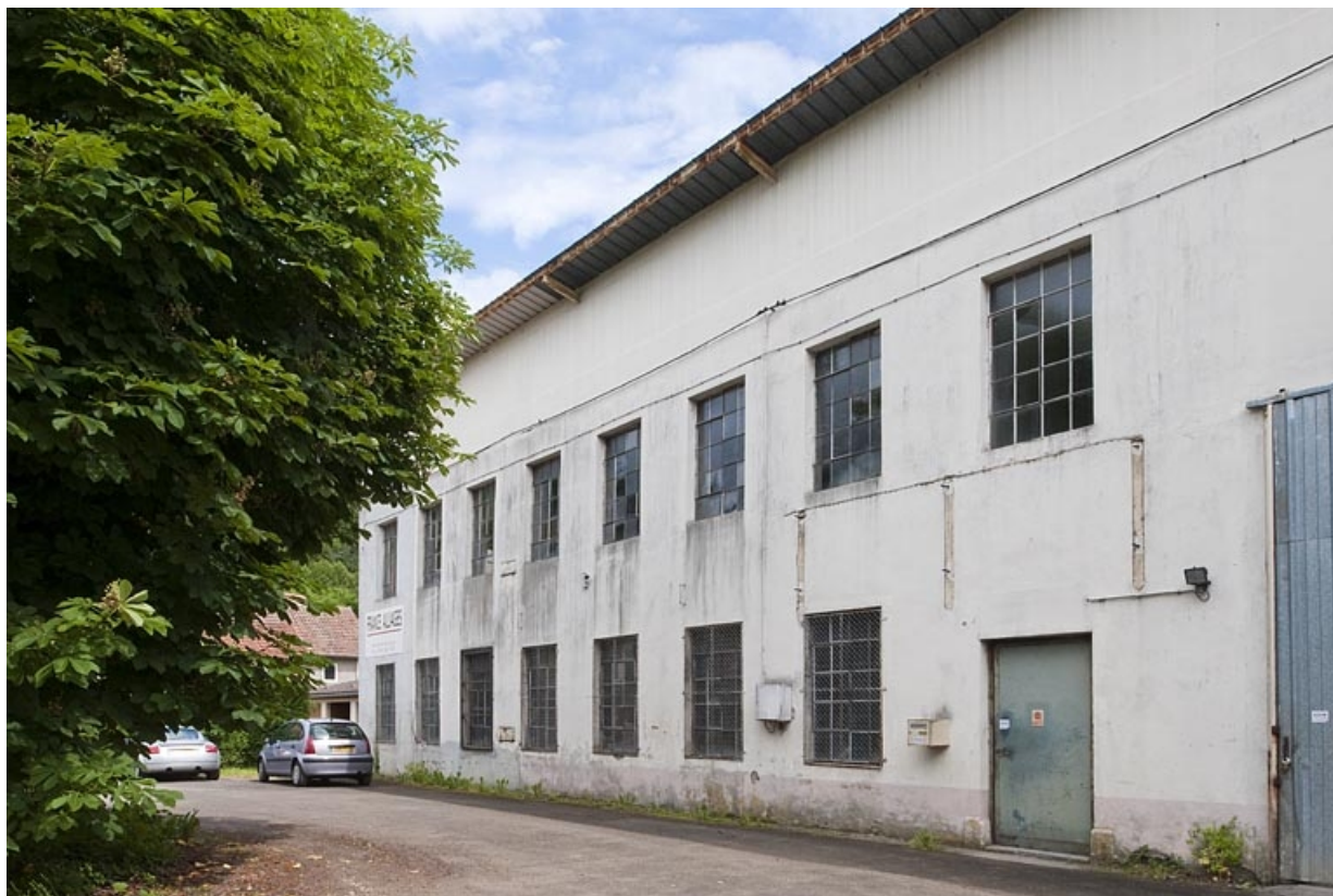
Façade nord de l'atelier de fabrication.

25, Glay, 8 rue des Automobiles JeanPerrin