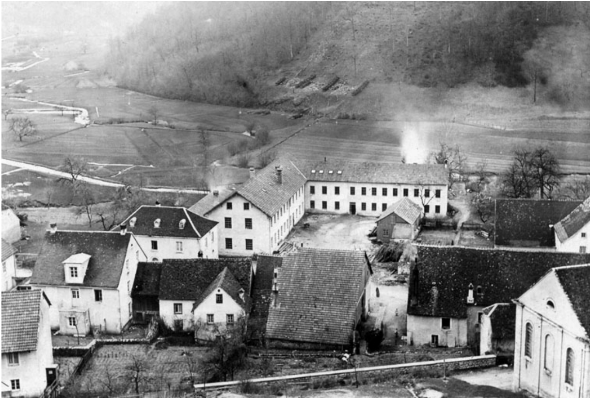
[L'usine Jeanperrin à Glay en 1895]. 25, Glay, 8 rue des Automobiles JeanPerrin