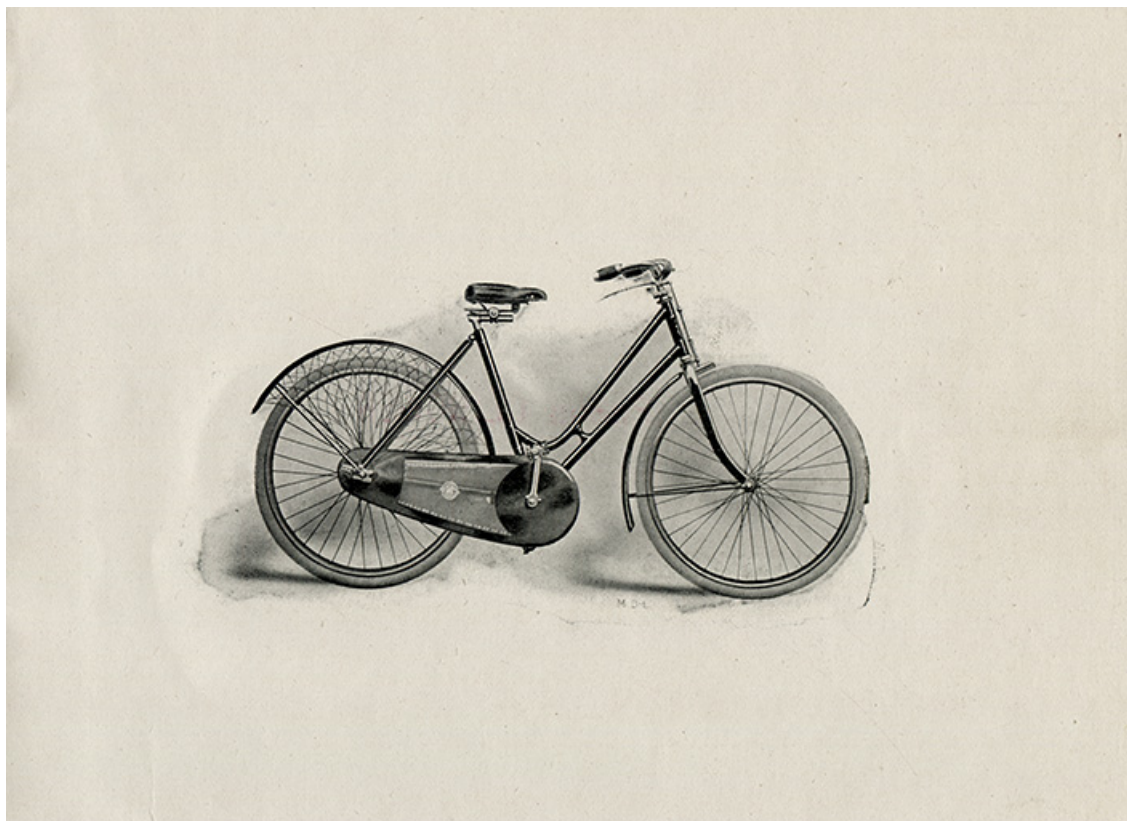
[Bicyclette pour dames ou ecclésiastiques], [décennies 1890-1900]. Document extrait d'un catalogue de production : Automobiles, motocyclettes, vélocipèdes Jeanperrin Frères [...]

25, Glay, 8 rue des Automobiles JeanPerrin