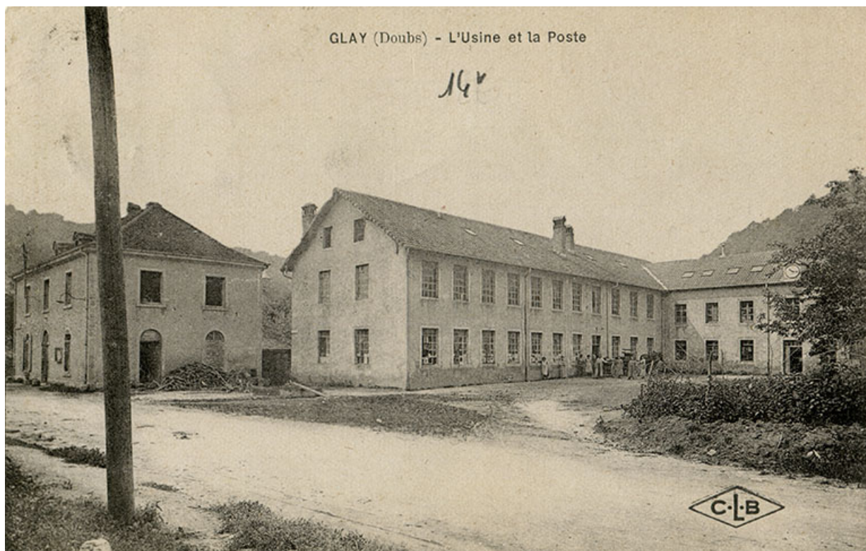
Glay (Doubs) - L'usine et la poste, 1er quart 20e siècle. 25, Glay, 8 rue des Automobiles JeanPerrin