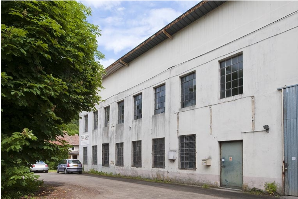
Façade nord de l'atelier de fabrication.

25, Glay, 8 rue des Automobiles JeanPerrin