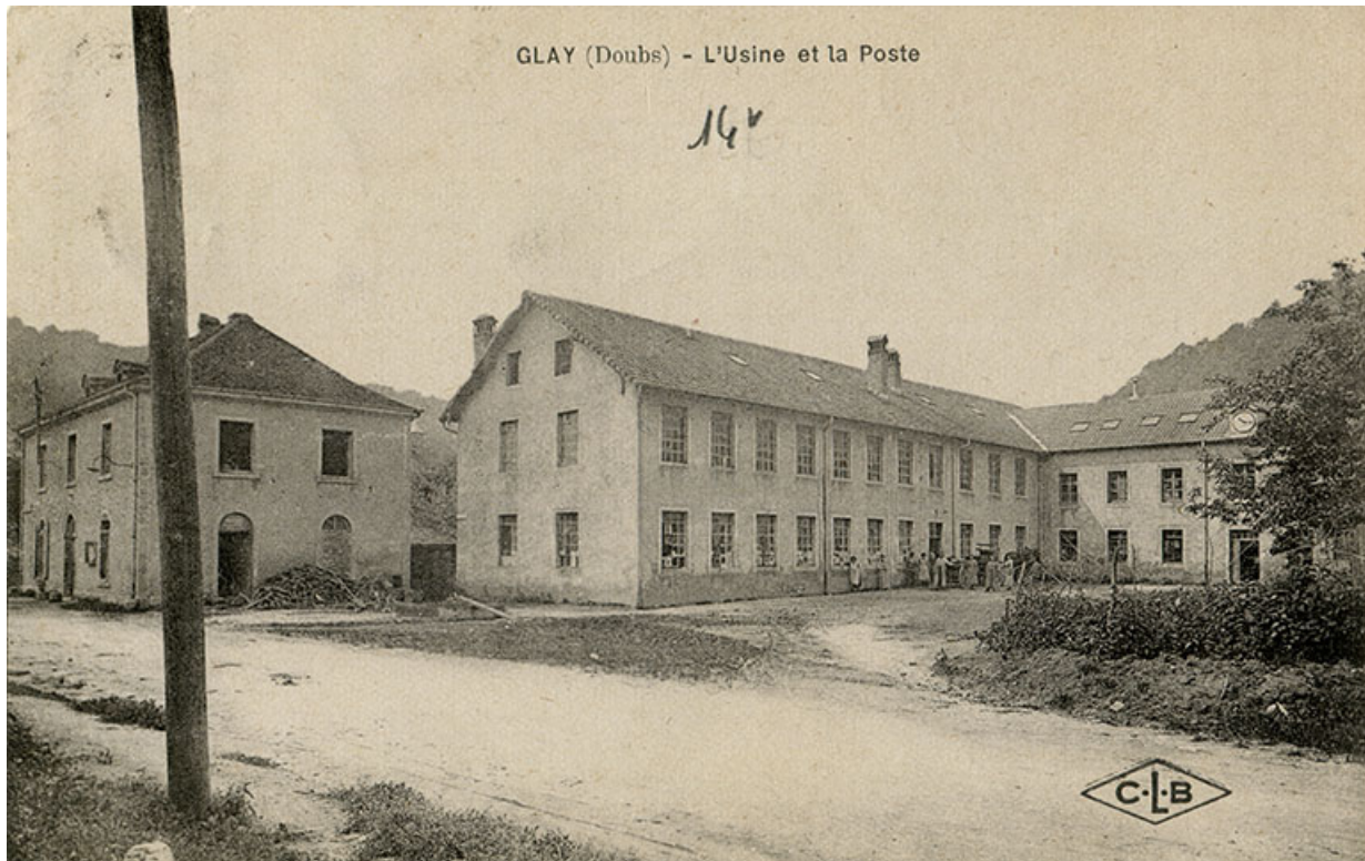
Glai (Doubs) - L'usine et la poste, 1er quart 20e siècle. 25, Glai, 8 rue des Automobiles JeanPerrin