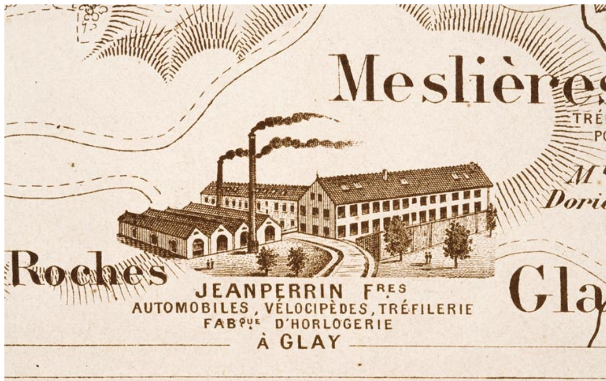
Plan monumental des grandes usines [...]. Automobiles, vélocipèdes, tréfilerie, fabrique d'horlogerie Jeanperrin Frères [détail]. 25, Glay, 8 rue des Automobiles JeanPerrin