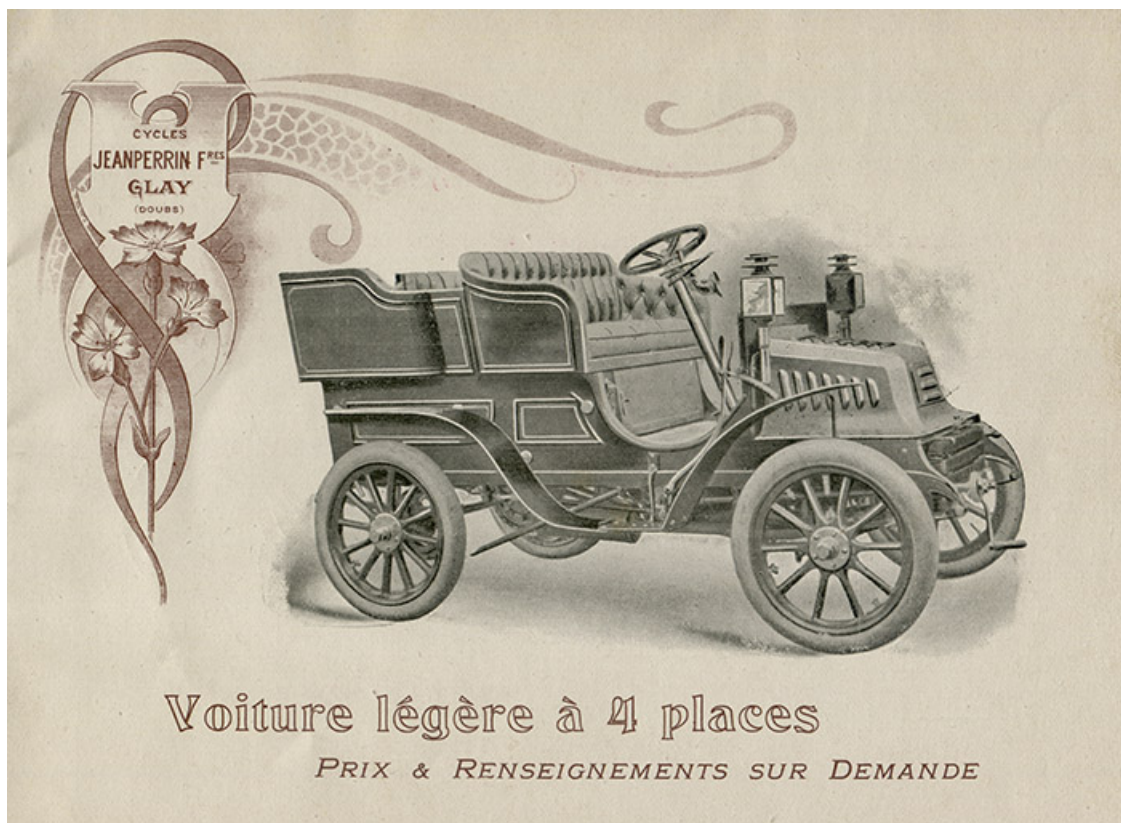
Voiture légère à 4 places, [décennies 1890-1900]. Document extrait d'un catalogue de production : Automobiles, motocyclettes, vélocipèdes Jeanperrin Frères [...]