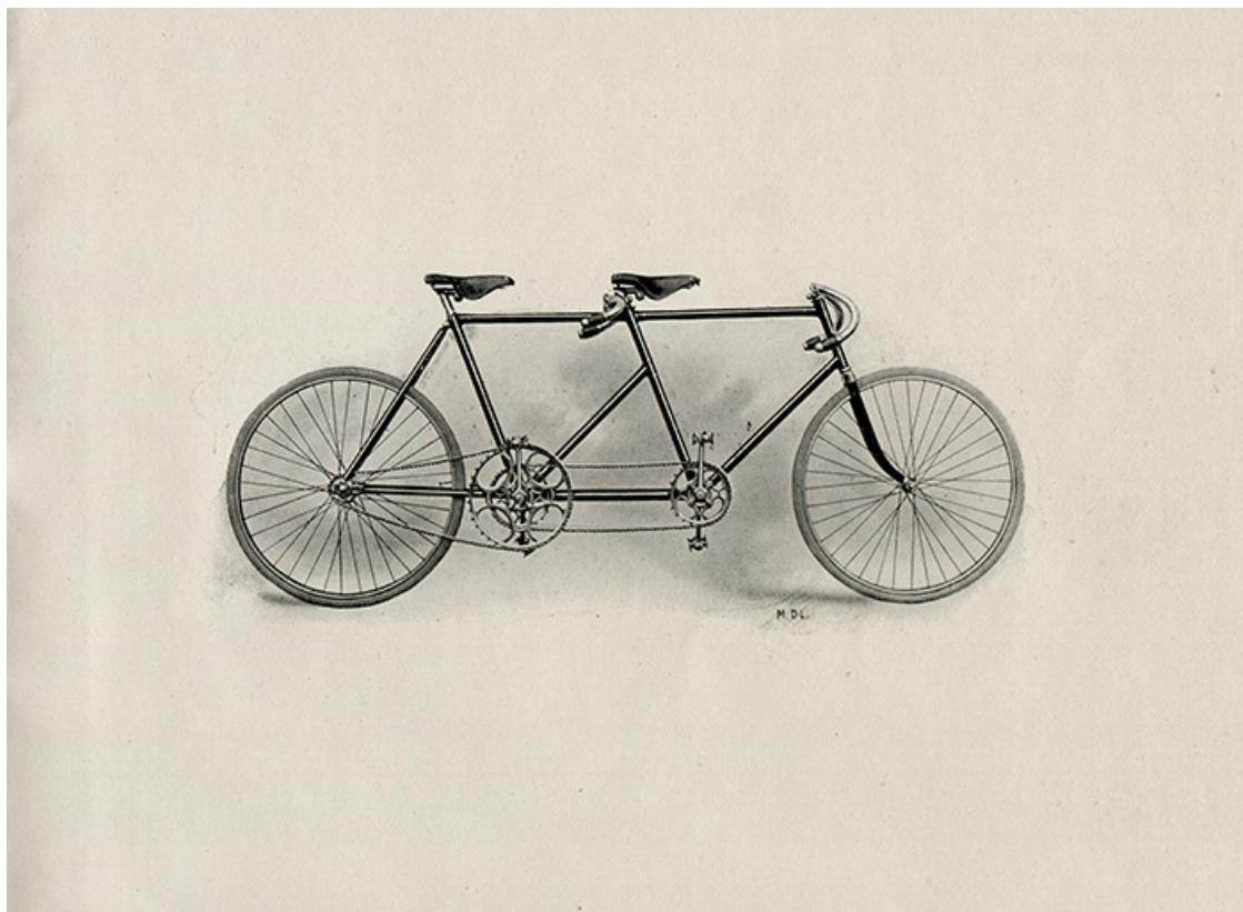
[Tandem], [décennies 1890-1900]. Document extrait d'un catalogue de production : Automobiles, motocyclettes, vélocipèdes Jeanperrin Frères [...]

25, Glay, 8 rue des Automobiles JeanPerrin