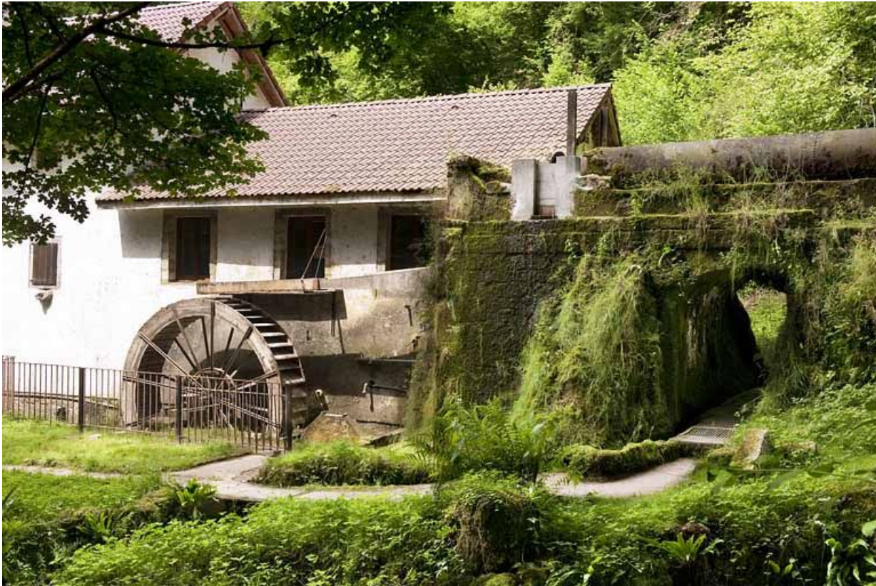
La conduite d'amenée et la roue hydraulique.