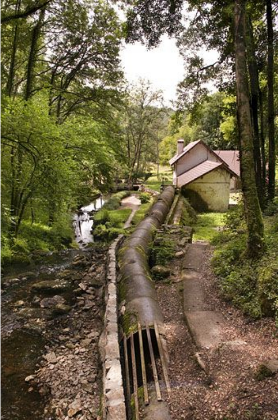
La conduite d'amenée.