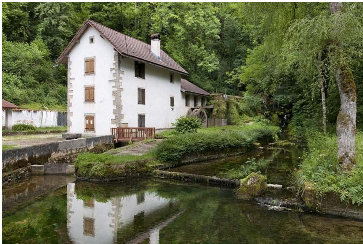
Le moulin et la Doue.