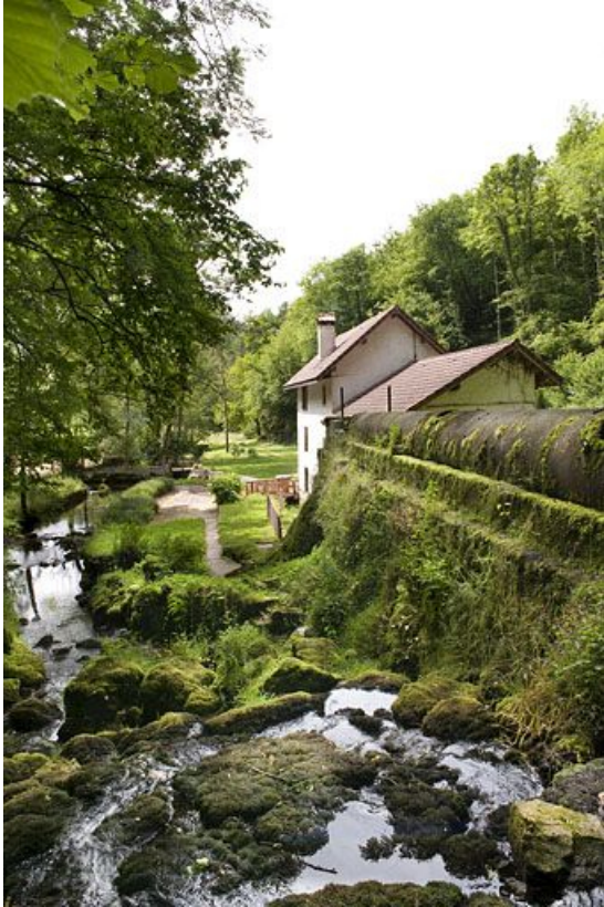
Le moulin vu depuis la source.