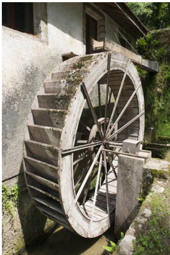
Roue hydraulique vue de trois quarts.