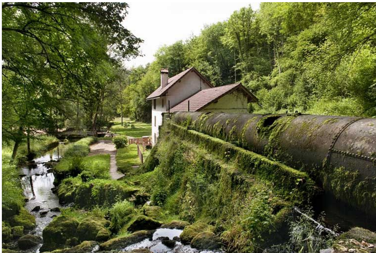
La conduite d'amenée couvert et le moulin vus depuis la source.