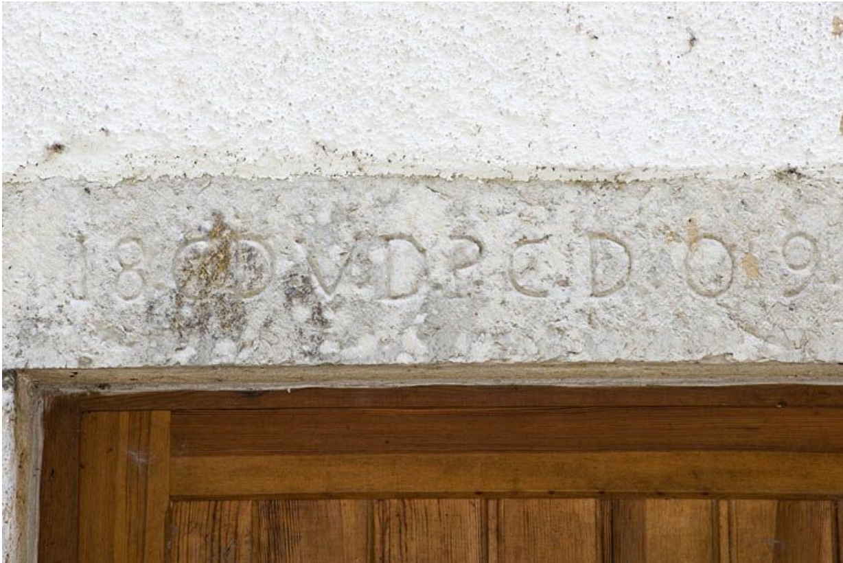
Façade nord du moulin. Linteau gravé.