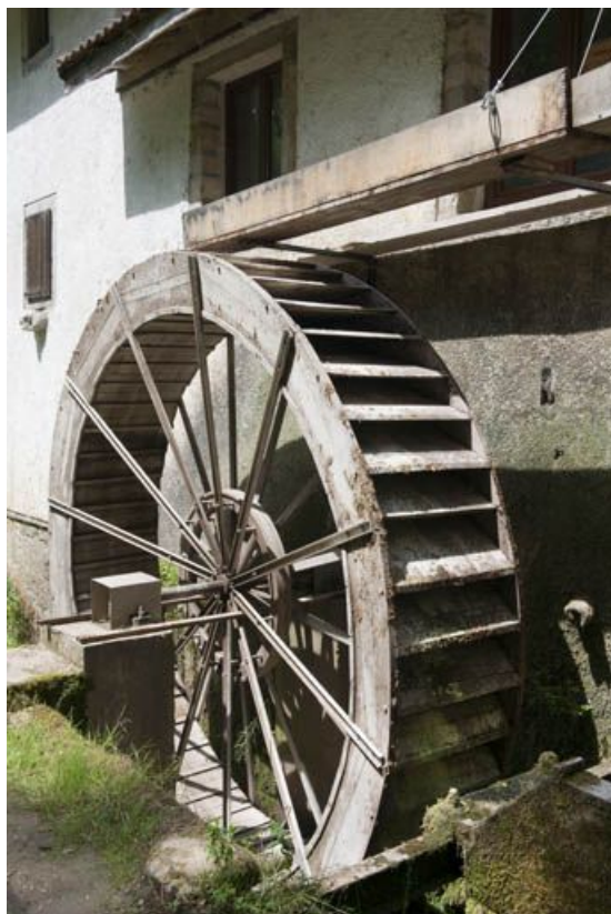
Roue hydraulique et sa huche.