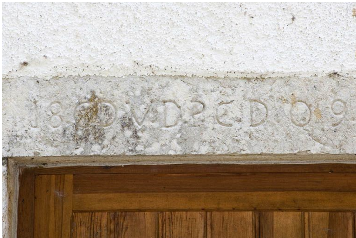
Façade nord du moulin. Linteau gravé.