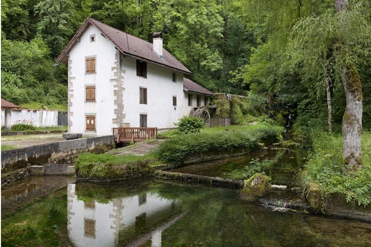
Le moulin et la Doue.