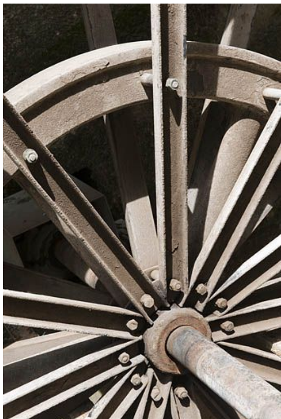
Détail de la roue hydraulique.