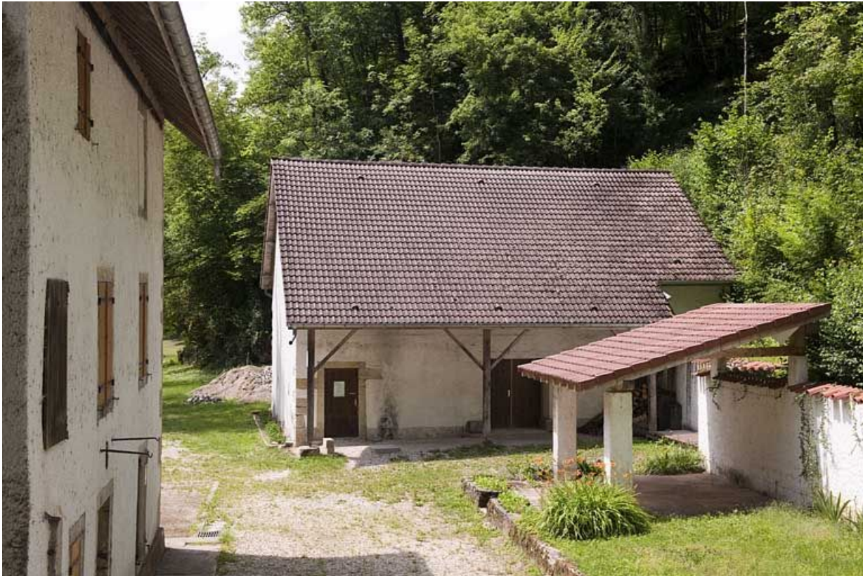
Façade nord du moulin et dépendance agricole.