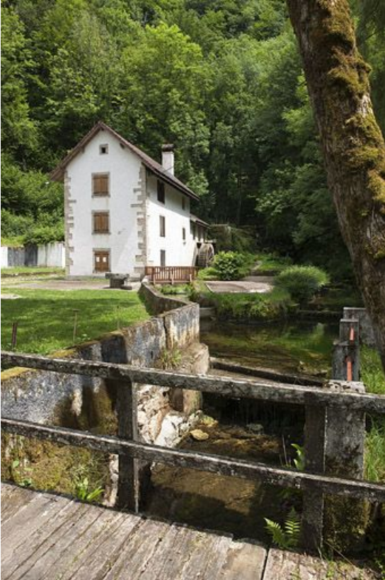
Vue rapprochée depuis l'aval.