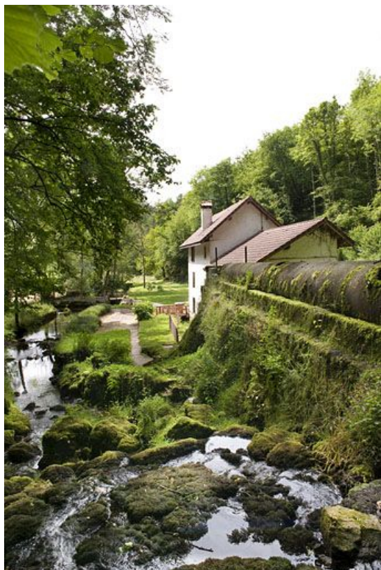
Le moulin vu depuis la source.