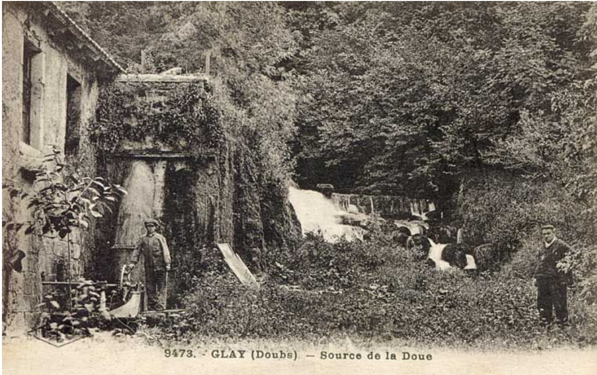
Glays (Doubs) - Source de la Doue : carte postale conservée au Musée du Château de Montbéliard, CLB éd., s.n., s.d. [fin 19e ou début 20e siècle].