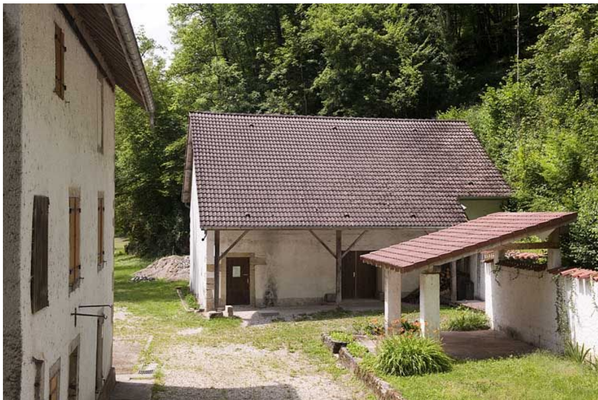
Façade nord du moulin et dépendance agricole.