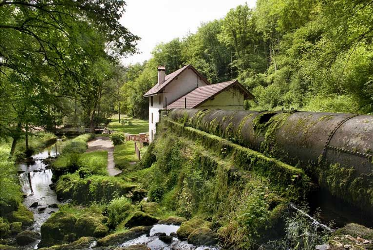
La conduite d'amenée couvert et le moulin vus depuis la source.