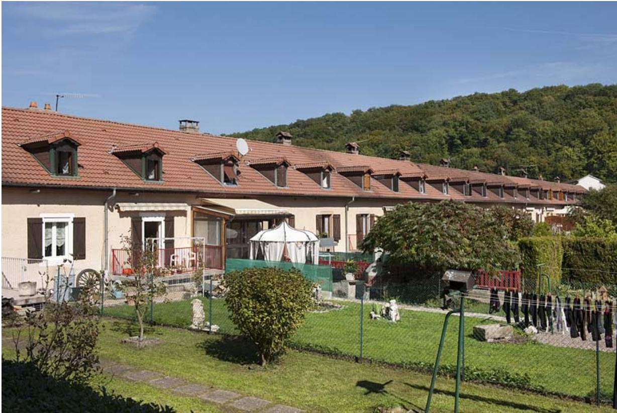
Caserne G. Façade postérieure depuis le sud-ouest.