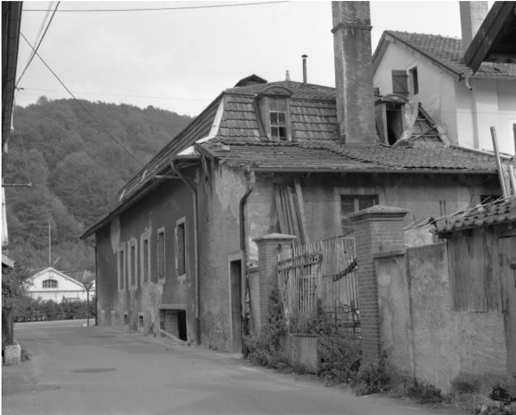
Magasin coopératif la Fraternelle en 1981.