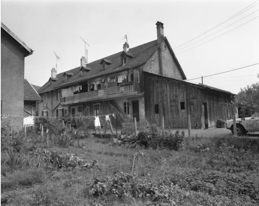
Caserne (15 logements) 4 rue de la Promenade vue depuis le nord en 1981, aujourd'hui détruite. 25, Hérimoncourt rue Adèle Prud'hon