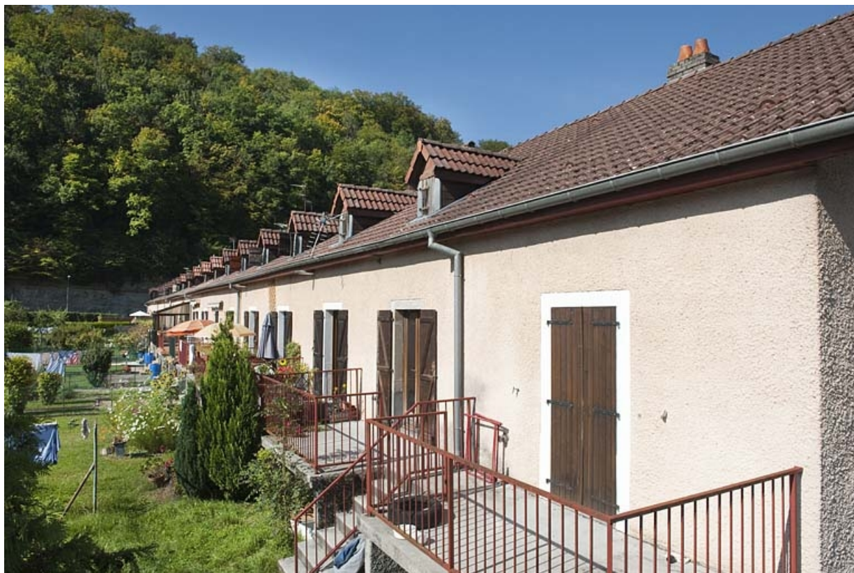
Caserne F. Vue rapprochée de la façade postérieure.