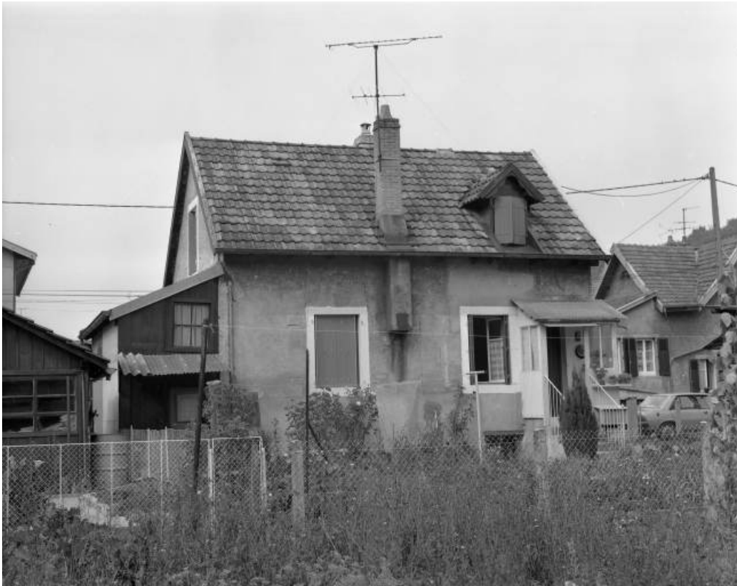
Maison individuelle 5 rue du Cercle en 1981.