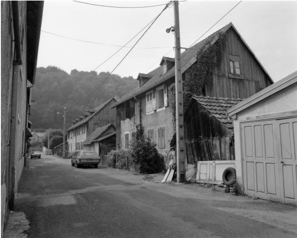
Logements ouvriers rue du Préau en 1981, aujourd'hui détruits.