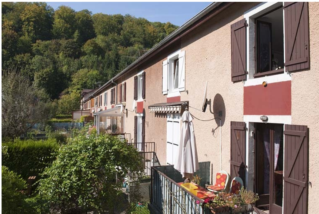
Caserne K. Façade postérieure.