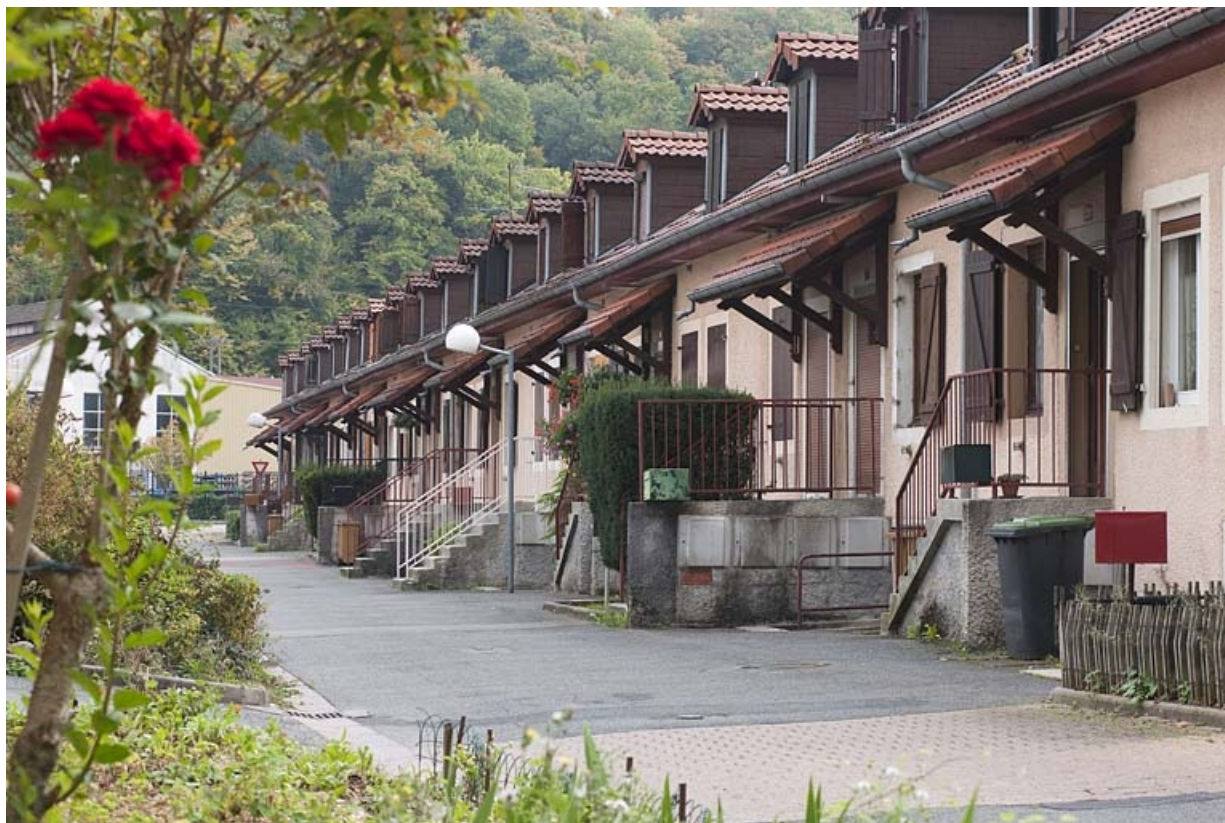
Caserne G. Vue d'ensemble depuis l'ouest. 25, Hérimoncourt rue Adèle Prud'hon