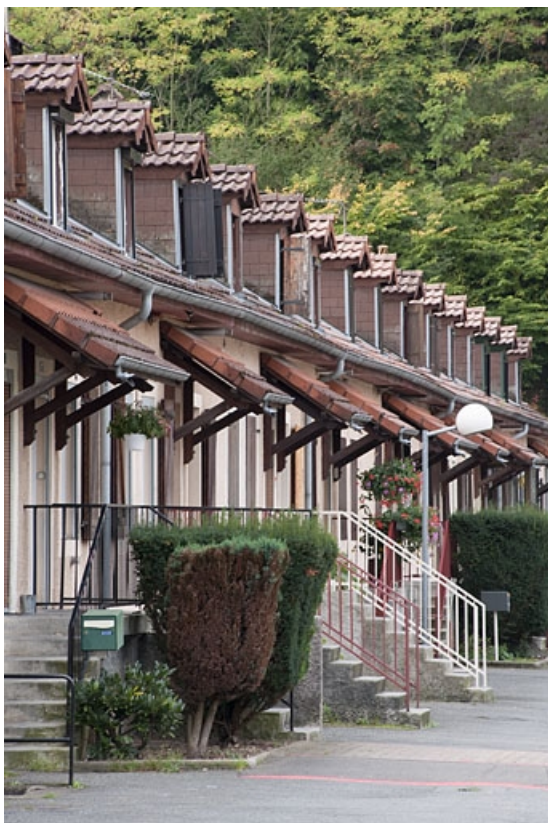
Caserne G. Vue rapprochée depuis l'est. 25, Hérimoncourt rue Adèle Prud'hon