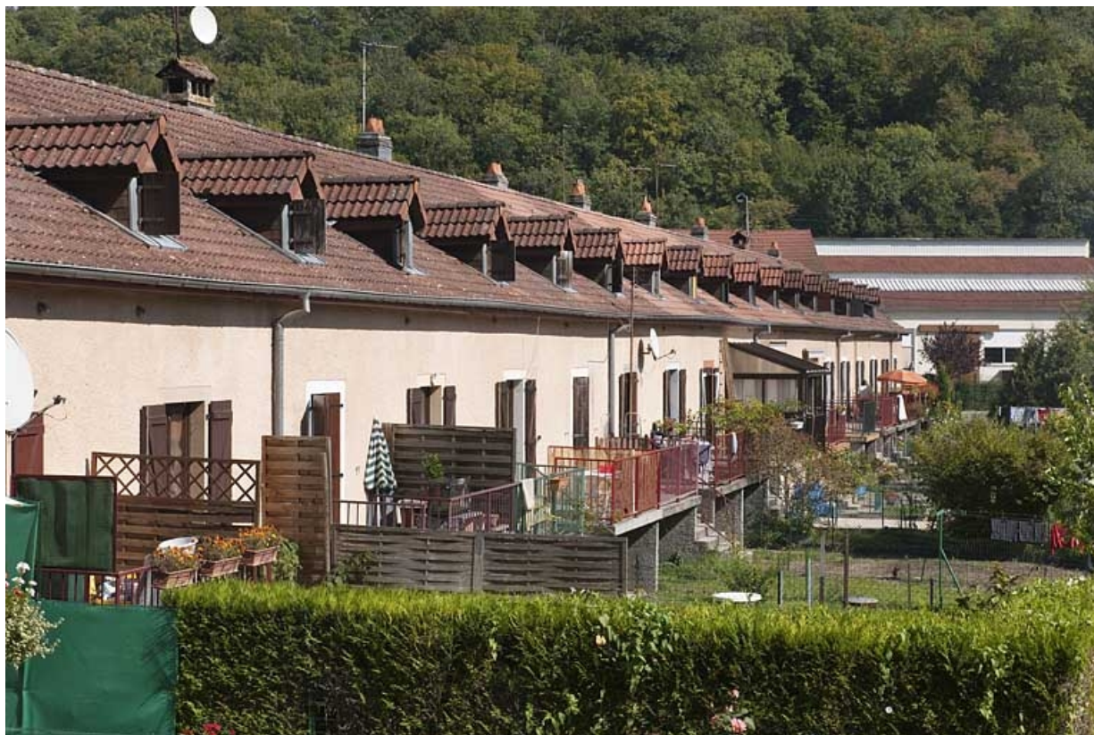
Caserne F. Façade postérieure vue depuis le sud-ouest.