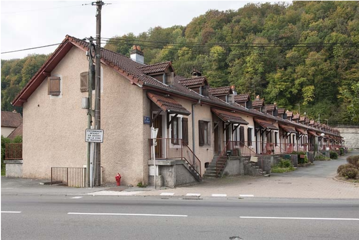
Caserne F. Vue depuis la route départementale.