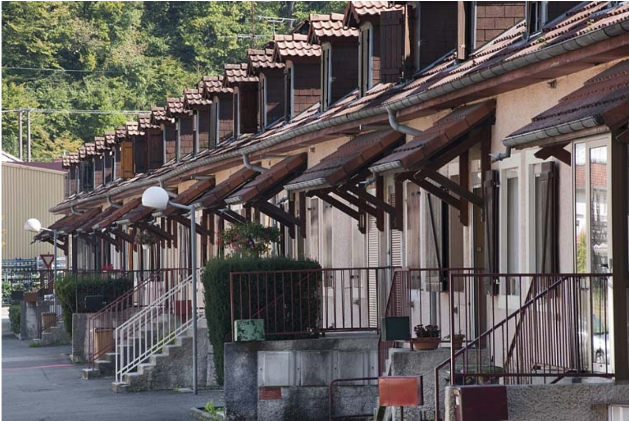
Caserne G. Façade antérieure vue de trois quarts.