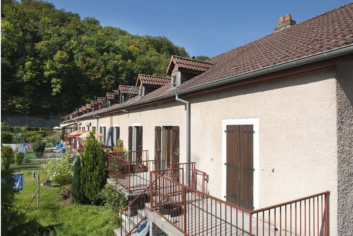
Caserne F. Vue rapprochée de la façade postérieure.