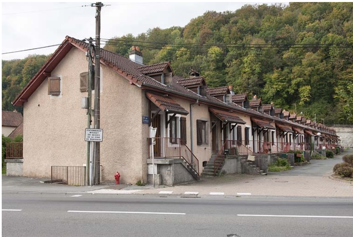
Caserne F. Vue depuis la route départementale. 25, Hérimoncourt rue Adèle Prud'hon