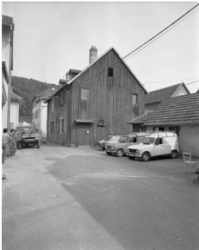
Logement ouvrier depuis la rue du Préau en 1981, aujourd'hui détruite. 25, Hérimoncourt rue Adèle Prud'hon