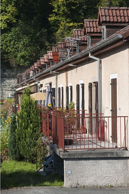
Caserne F. Façade postérieure vue de trois quarts. 25, Hérimoncourt rue Adèle Prud'hon