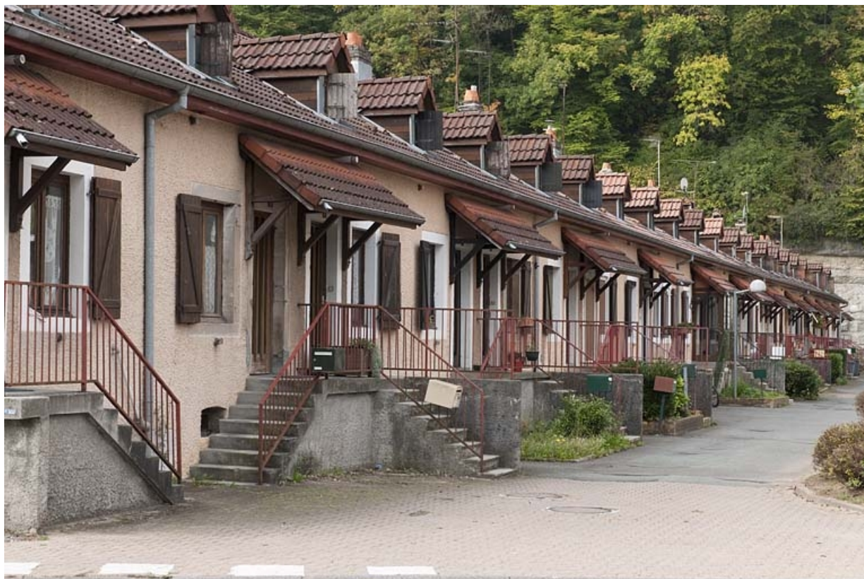
Caserne F. Façade antérieure vue de trois quarts.