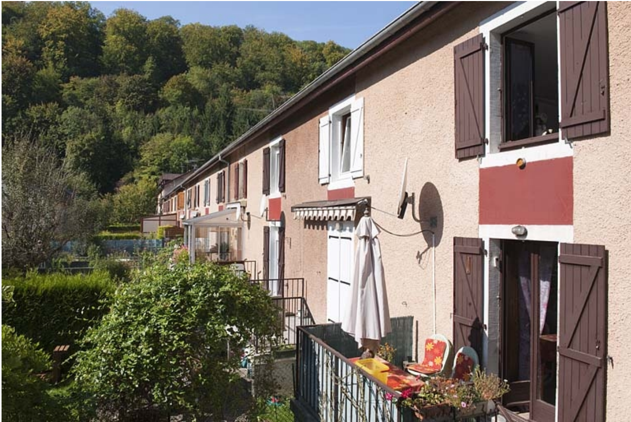
Caserne K. Façade postérieure.