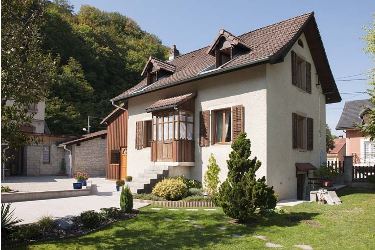
Maison individuelle rue du Cercle. Vue de trois quarts arrière.