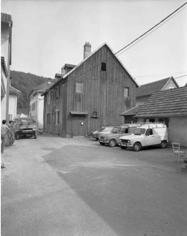
Logement ouvrier depuis la rue du Préau en 1981, aujourd'hui détruite. 25, Hérimoncourt rue Adèle Prud'hon