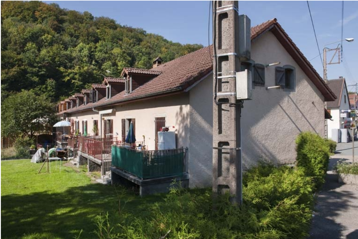
Caserne G. Façade postérieure vue depuis l'est. 25, Hérimoncourt rue Adèle Prud'hon