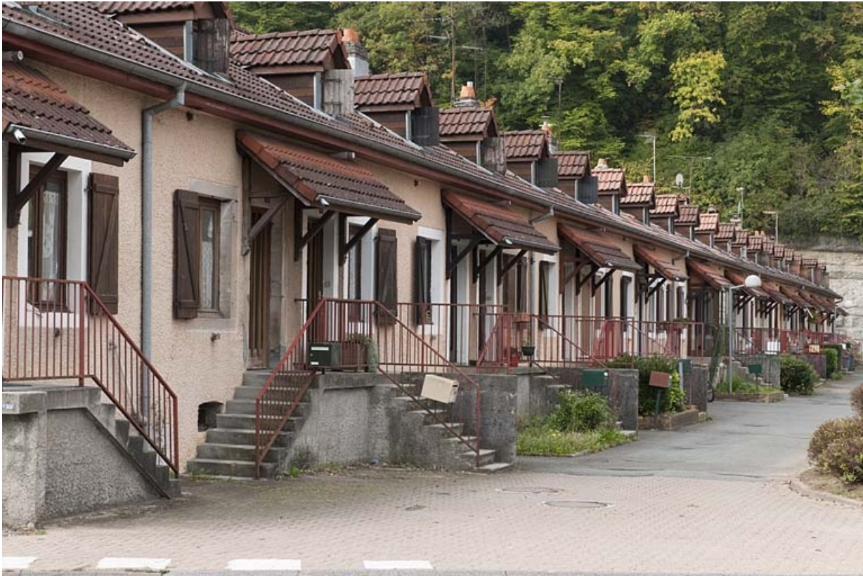
Caserne F. Façade antérieure vue de trois quarts.