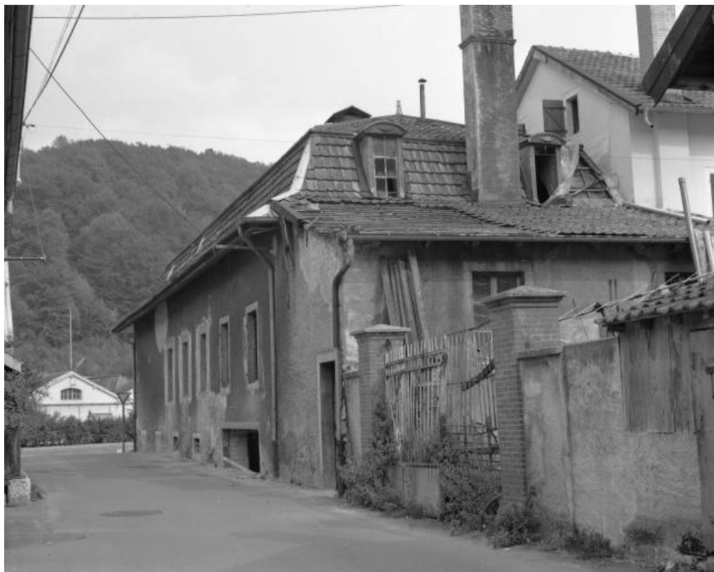
Magasin coopératif la Fraternelle en 1981. 25, Hérimoncourt rue Adèle Prud'hon