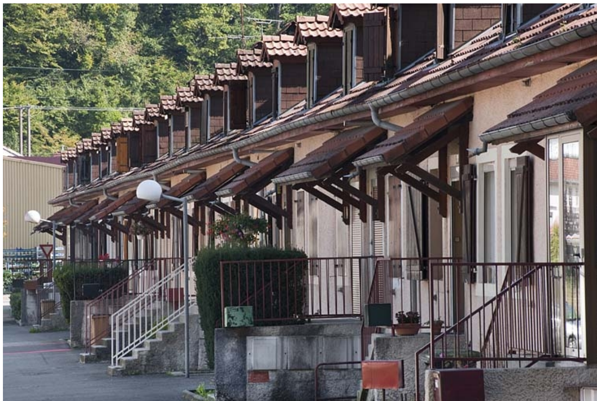
Case G. Façade antérieure vue de trois quarts.