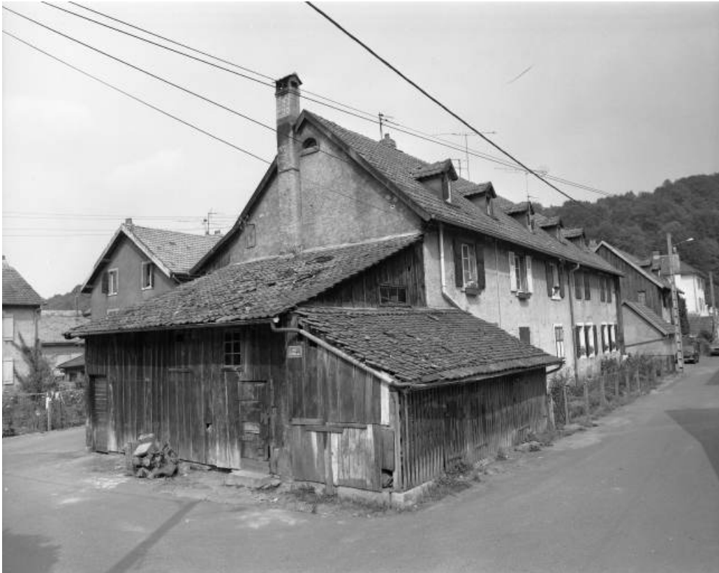
Caserne (15 logements) 4 rue de la Promenade en 1981, aujourd'hui détruite. 25, Hérimoncourt rue Adèle Prud'hon