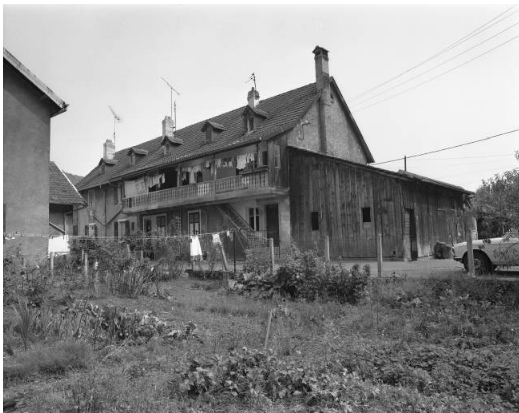
Caserne (15 logements) 4 rue de la Promenade vue depuis le nord en 1981, aujourd'hui détruite. 25, Hérimoncourt rue Adèle Prud'hon