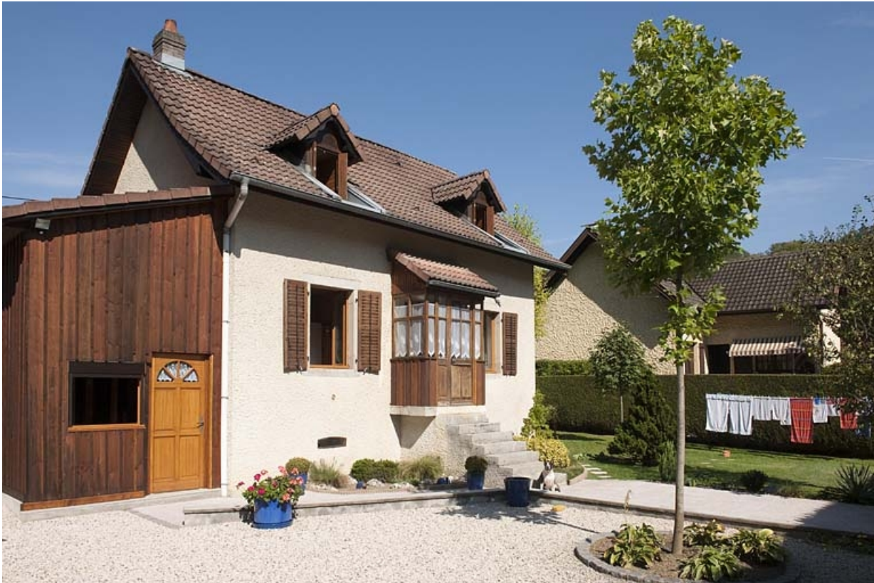
Maison individuelle rue du Cercle. Vue de trois quarts arrière.