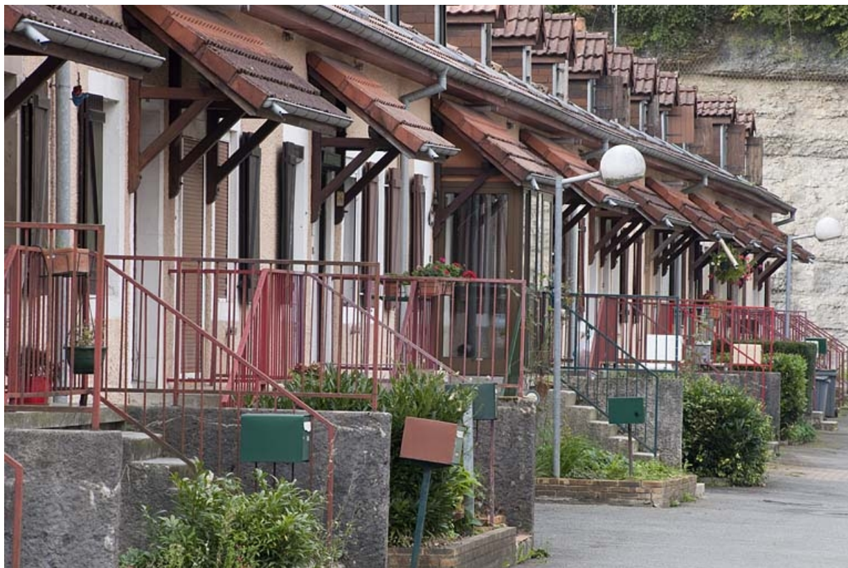
Caserne F. Vue rapprochée de la façade antérieure depuis le nord-est. 25, Hérimoncourt rue Adèle Prud'hon