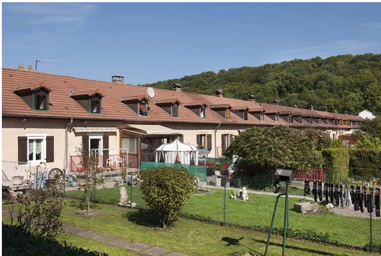
Caserne G. Façade postérieure depuis le sud-ouest. 25, Hérimoncourt rue Adèle Prud'hon