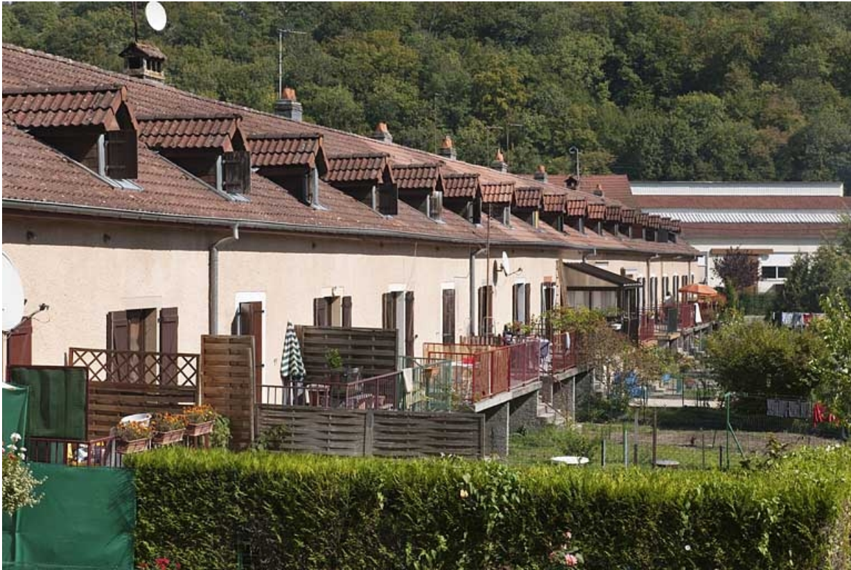
Caserne F. Façade postérieure vue depuis le sud-ouest.