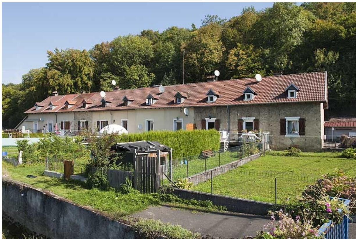
Logement nord (caserne A) depuis l'ouest.

25, Hérimoncourt, 4 à 25 chemin de Berne