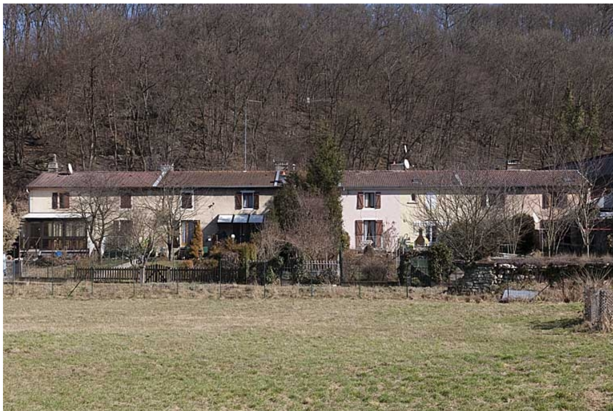
Logement sud (caserne B) depuis l'ouest. 25, Morteau, 2 rue du Docteur Léon Sauze