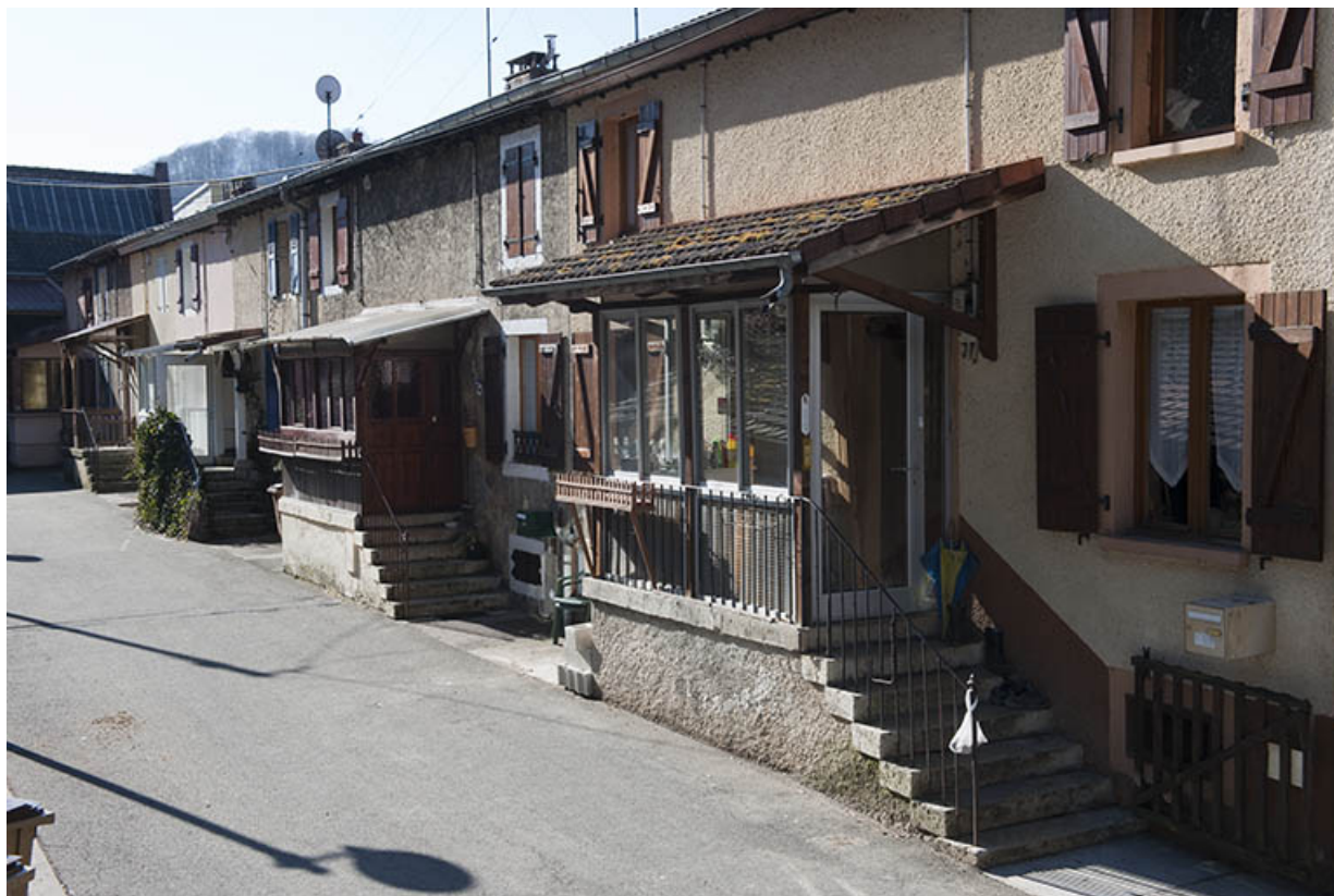
Logement sud (caserne B) vu de trois quarts.

25, Hérimoncourt, 4 à 25 chemin de Berne