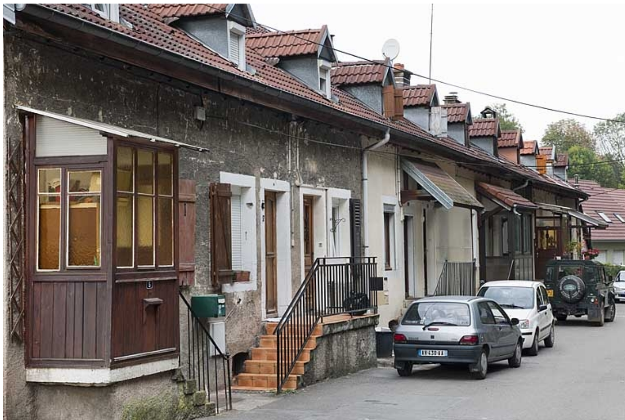
Façade est du logement sud (caserne B). 25, Hérimoncourt, 4 à 25 chemin de Berne