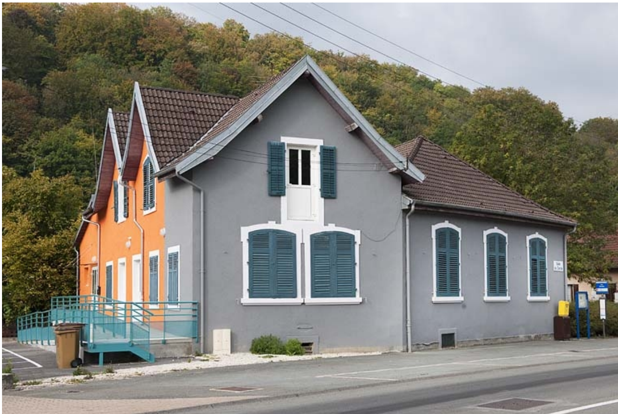
Vue depuis la rue.