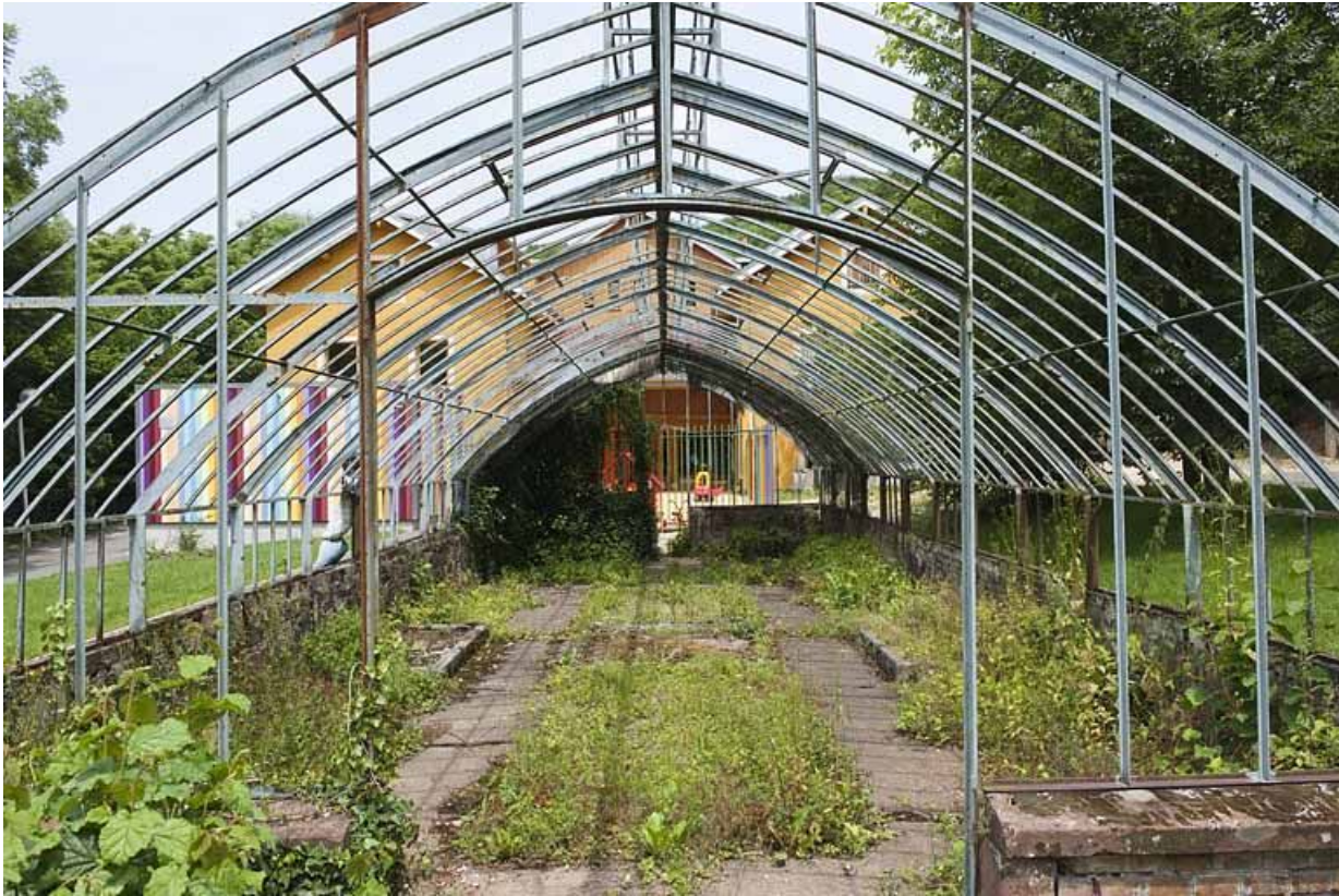
La serre. Vue rapprochée.

25, Hérimoncourt, lieudit : sur la Fontenottes