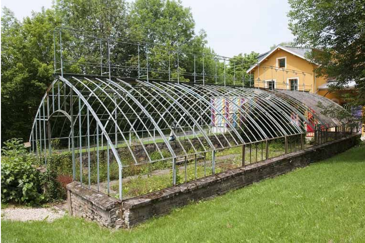
Serre et communs depuis le sud-est.