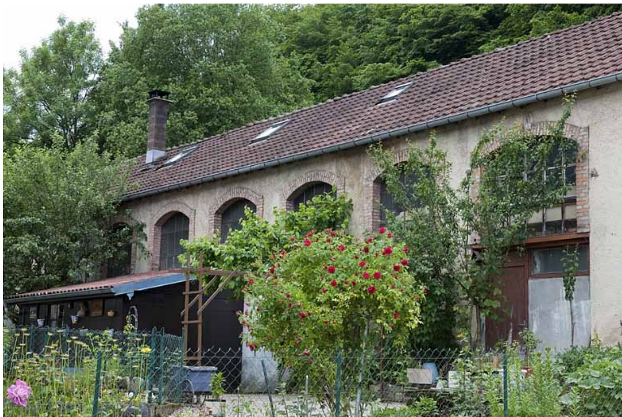
Façade est de l'atelier.