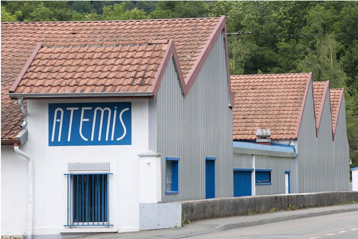
Pignons des sheds sur la route.