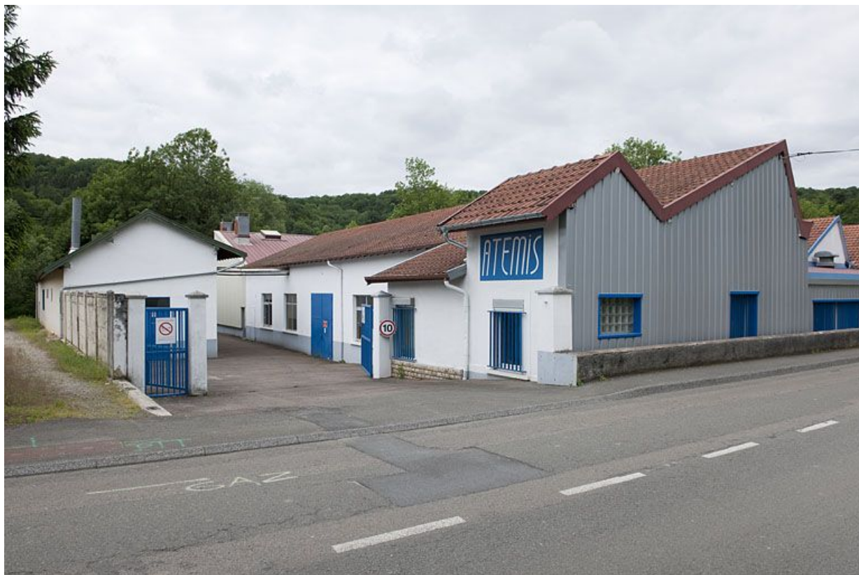
Bureau et atelier depuis le sud-est.