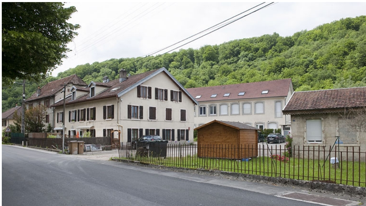
Vue d'ensemble depuis l'est.