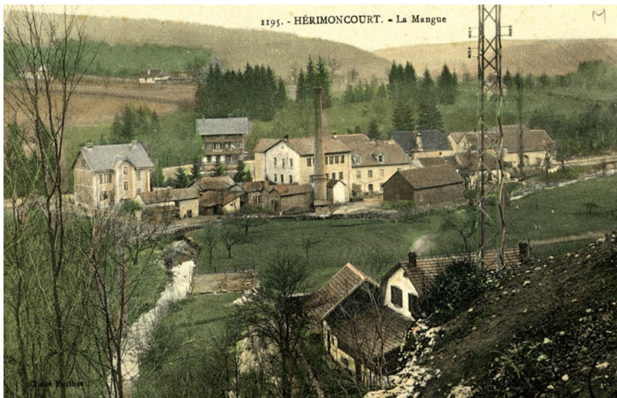
Hérimoncourt - La Manguette.

25, Hérimoncourt, 16, 18 rue du 9ème Zouaves