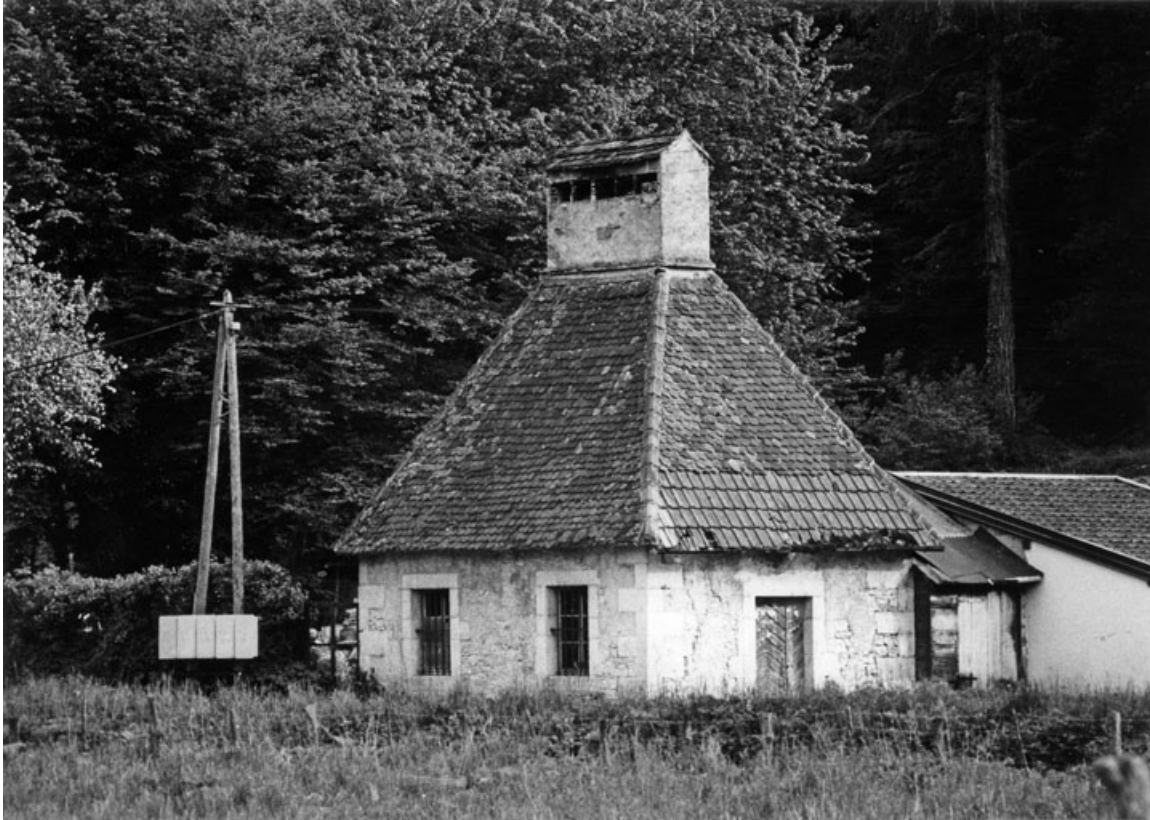
Séchoir-buanderie en 1979.