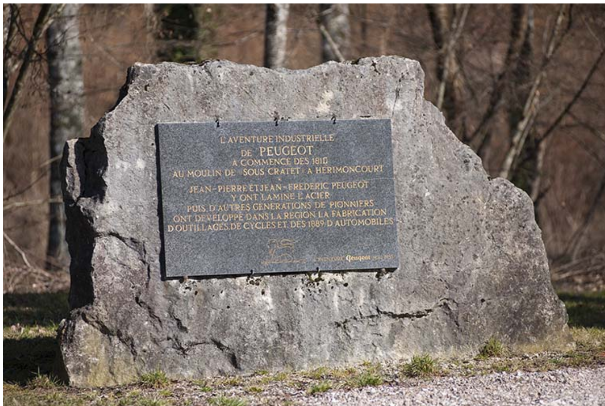
Etang de la Chapotte. Plaque commémorative Peugeot.