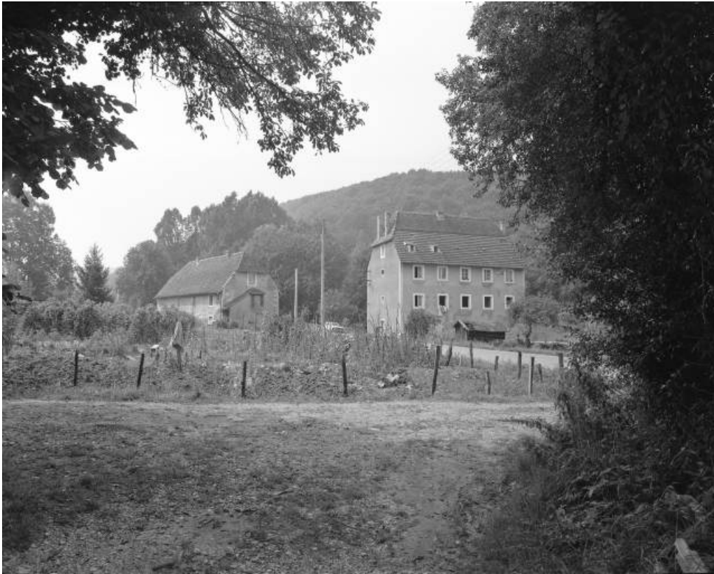
Logements ouvriers au sud en 1981.