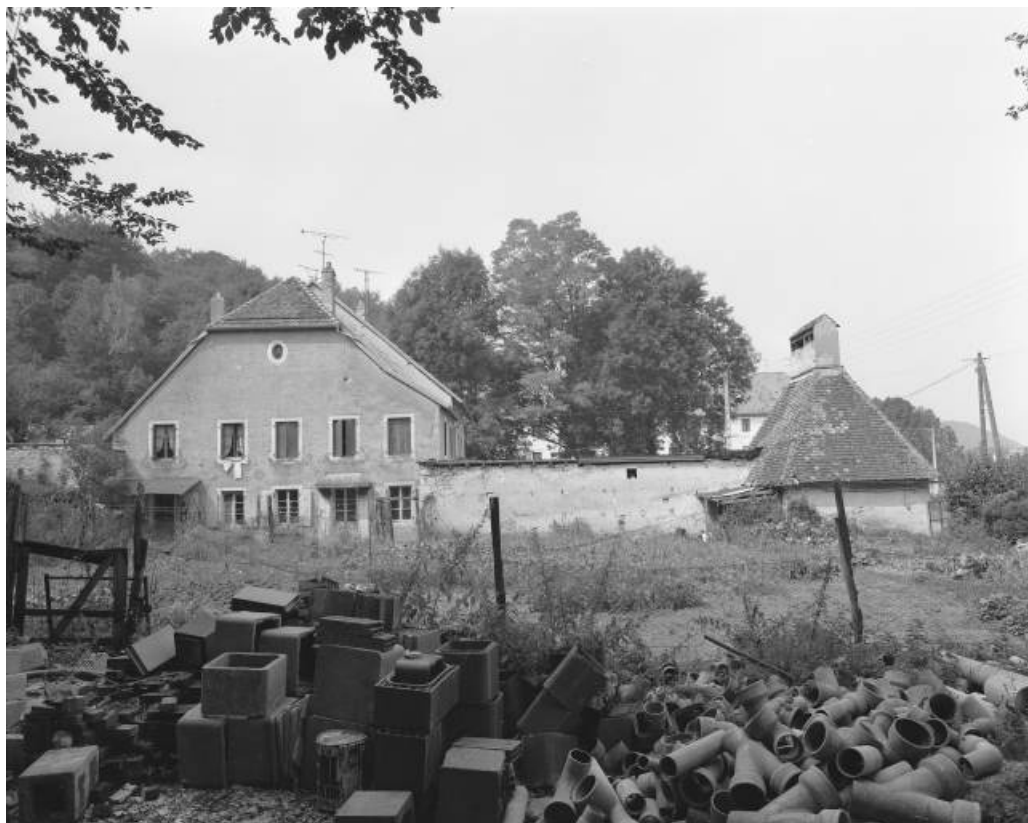
Logement, bureau et séchoir-buanderie depuis le sud en 1981.