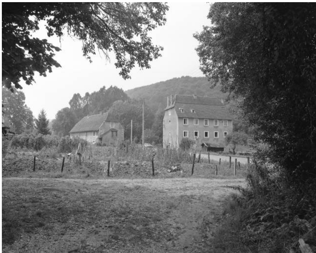
Logements ouvriers au sud en 1981.