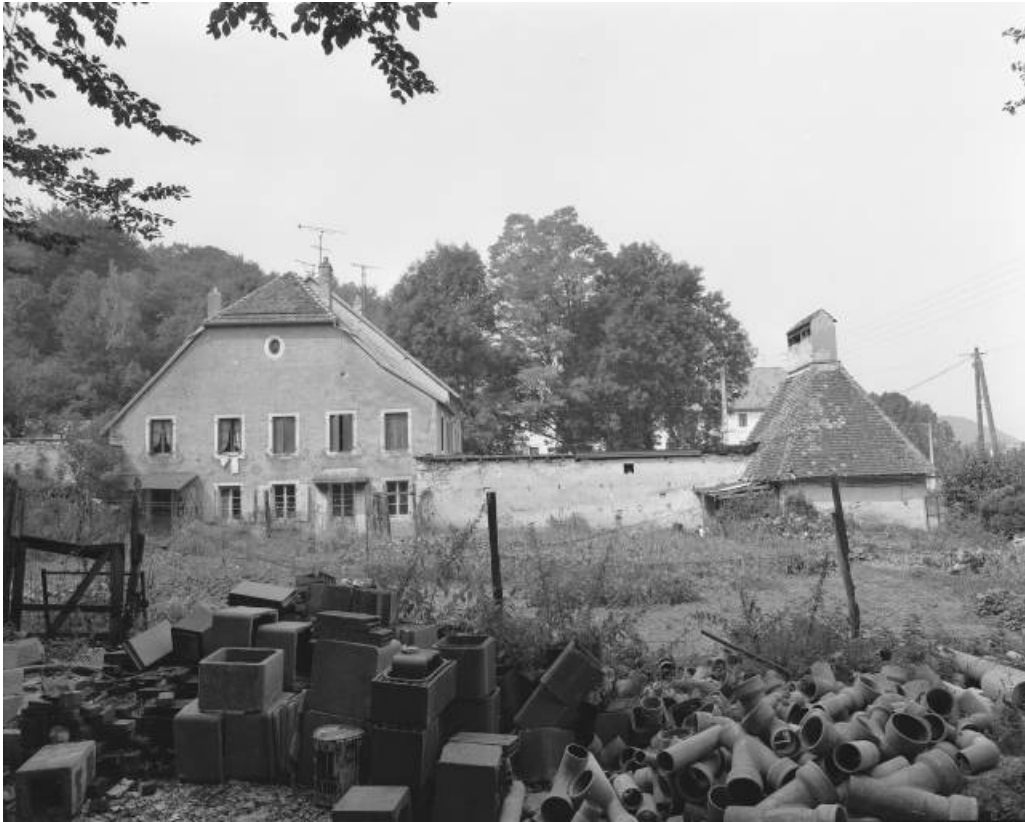
Logement, bureau et séchoir-buanderie depuis le sud en 1981.