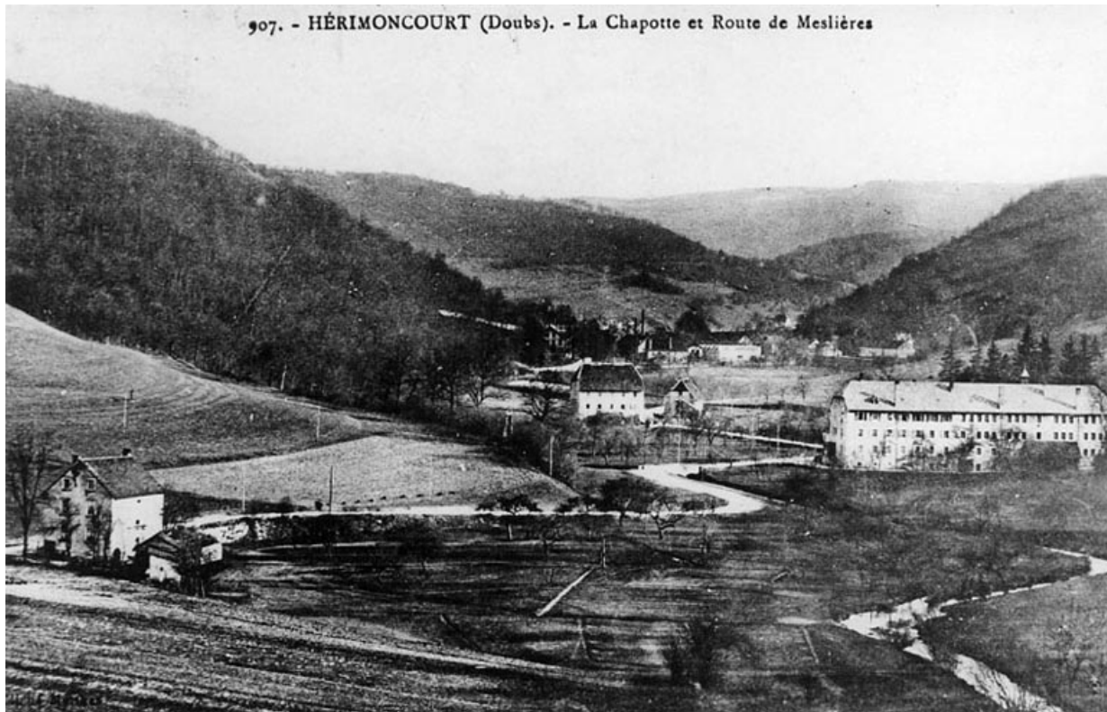
Hérimoncourt (Doubs). - La Chapotte et route de Meslières. 25, Hérimoncourt, lieudit : la Chapotte