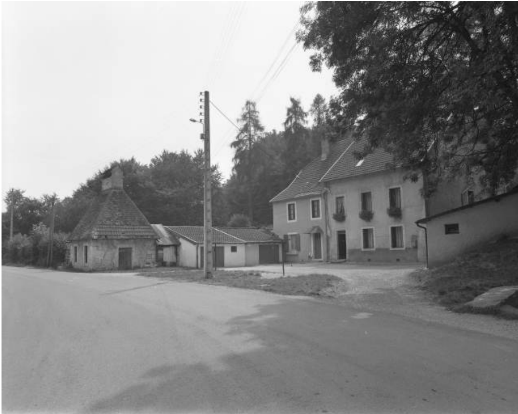
Séchoir-buanderie, logement et bureau vus de trois quarts en 1981.