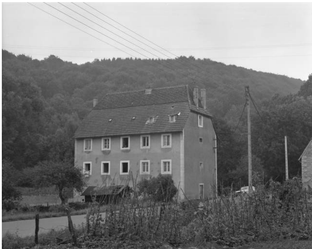
Logement ouvrier vu de trois quarts en 1981.