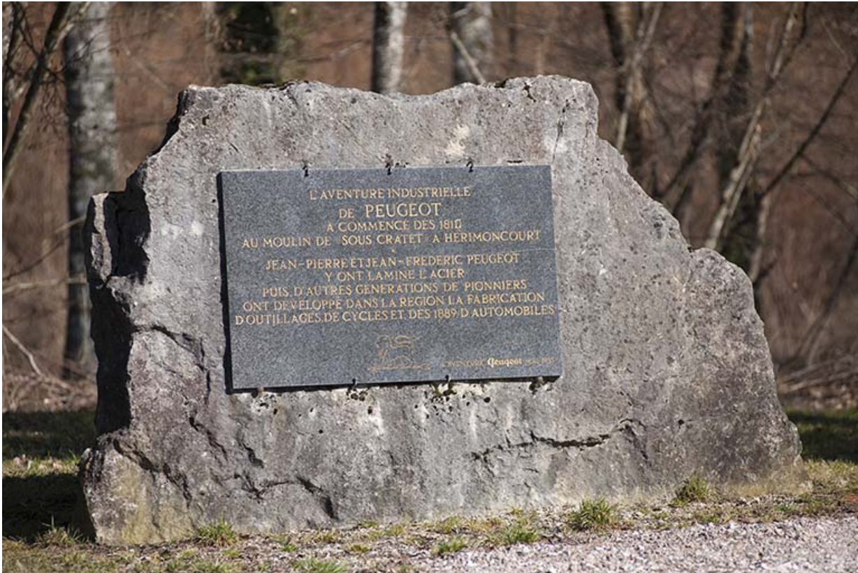
Etang de la Chapotte. Plaque commémorative Peugeot.