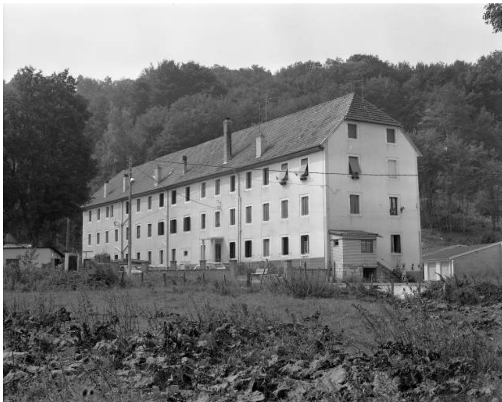
Vue d'ensemble depuis le sud-est en 1981.