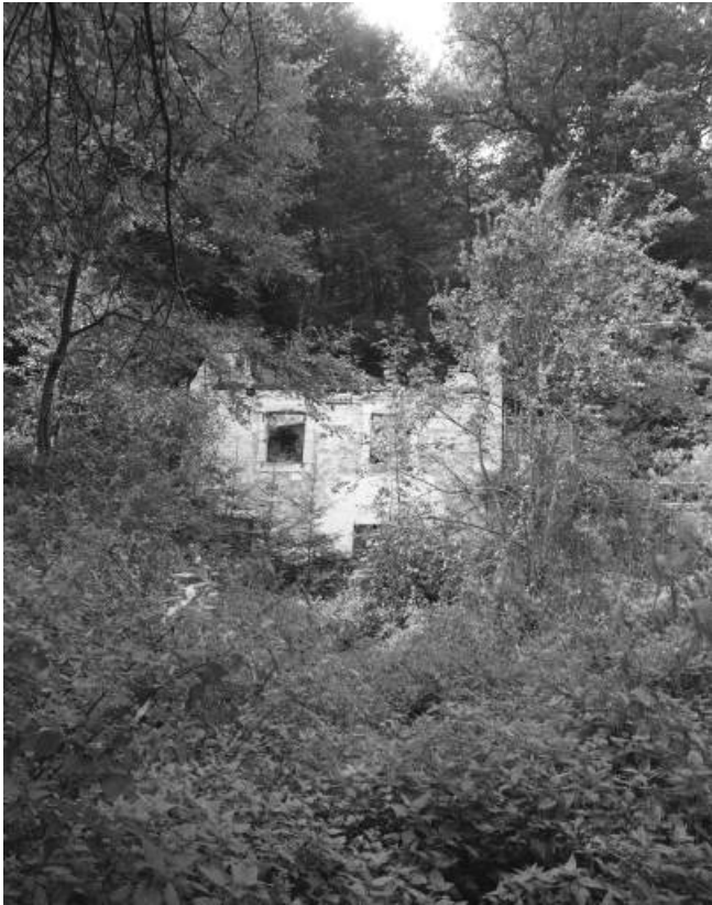
Vestiges de l'école en 1981.