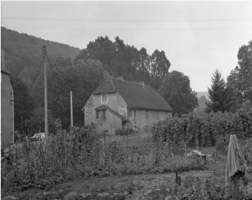
Logement ouvrier depuis le nord en 1981.