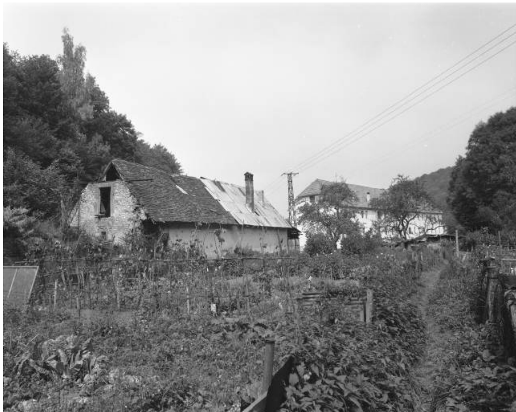
Magasin industriel situé derrière la filature en 1981.