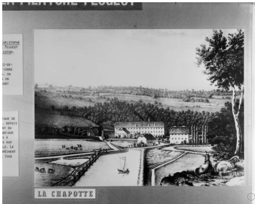
Vue cavalière de la filature de la Chapotte.