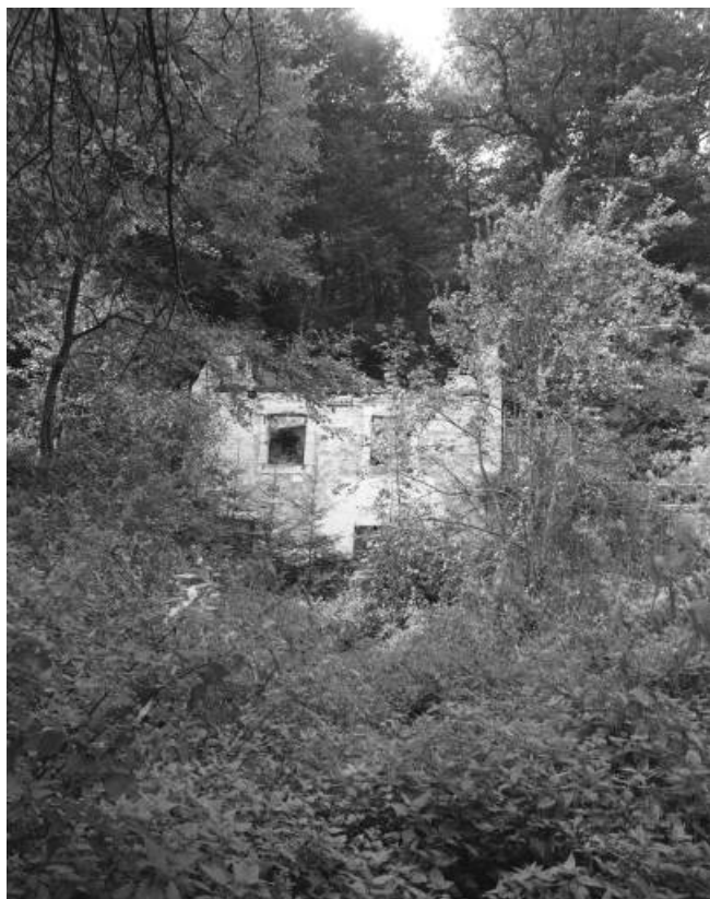
Vestiges de l'école en 1981.