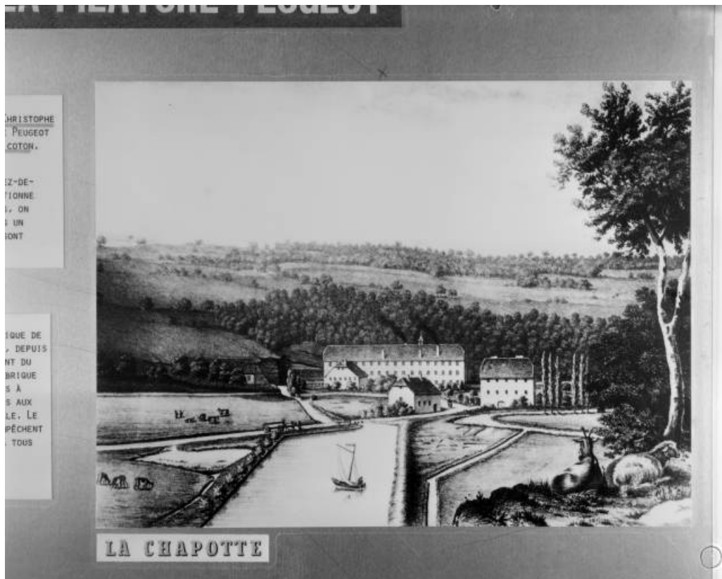
Vue cavalière de la filature de la Chapotte.