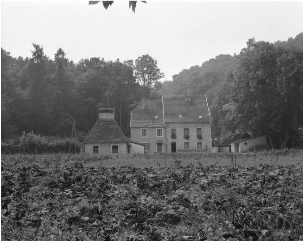
Séchoir-buanderie, logement et bureau en 1981.