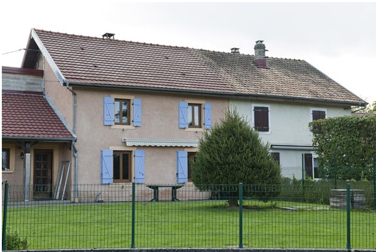
Habitation de 4 logements. Façade ouest.

25, Seloncourt, 12 à 37 rue des Casernes