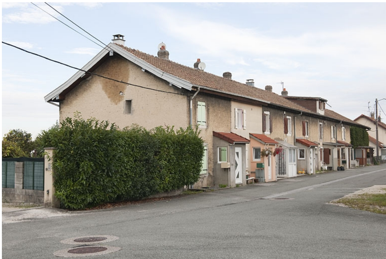
Habitation de 10 logements. Vue d'ensemble depuis le sud-est.

25, Seloncourt, 12 à 37 rue des Casernes