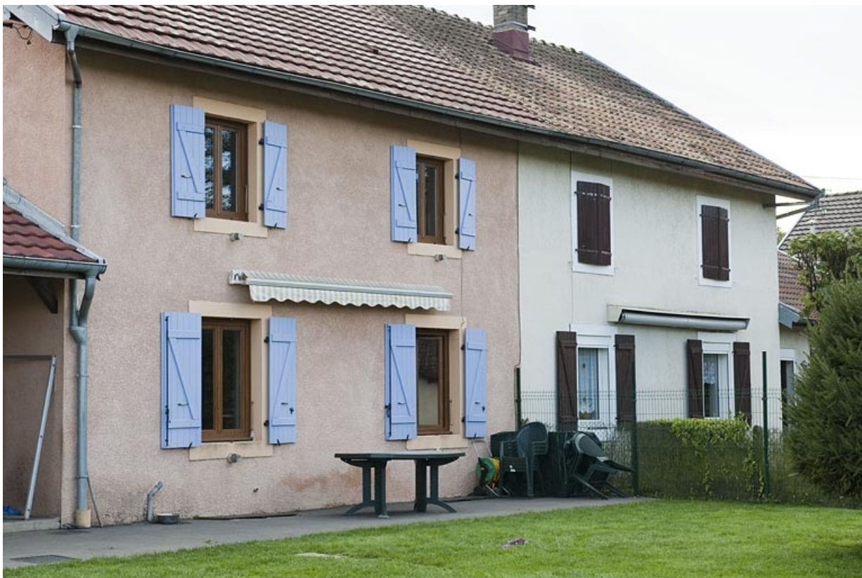
Habitation de 4 logements. Détail de la façade ouest.

25, Seloncourt, 12 à 37 rue des Casernes