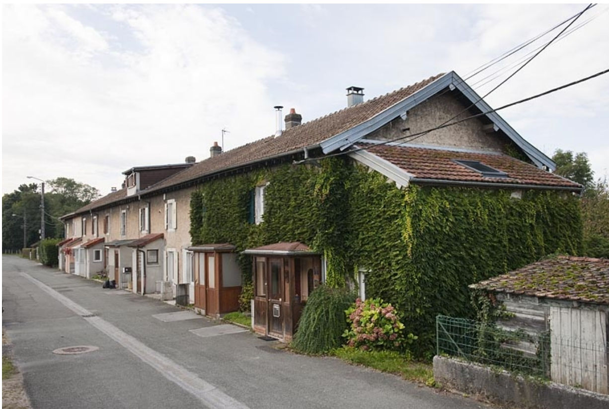
Habitation de 10 logements. Vue d'ensemble depuis le nord-est.

25, Seloncourt, 12 à 37 rue des Casernes