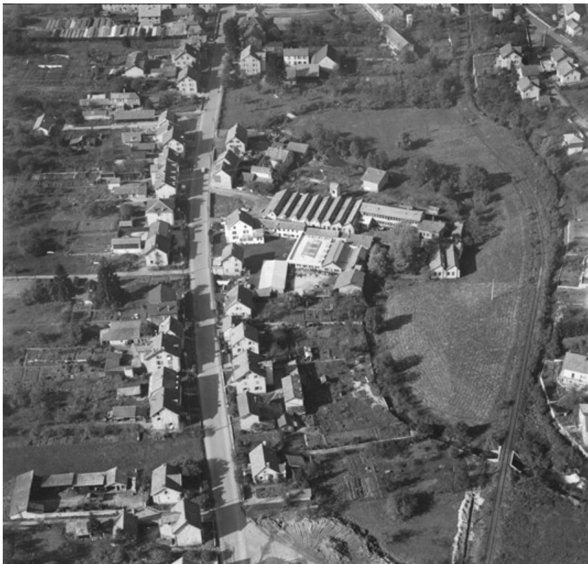
Vue aérienne depuis le sud-est.

25, Seloncourt, 28 rue du Général Leclerc