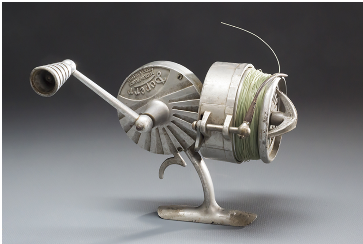
Moulinet de canne à pêche.

25, Seloncourt, 28 rue du Général Leclerc