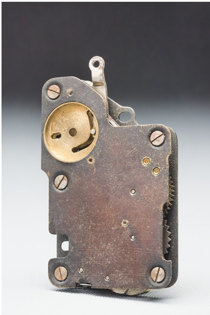
Retardateur pour appareil photographique.

25, Seloncourt, 28 rue du Général Leclerc