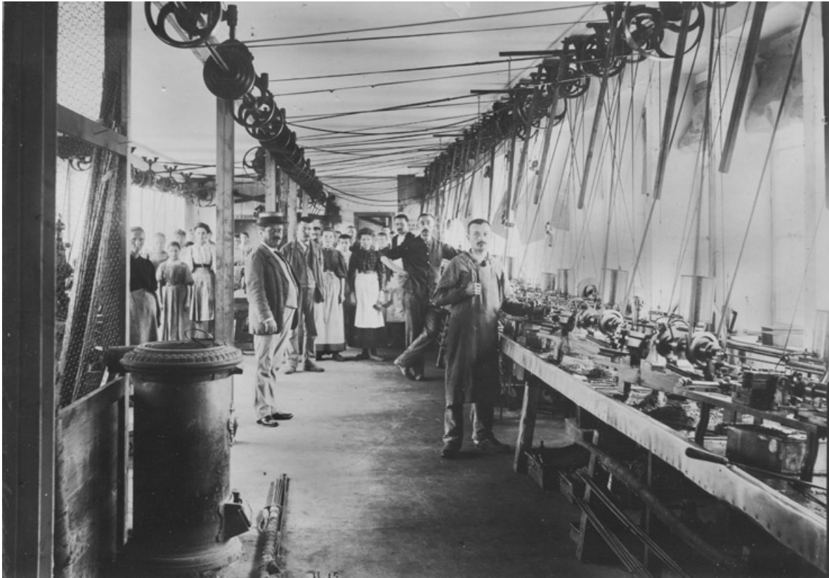
Personnel de la manufacture dans un atelier.

25, Seloncourt, 28 rue du Général Leclerc