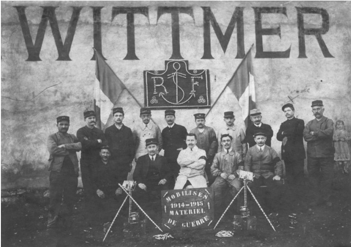
Personnel de l'usine. Mobilisés de guerre (1914-1915).

25, Seloncourt, 28 rue du Général Leclerc