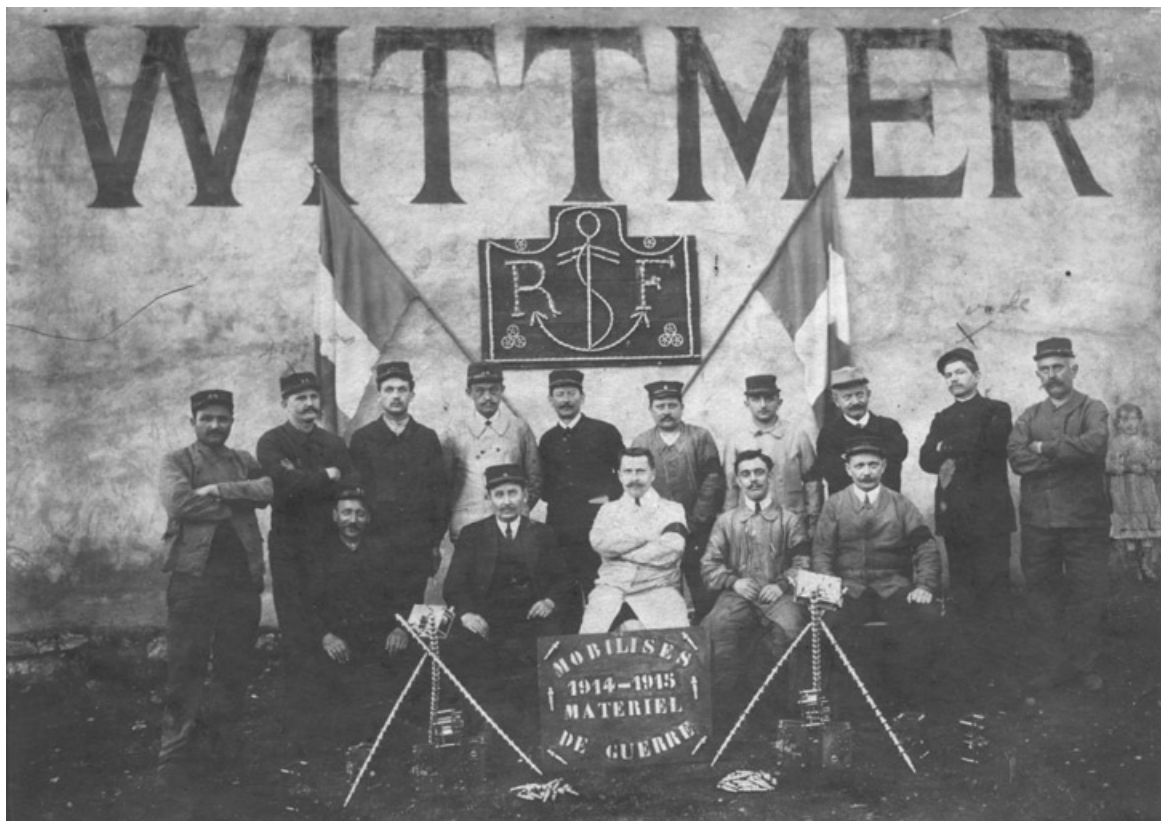
Personnel de l'usine. Mobilisés de guerre (1914-1915).

25, Seloncourt, 28 rue du Général Leclerc