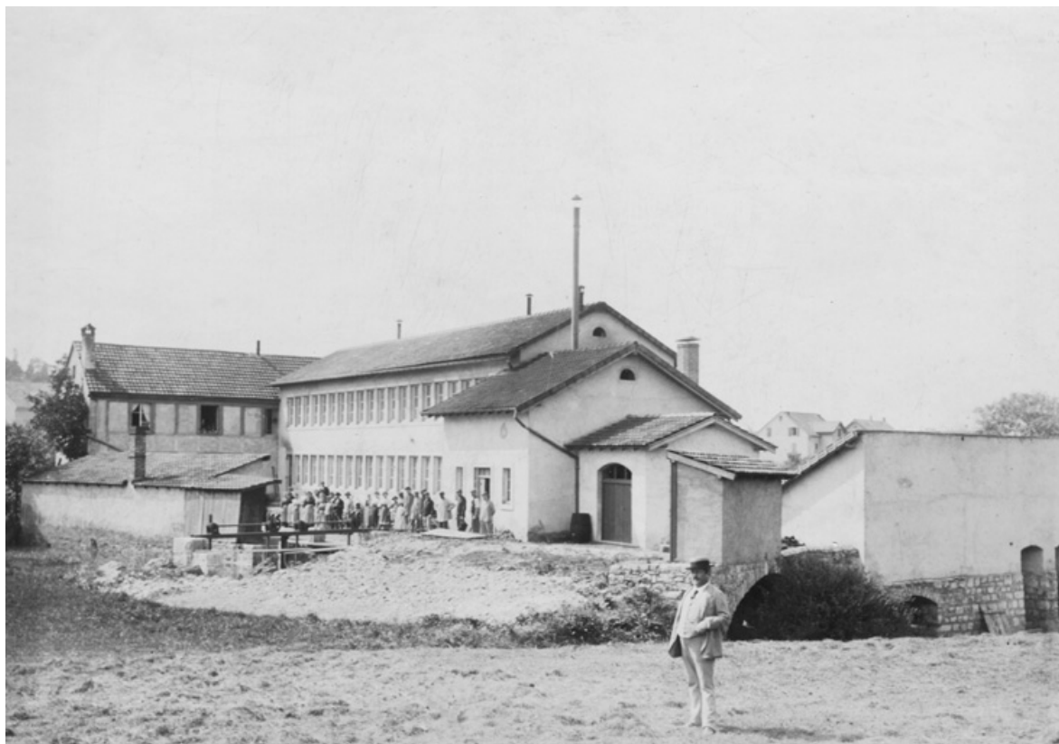
Vue d'ensemble de l'usine.