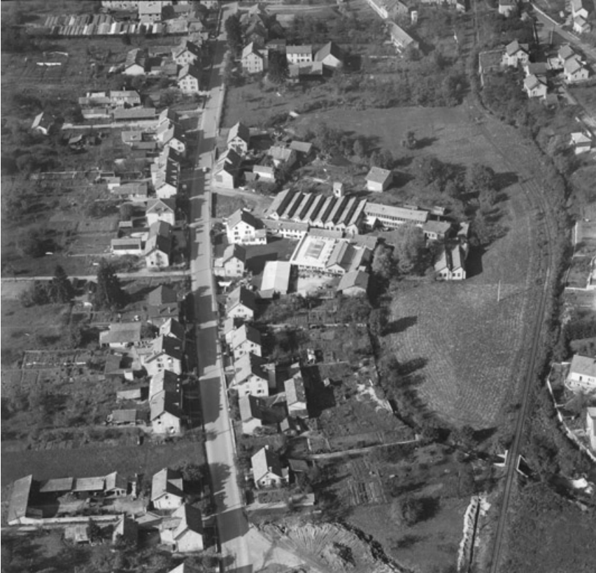
Vue aérienne depuis le sud-est.

25, Seloncourt, 28 rue du Général Leclerc