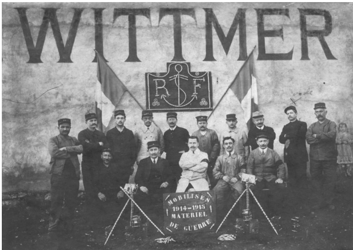
Personnel de l'usine. Mobilisés de guerre (1914-1915).

25, Seloncourt, 28 rue du Général Leclerc