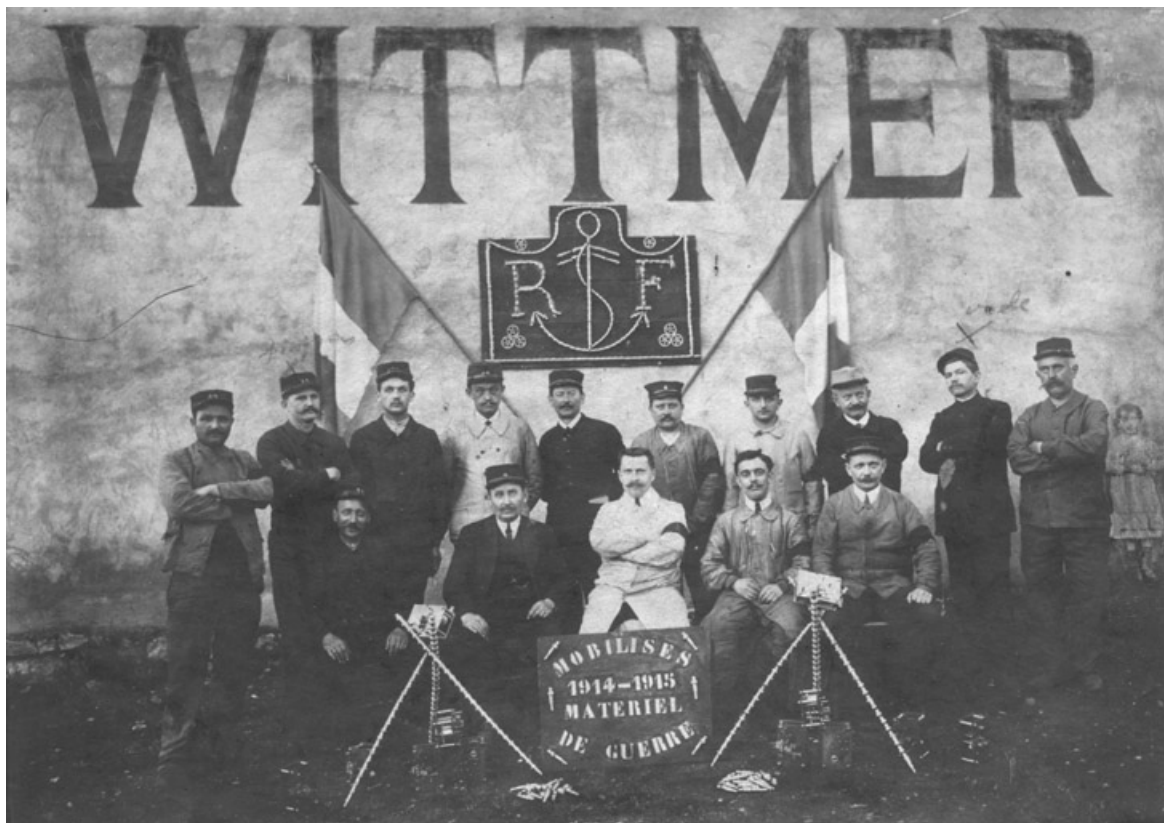
Personnel de l'usine. Mobilisés de guerre (1914-1915).

25, Seloncourt, 28 rue du Général Leclerc