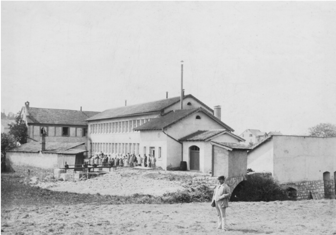
Vue d'ensemble de l'usine.