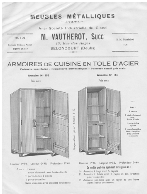
Meubles métalliques M. Vautherot. 25, Seloncourt, 14 rue des Combes

Document publicitaire, s.n., s.d. [milieu du 20e siècle]. Lieu de conservation : Association les Amis du vieux Seloncourt