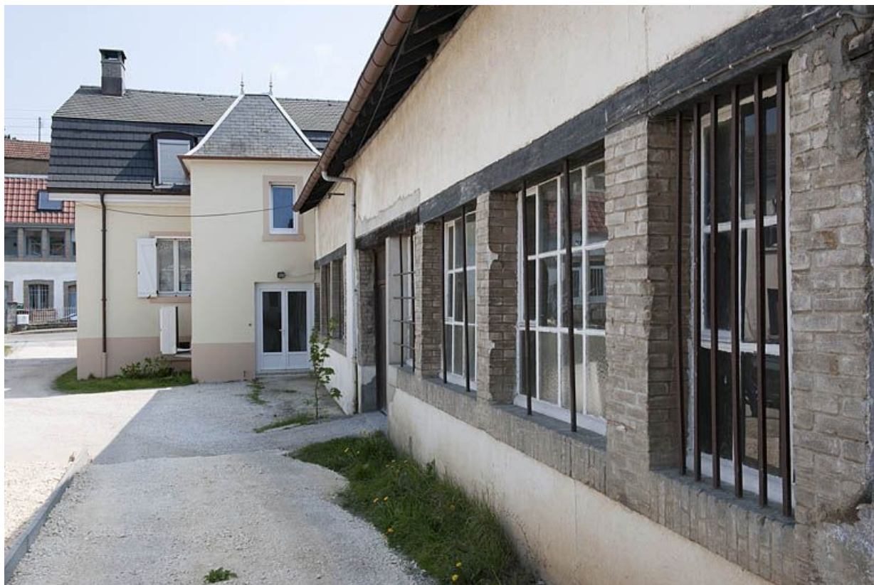
Logement et atelier de fabrication depuis l'ouest.