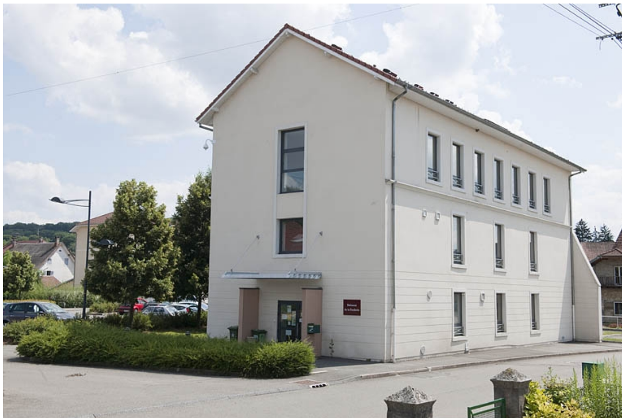
Bâtiment de bureaux. Vue depuis le nord. 25, Seloncourt rue de la Fonderie