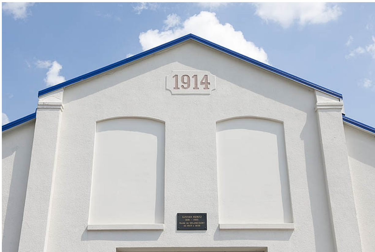
Détail du pignon de la halle (atelier de construction mécanique).