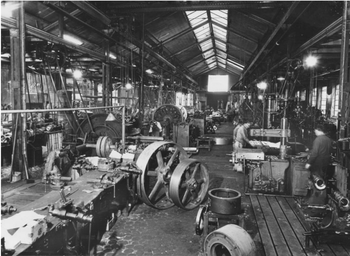
Vue intérieure d'un atelier de construction mécanique.