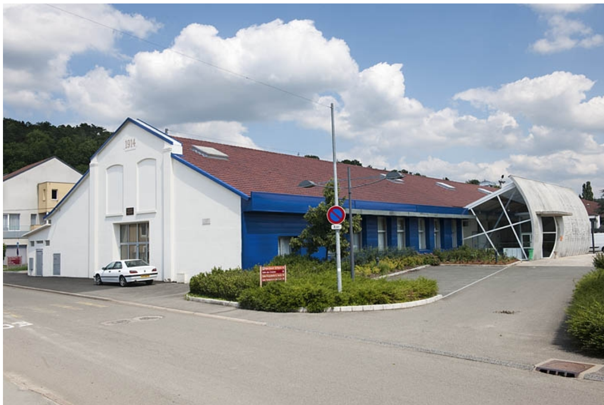
Halle (atelier de construction mécanique) vue de trois quarts.