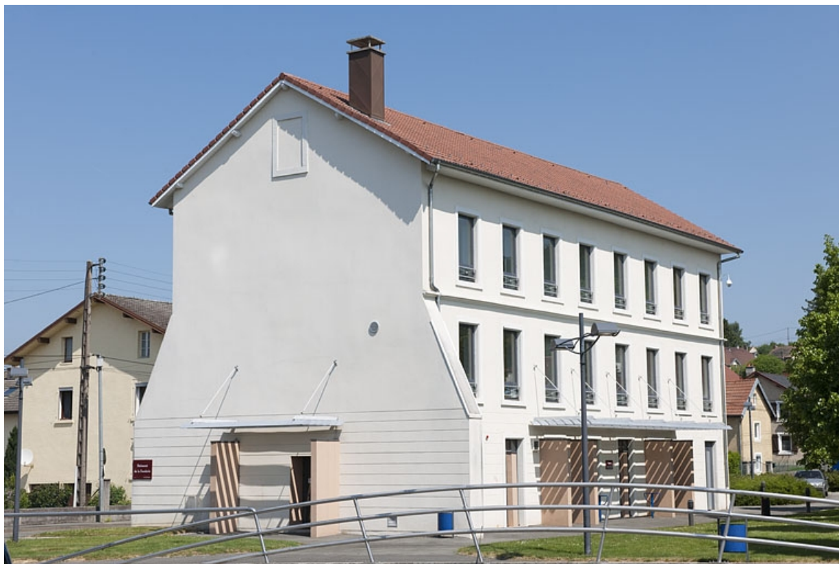
Bâtiment de bureaux. Vue trois quarts arrière.