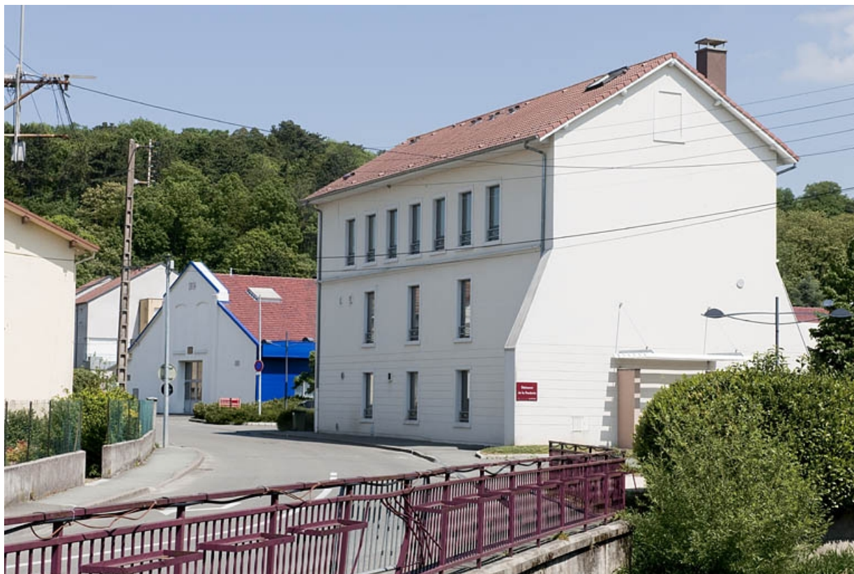
Bâtiment de bureaux. Vue depuis le pont. 25, Seloncourt rue de la Fonderie