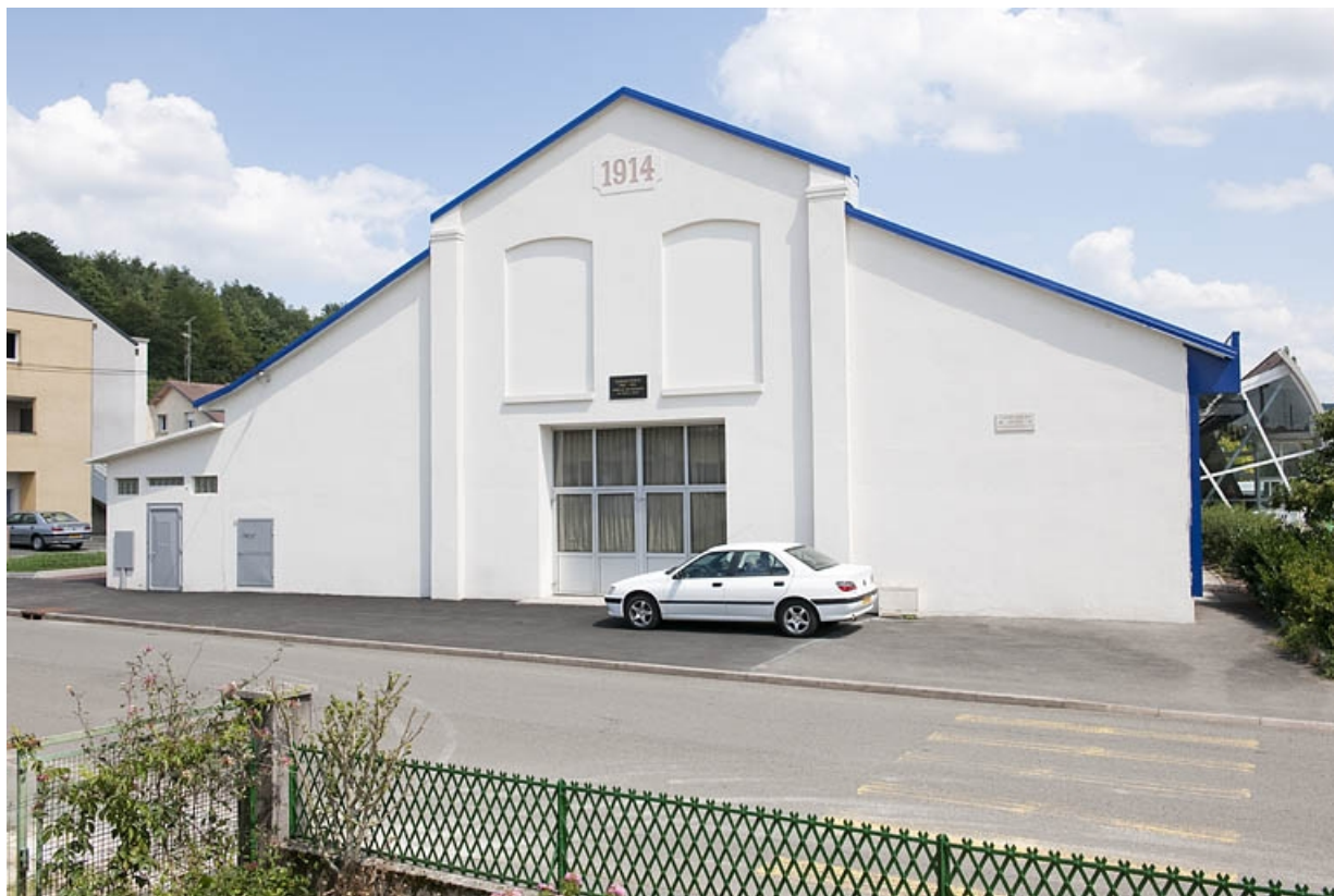
Mur pignon de la halle (atelier de construction mécanique).