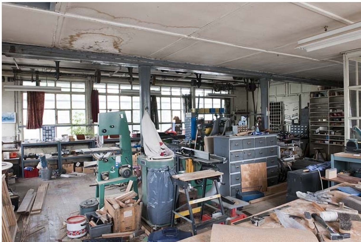
Vue intérieure de l'atelier.

25, Seloncourt, 74 rue du Général Leclerc