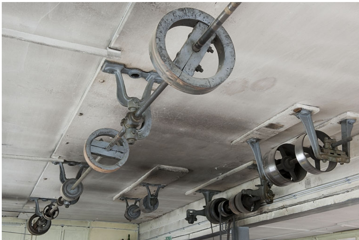
Intérieur de l'atelier. Système de transmissions.

25, Seloncourt, 74 rue du Général Leclerc