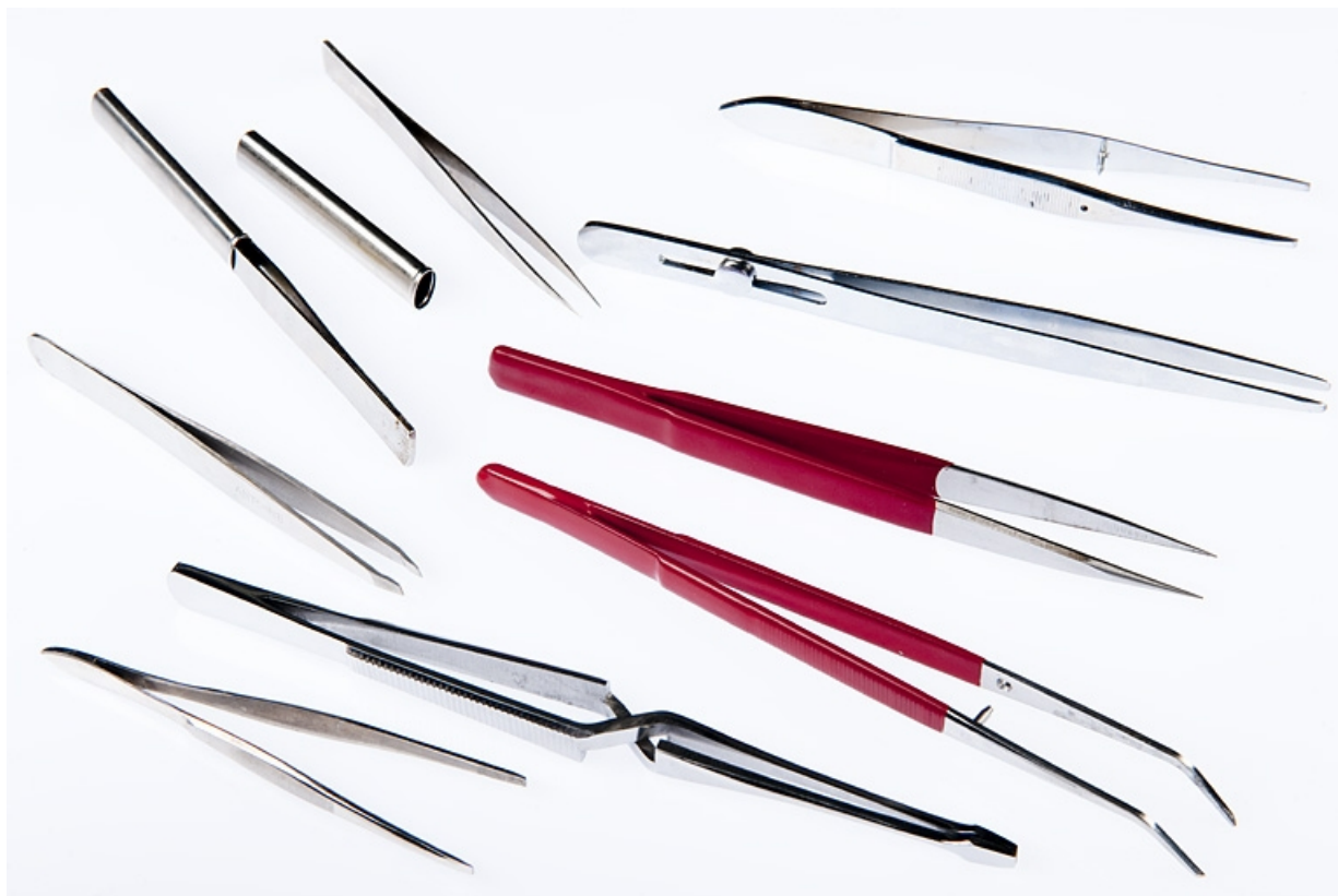
Echantillon de pinces et brucelles.