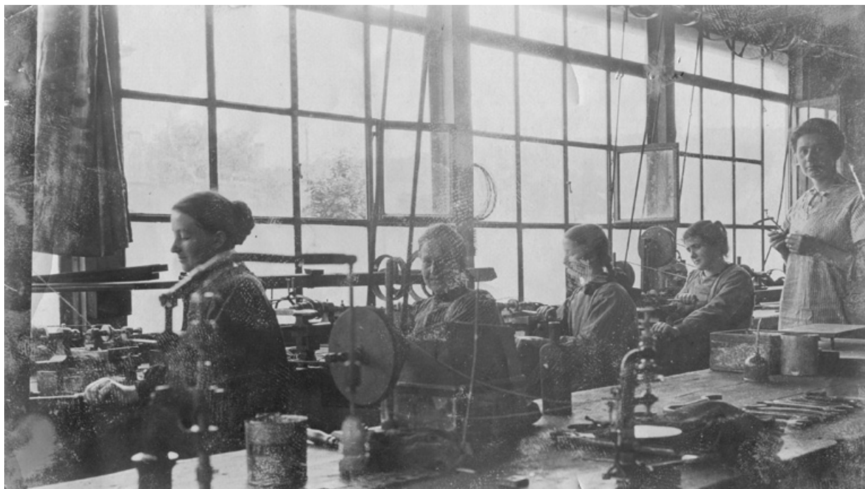
Vue intérieure de l'atelier.

25, Seloncourt, 74 rue du Général Leclerc