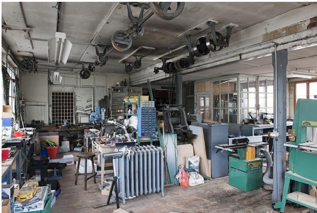
Vue intérieure de l'atelier.

25, Seloncourt, 74 rue du Général Leclerc