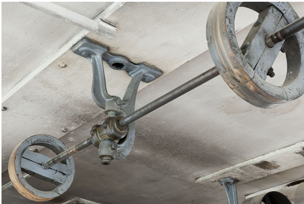
Intérieur de l'atelier. Transmission horizontale : console, axe et poulies.

25, Seloncourt, 74 rue du Général Leclerc