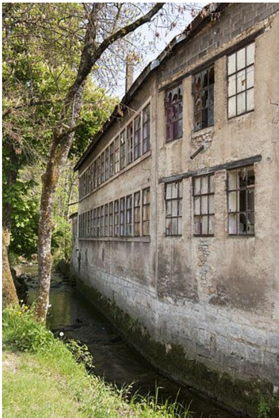
Façade postérieure vue de trois quarts.

25, Seloncourt, 60 et 64 rue du Général Leclerc