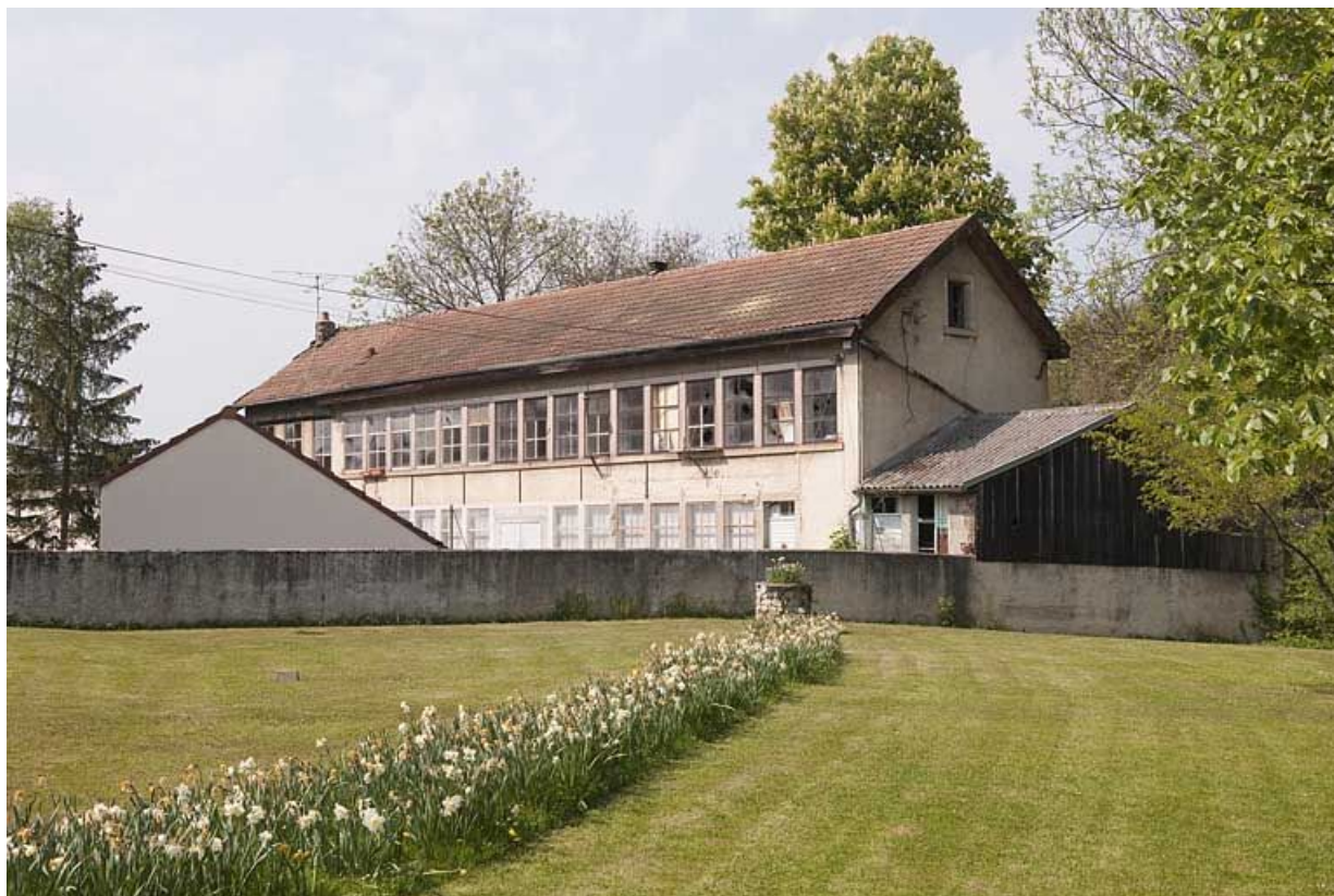
Vue de l'atelier de fabrication depuis le sud.

25, Seloncourt, 60 et 64 rue du Général Leclerc