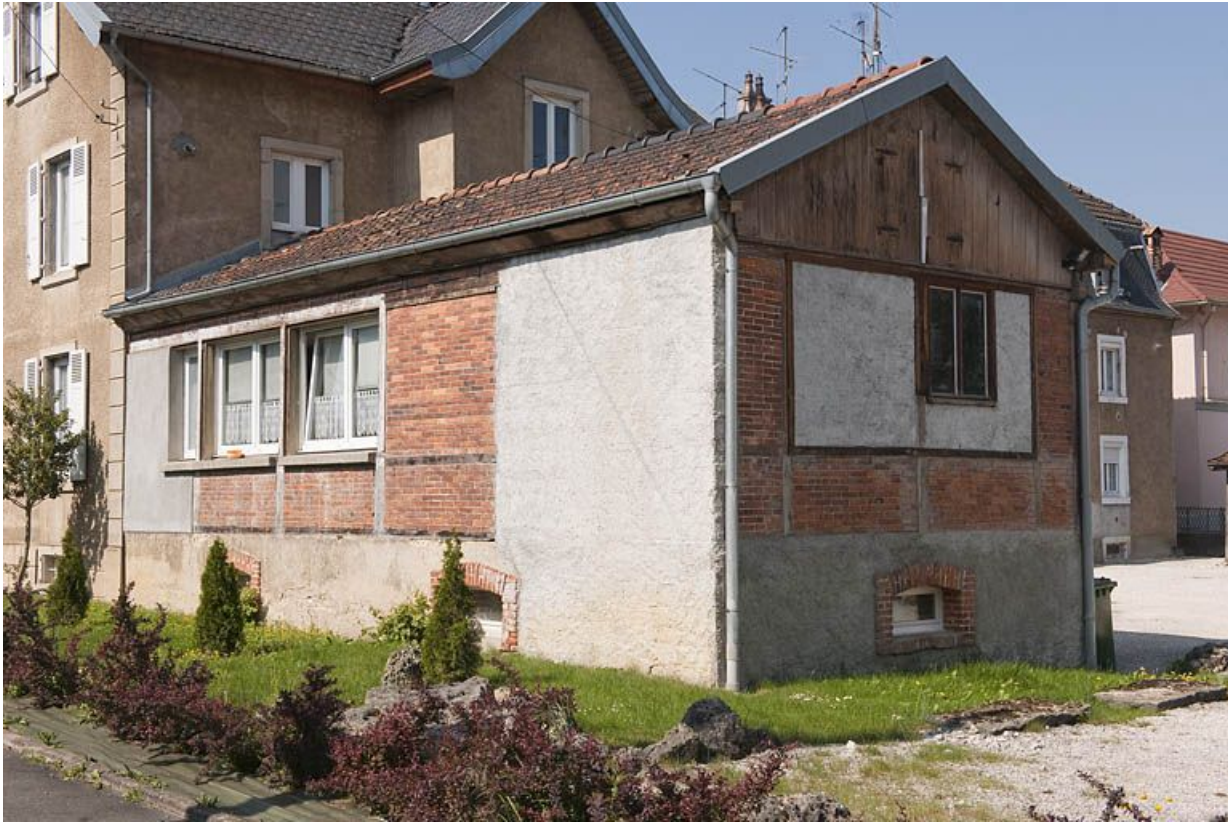
Atelier d'horlogerie adossé à la façade postérieure du logement patronal.

25, Seloncourt, 60 et 64 rue du Général Leclerc