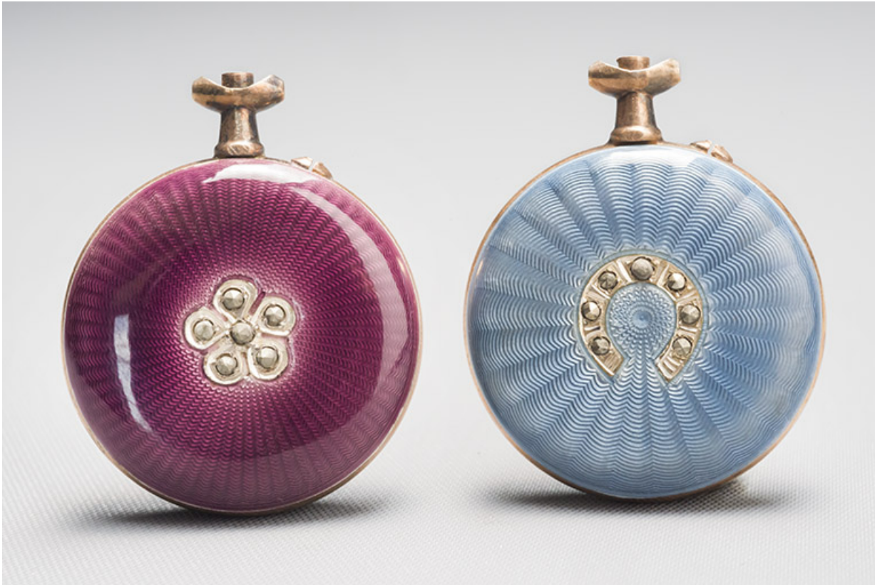
Boîtiers de montres Perronne.

Musée des Amis du Vieux Seloncourt, boîtiers de montres Perronne, s.d. [début 20e siècle].