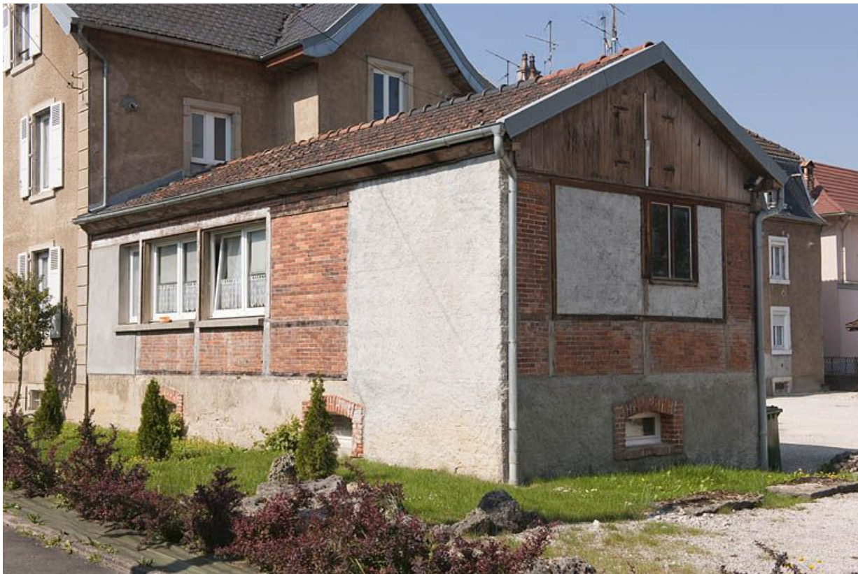
Atelier d'horlogerie adossé à la façade postérieure du logement patronal.

25, Seloncourt, 60 et 64 rue du Général Leclerc