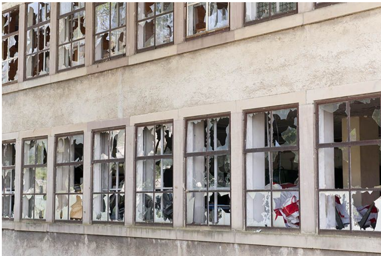
Détail des baies de la façade postérieure.