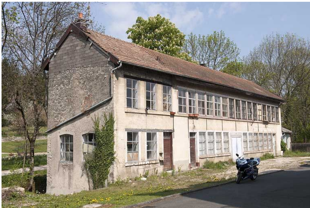
Atelier de fabrication vu de trois quarts gauche.

25, Seloncourt, 60 et 64 rue du Général Leclerc