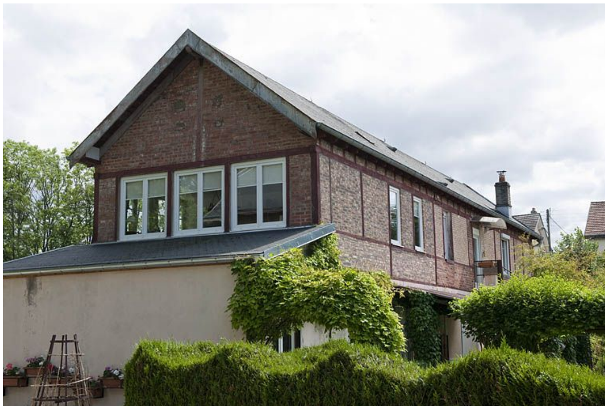
Atelier de fabrication vu de trois quarts arrière.

25, Seloncourt, 23, 25 rue d' Audincourt