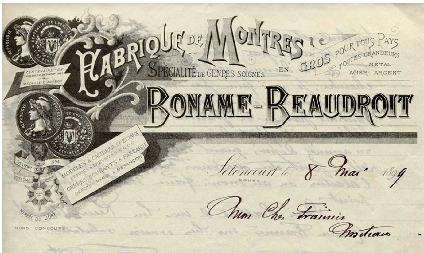
Fabrique de montres Boname-Beaudroit, papier à en-tête, s.d. [1899].

25, Seloncourt, 23, 25 rue d' Audincourt