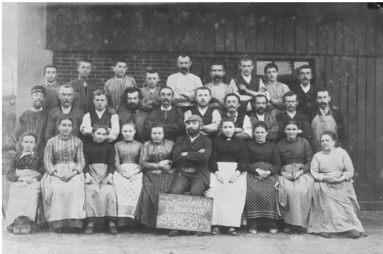
Personnel de l'usine.