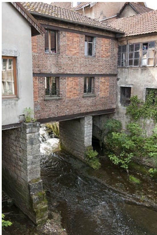
Passage couvert sur le Gland reliant les deux parties de l'usine.

25, Seloncourt, 17 rue d' Audincourt, lieudit : la Maletière