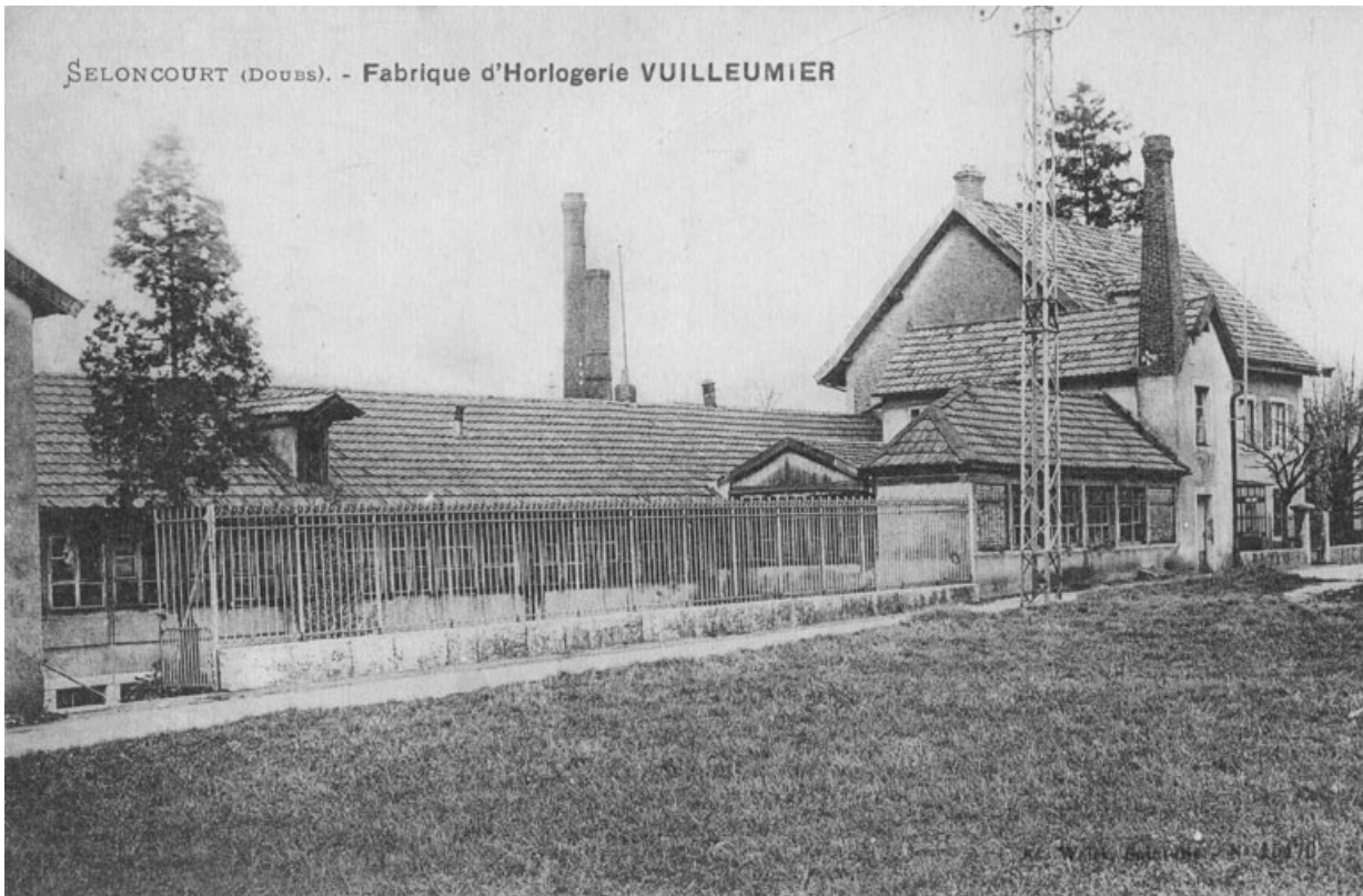
Seloncourt (Doubs). Fabrique d'horlogerie Vuilleumier. 25, Seloncourt, 17 rue d' Audincourt, lieudit : la Maletière