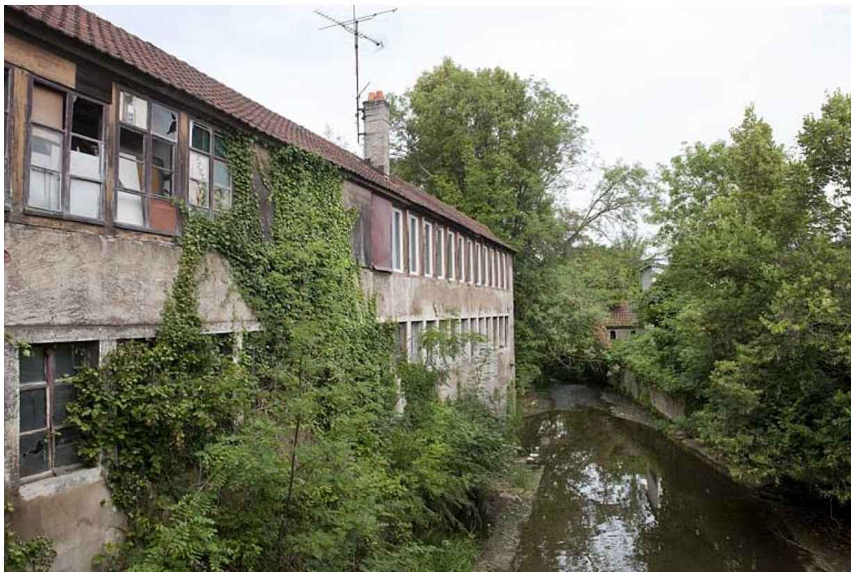
Façade est de l'atelier d'horlogerie depuis le passage couvert.