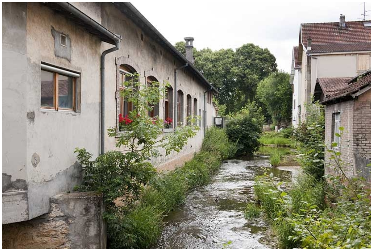
Vue sur l'amont du Gland depuis le passage couvert.

25, Seloncourt, 17 rue d' Audincourt, lieudit : la Maletière