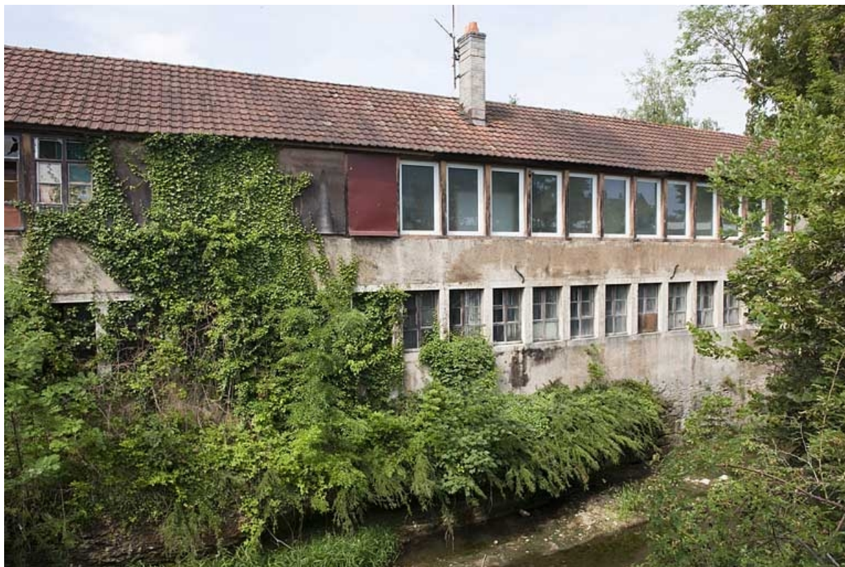
Façade sur le Gland de l'atelier d'horlogerie.

25, Seloncourt, 17 rue d' Audincourt, lieudit : la Maletière