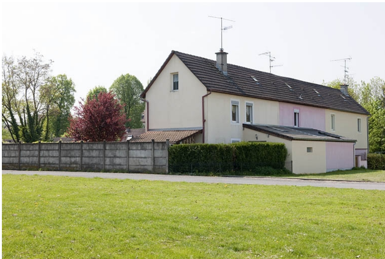
Bâtiment des magasins, remises et logements. Vue de trois quarts arrière.