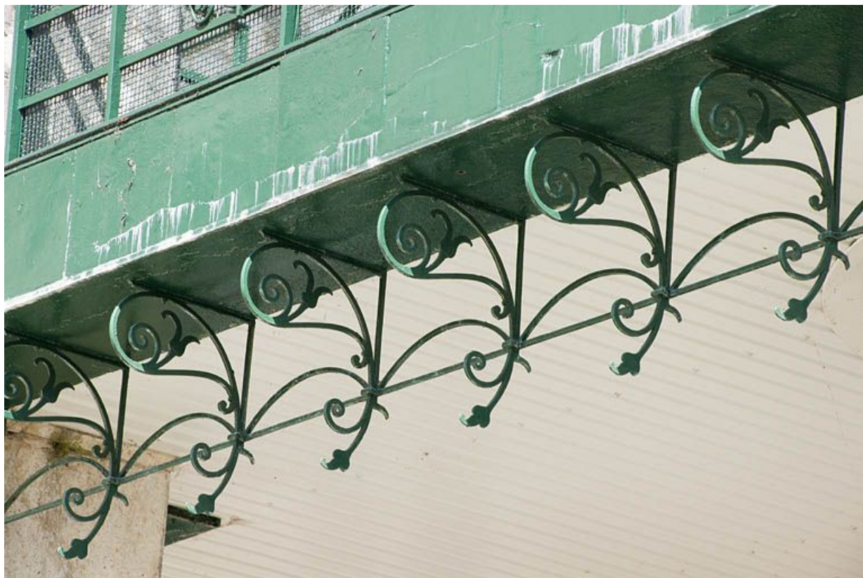
Passerelle sur la façade postérieure. Eléments de décor en fer forgé. 25, Seloncourt, 20 rue de la Côte