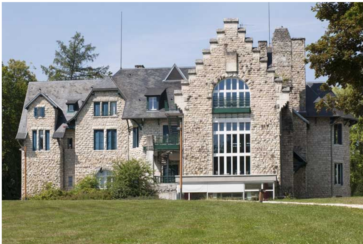
Façade postérieure depuis l'est.