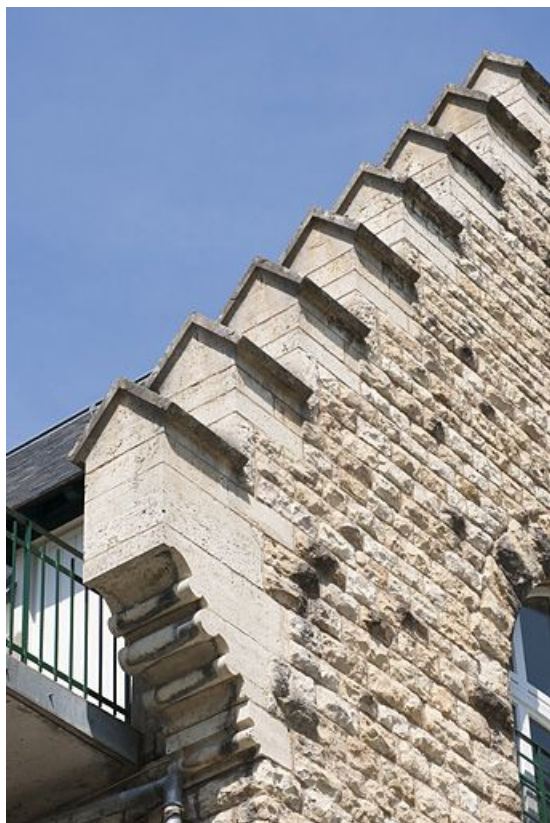
Façade postérieure. Détail des redents du pignon.