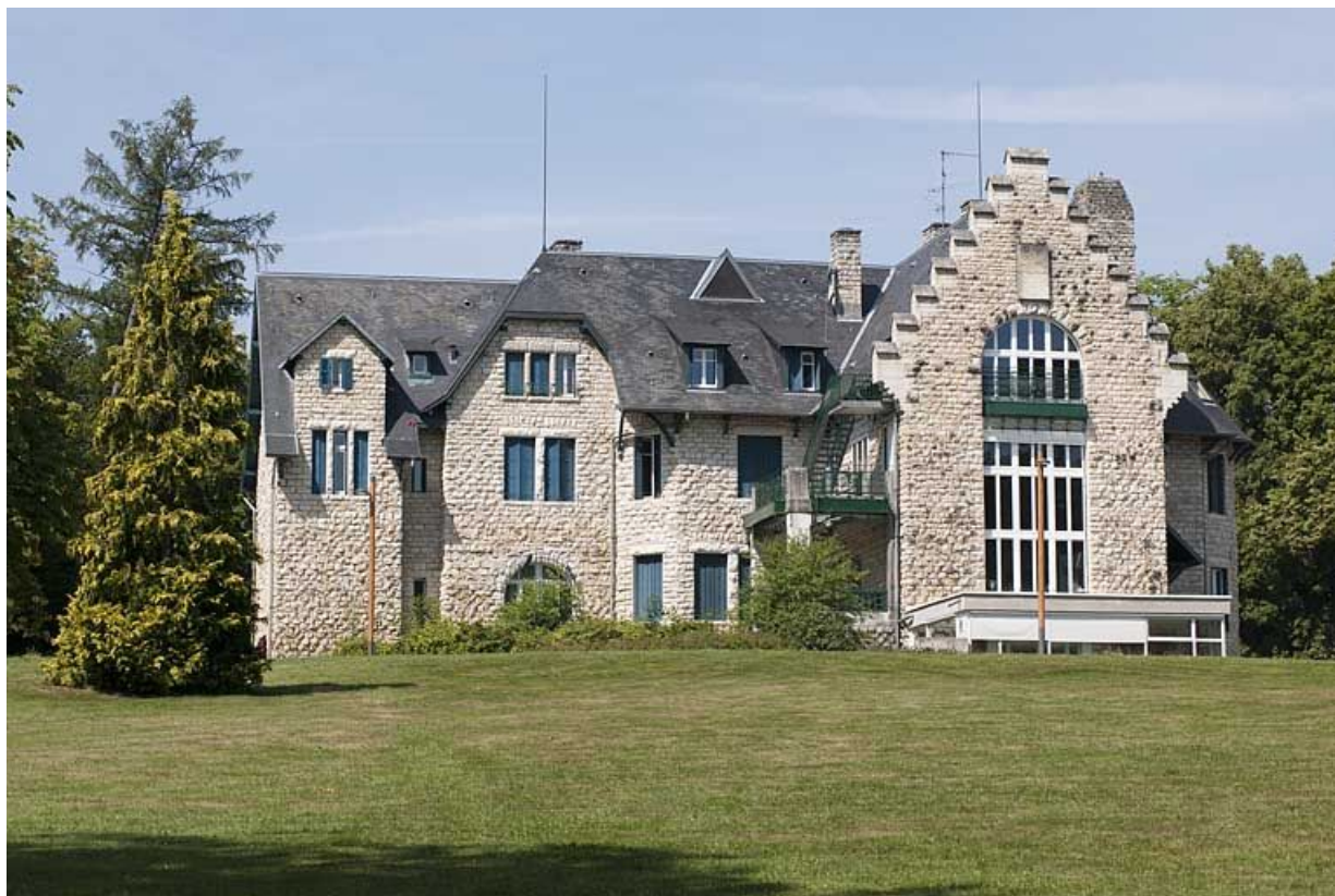
Façade postérieure depuis le sud-est.