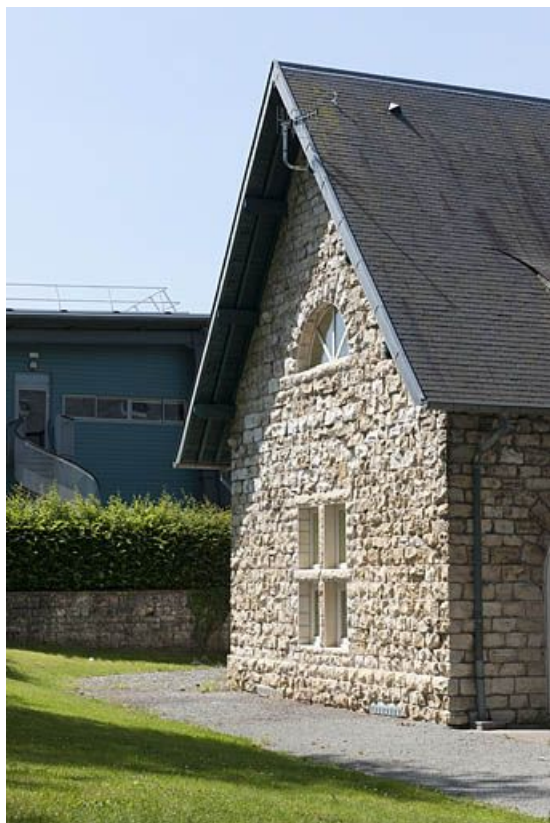
Conciergerie. Pignon sud de la façade postérieure. 25, Seloncourt, 20 rue de la Côte