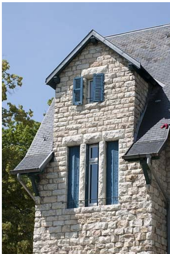
Façade postérieure. Pignon sud.