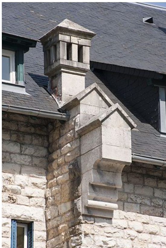
Façade antérieure. Détail d'une console.