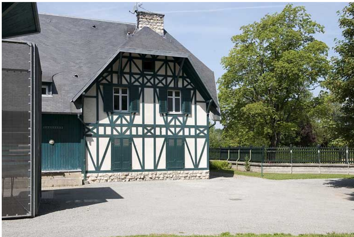
Conciergerie. Pignon nord de la façade postérieure.