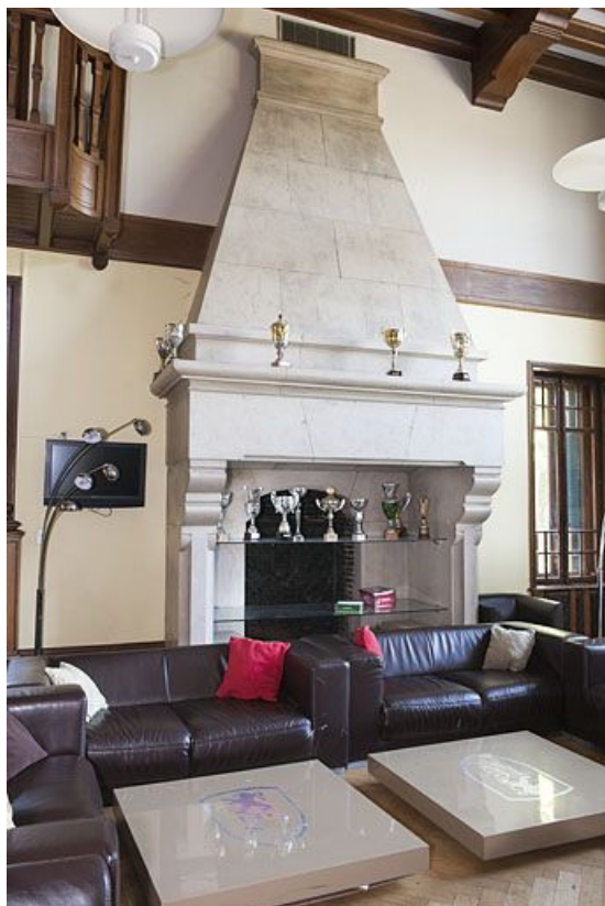
Cheminée du salon.