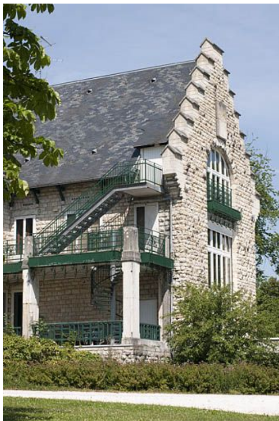
Façade postérieure. Pignon vu de trois quarts.