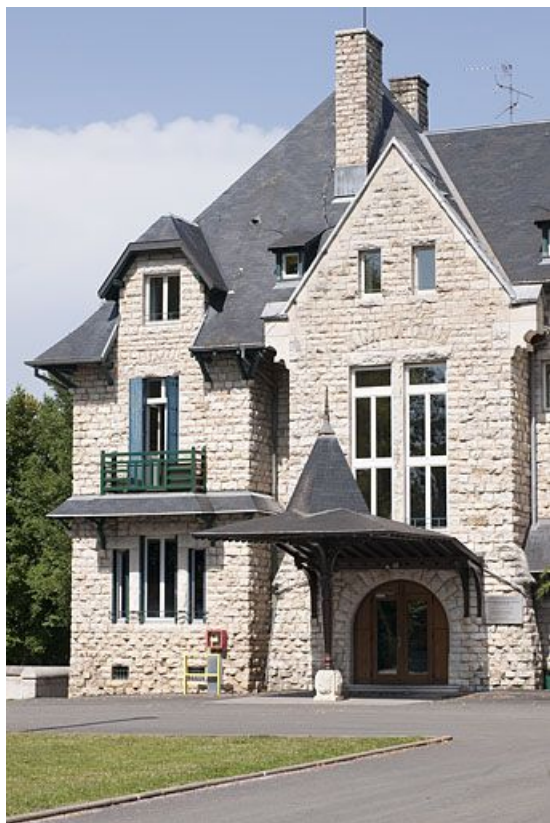
Partie nord de la façade antérieure.