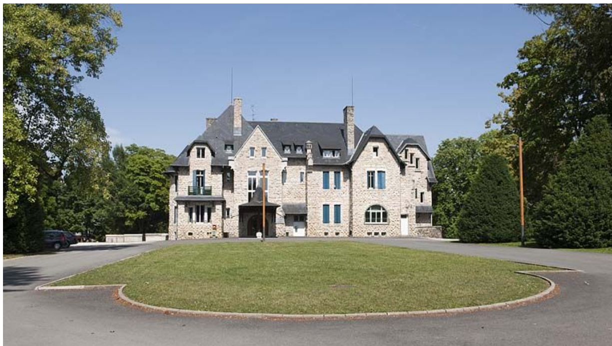
Façade antérieure depuis l'entrée.