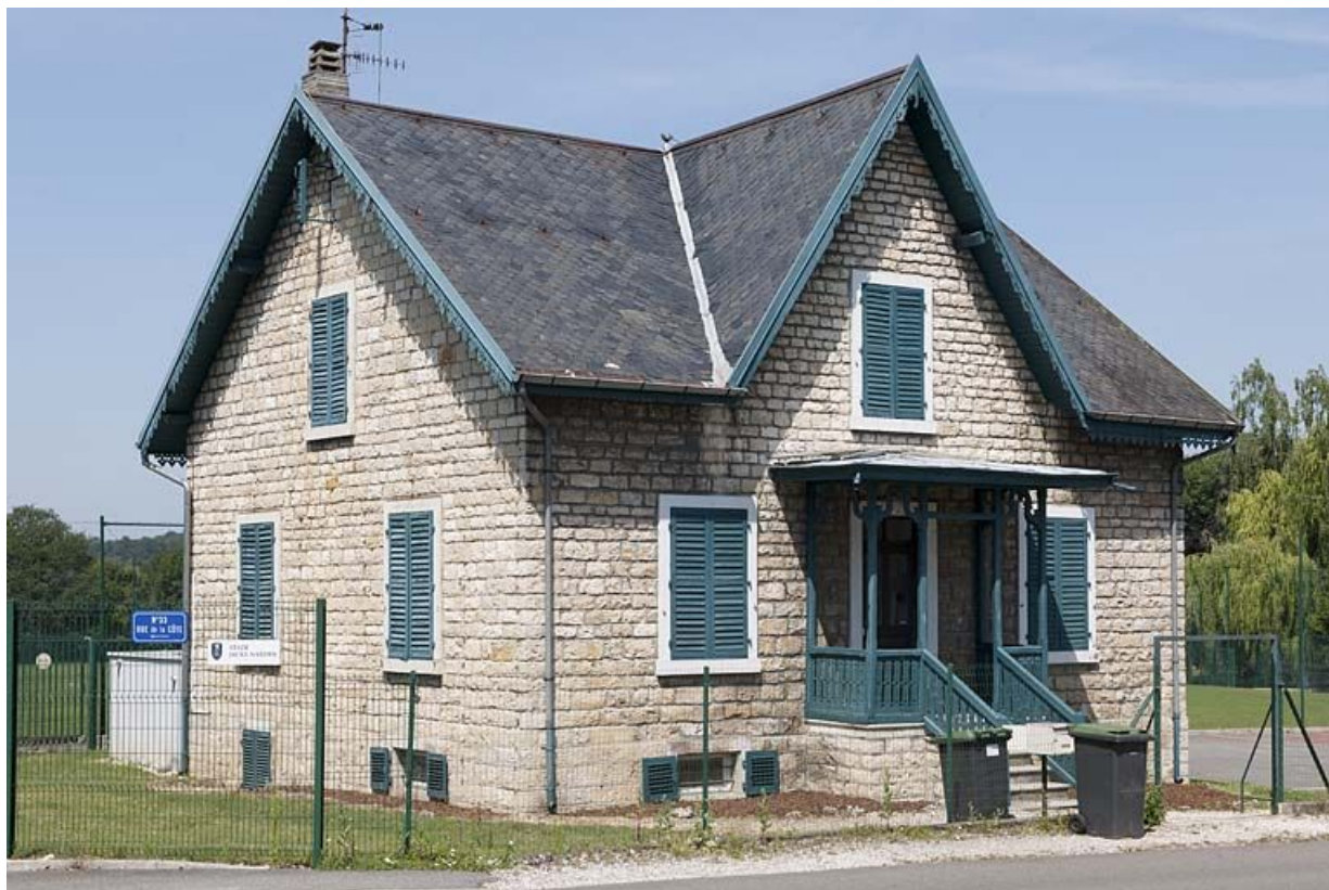
Logement annexe (?) rue de la Côte.