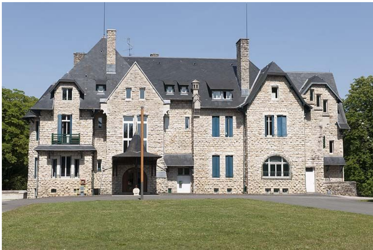
Façade antérieure vue de face.