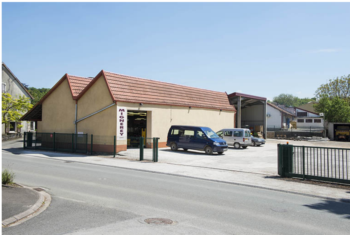
Atelier de fabrication vu de trois quarts.