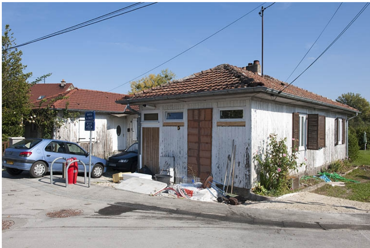
Maison jumelée (n°8-10) vue de trois quarts.