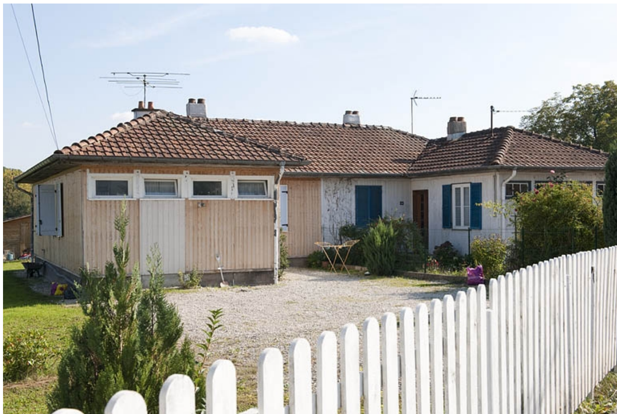
Maison jumelée située aux n°12-14.