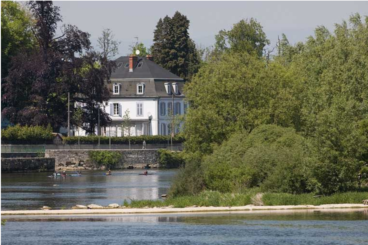
Vue d'ensemble depuis le sud.