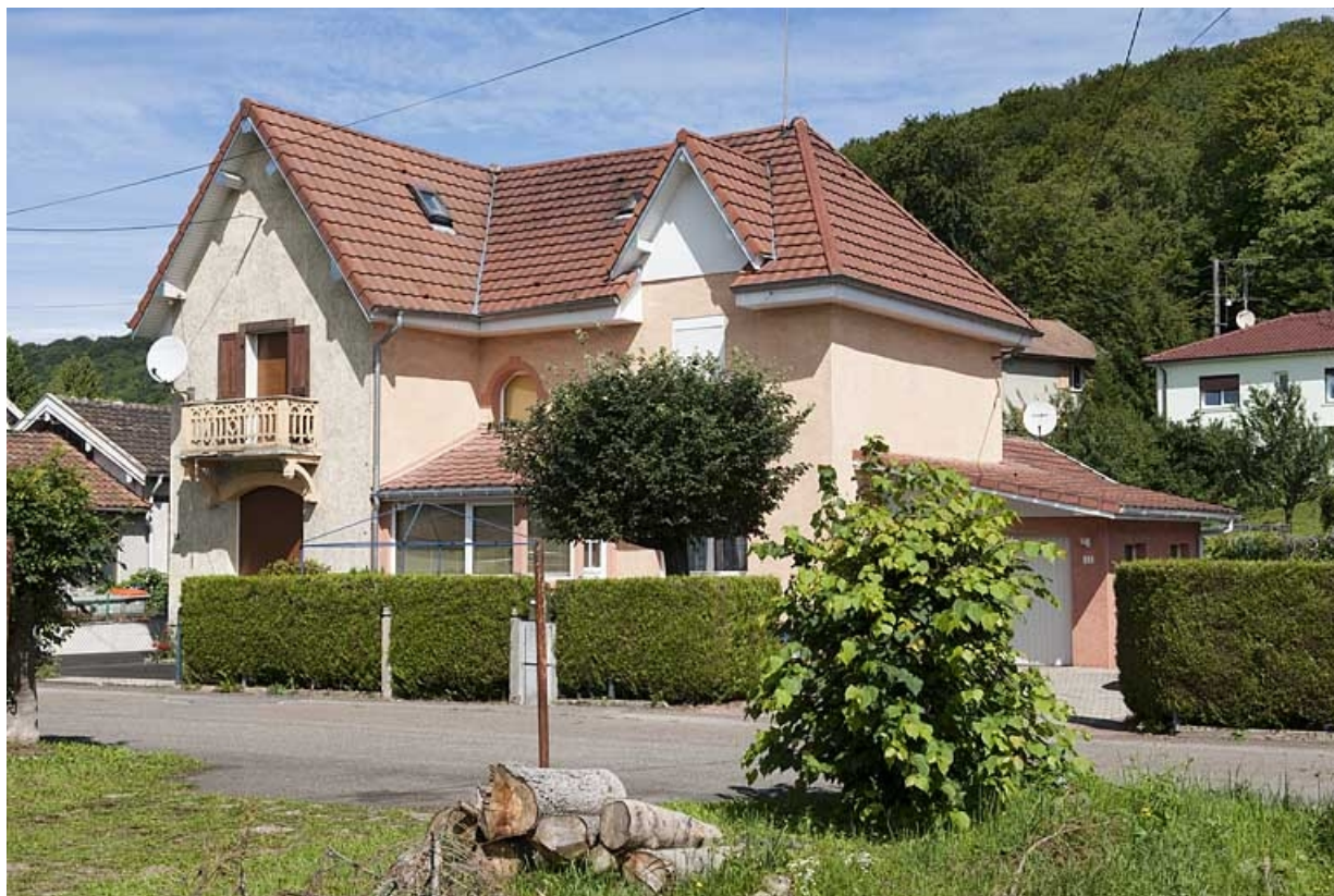
Maison de contremaîtres (n°12-14). 25, Bavans, 1 à 19 rue de l' Emaillerie