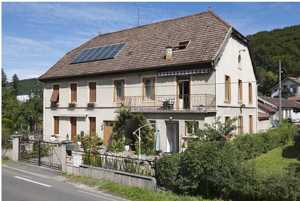
Atelier d'émaillerie, puis magasin coopératif. 25, Bavans, 1 à 19 rue de l' Emaillerie