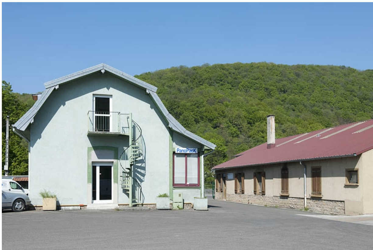
Bureaux et magasins industriels depuis l'est. 25, Bart rue de la Gare, lieudit : ZA des Andanges