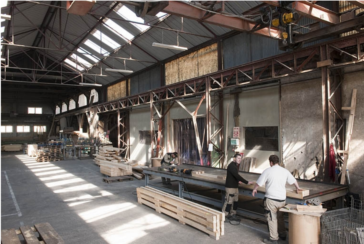
Halle de fonderie. Vue d'ensemble.

25, Bart rue de la Gare, lieudit : ZA des Andanges