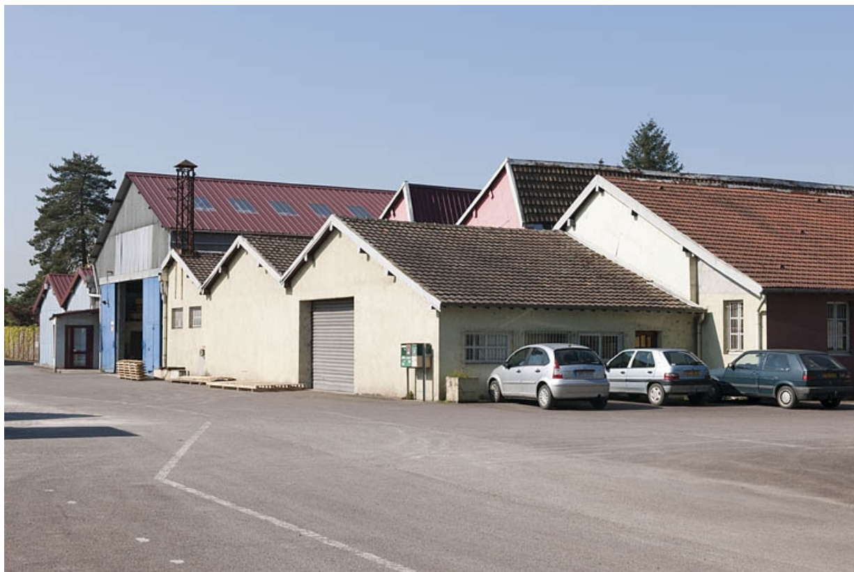
Bâtiments industriels vus depuis le nord-est. 25, Bart rue de la Gare, lieudit : ZA des Andanges