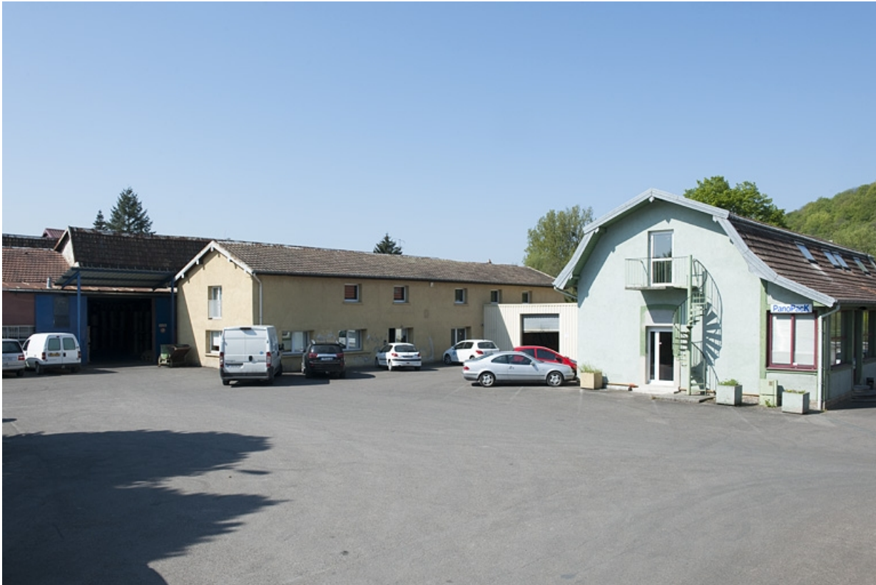
Vue d'ensemble depuis la cour : ateliers de fabrication et bureaux.

25, Bart rue de la Gare, lieudit : ZA des Andanges