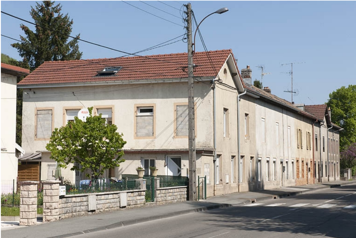
Logements ouvriers. Vue de trois quarts gauche.

25, Bart rue de la Gare, lieudit : ZA des Andanges