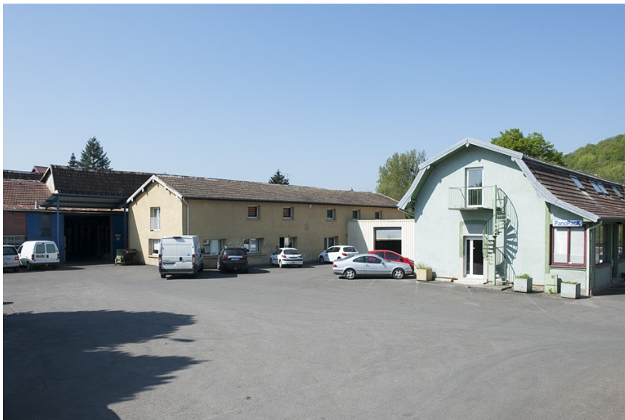
Vue d'ensemble depuis la cour : ateliers de fabrication et bureaux.

25, Bart rue de la Gare, lieudit : ZA des Andanges