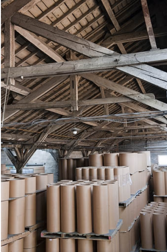
La charpente du magasin industriel (cadrage vertical).

25, Bart rue de la Gare, lieudit : ZA des Andanges