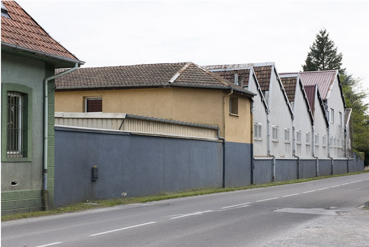
Façade sur rue de l'atelier de fabrication.

25, Bart rue de la Gare, lieudit : ZA des Andanges