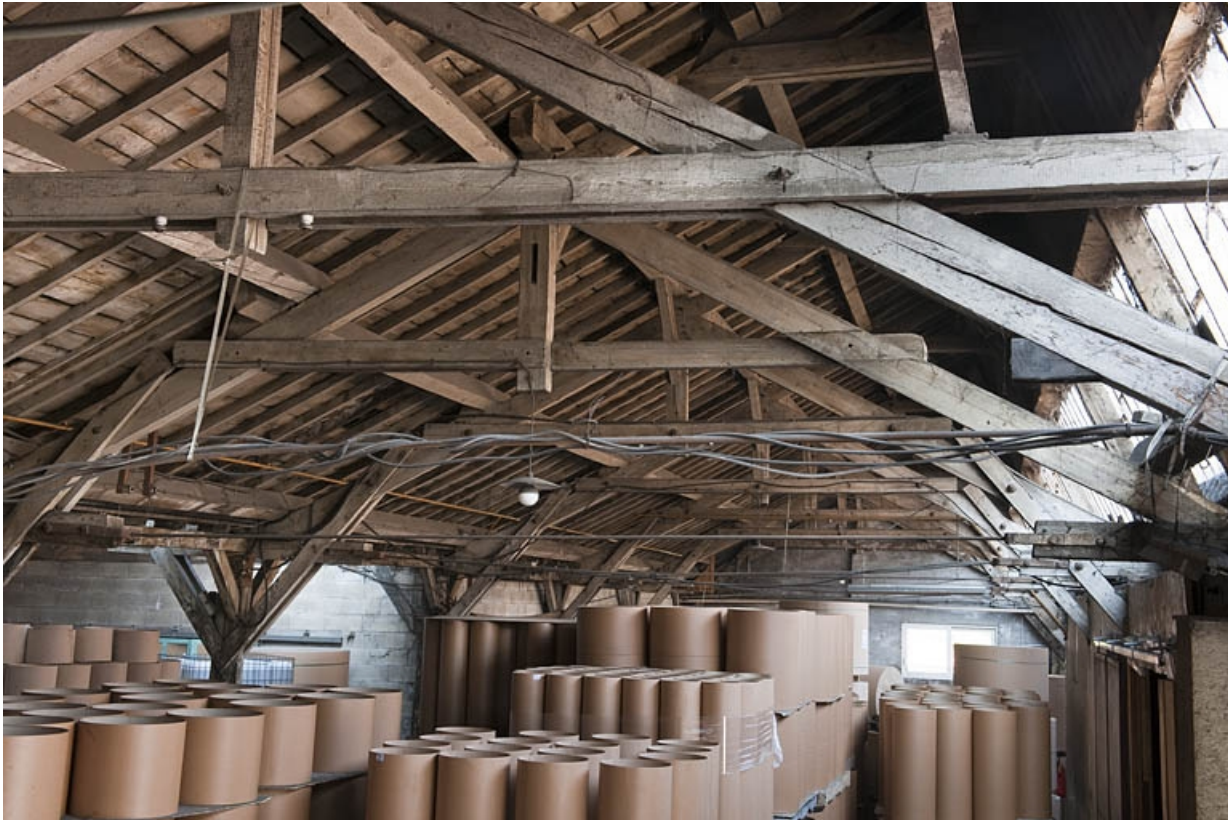
Magasin industriel. Détail de la charpente en bois.

25, Bart rue de la Gare, lieudit : ZA des Andanges