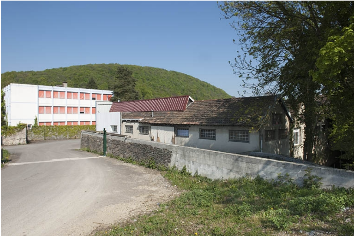
Bâtiment de bureaux et ancien atelier d'émaillage.

25, Bart rue de la Gare, lieudit : ZA des Andanges