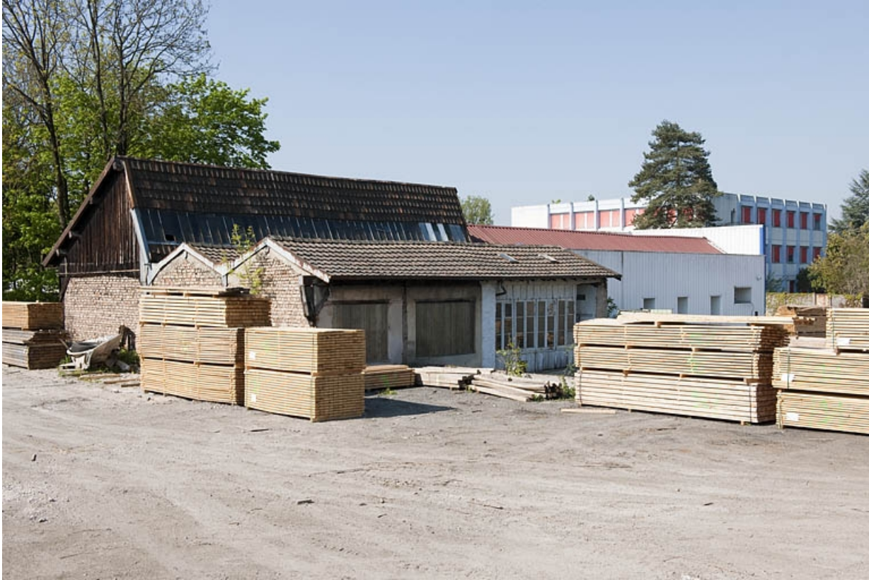
Atelier de découpage et bâtiment de bureaux. 25, Bart rue de la Gare, lieudit : ZA des Andanges