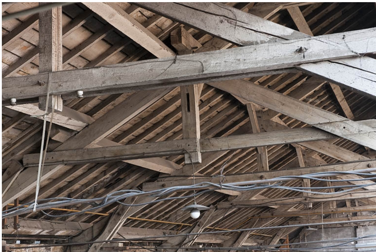
Détail de la charpente du magasin industriel. 25, Bart rue de la Gare, lieudit : ZA des Andanges