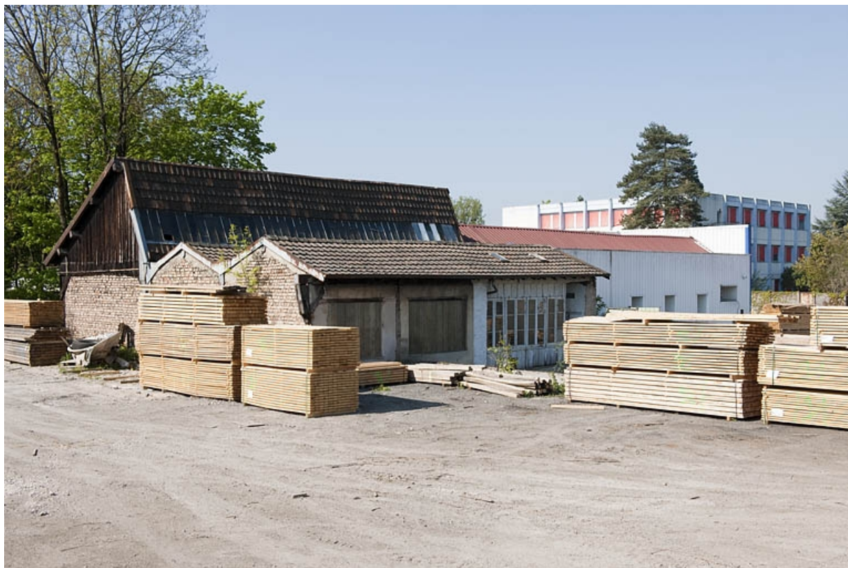
Atelier de découpage et bâtiment de bureaux. 25, Bart rue de la Gare, lieudit : ZA des Andanges