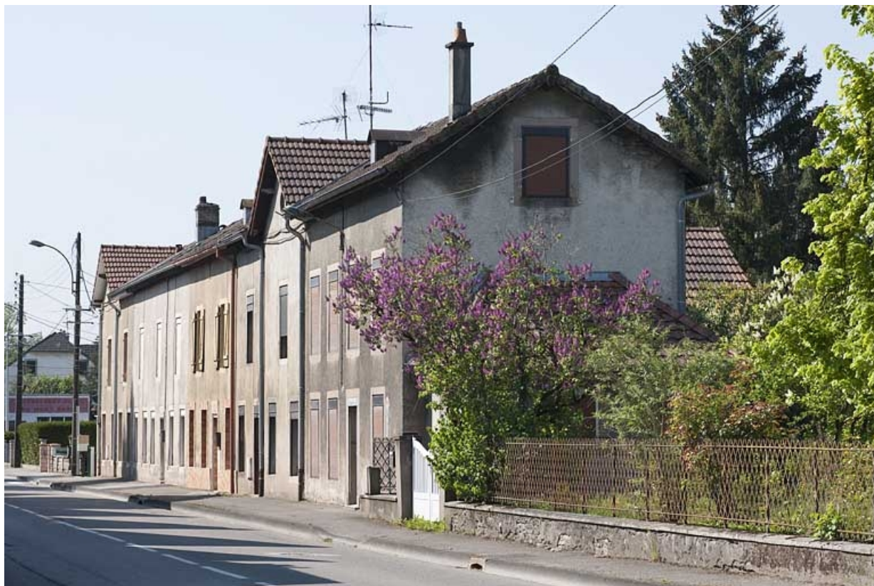
Logements ouvriers. Vue de trois quarts droite. 25, Bart rue de la Gare, lieudit : ZA des Andanges