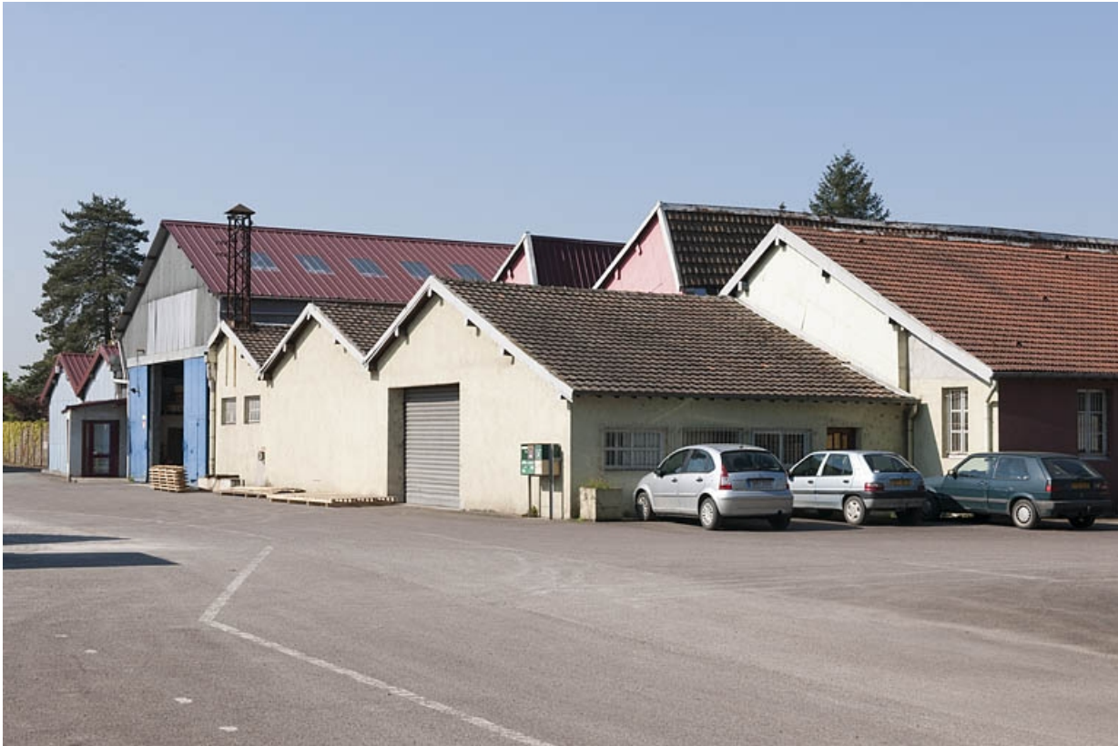
Bâtiments industriels vus depuis le nord-est.

25, Bart rue de la Gare, lieudit : ZA des Andanges