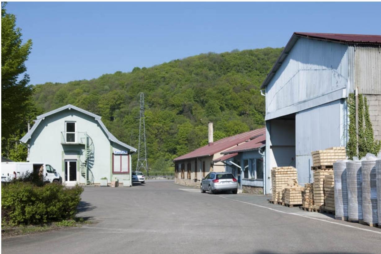
Vue d'ensemble depuis la cour, vers l'est.

25, Bart rue de la Gare, lieudit : ZA des Andanges