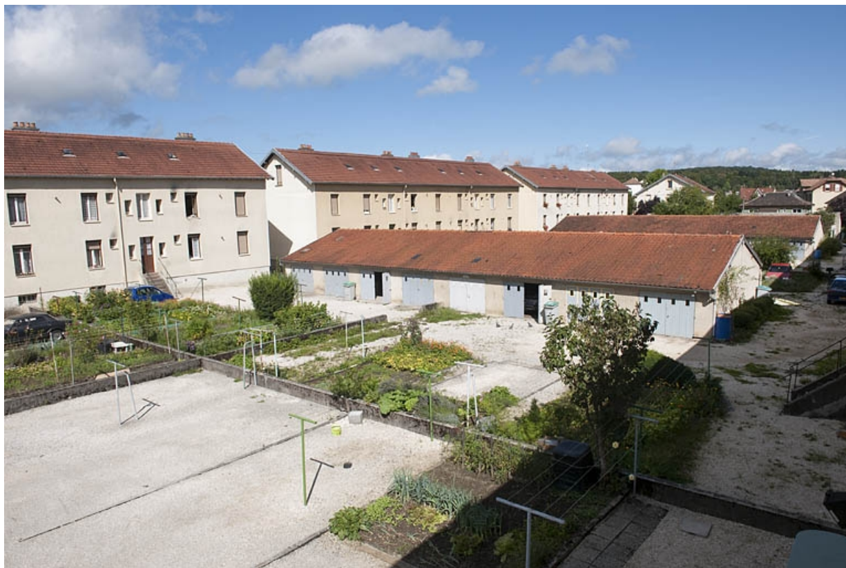
Vue d'ensemble plongeante sur les jardins et garages.

25, Mandeure, lieudit : Cités du Mexique