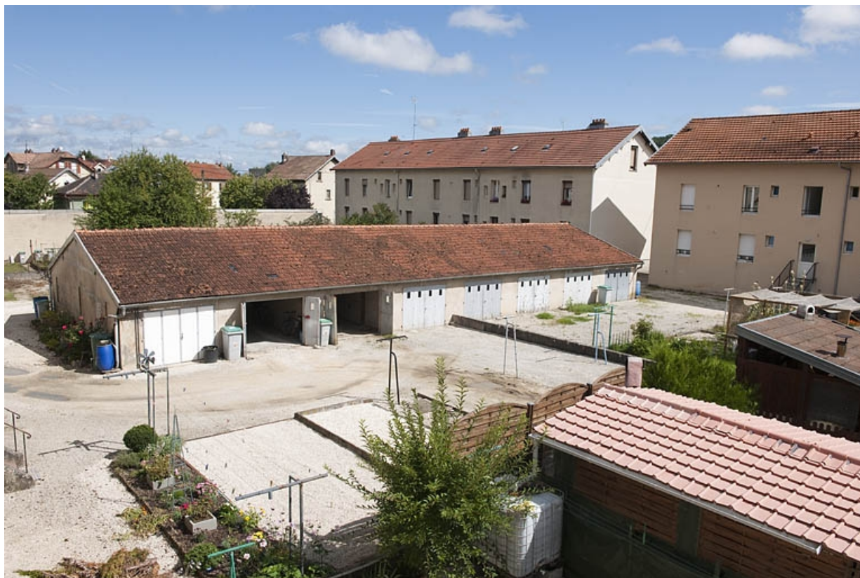
Façades postérieures des habitations sur les jardins et garages.

25, Mandeure, lieudit : Cités du Mexique