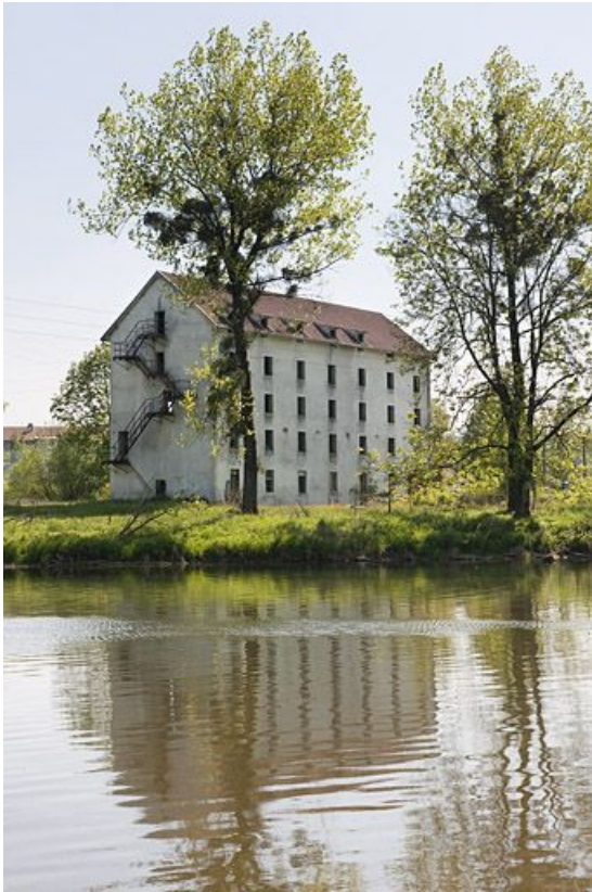
Vue d'ensemble depuis le nord.

25, Voujeaucourt rue du Moulin, lieudit : la Lange