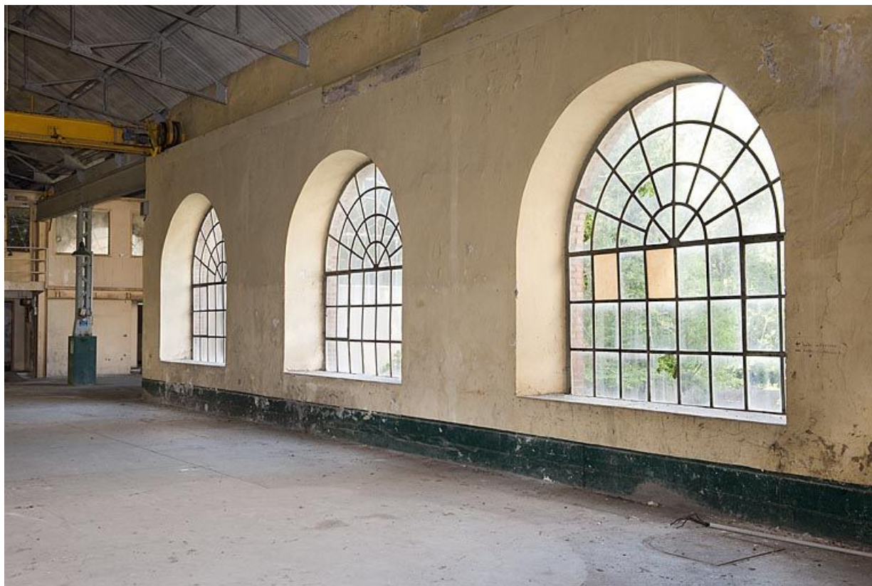
Salle des turbines. Détail des baies de la façade ouest.

25, Voujeaucourt, lieudit : la Grosse Pâtur