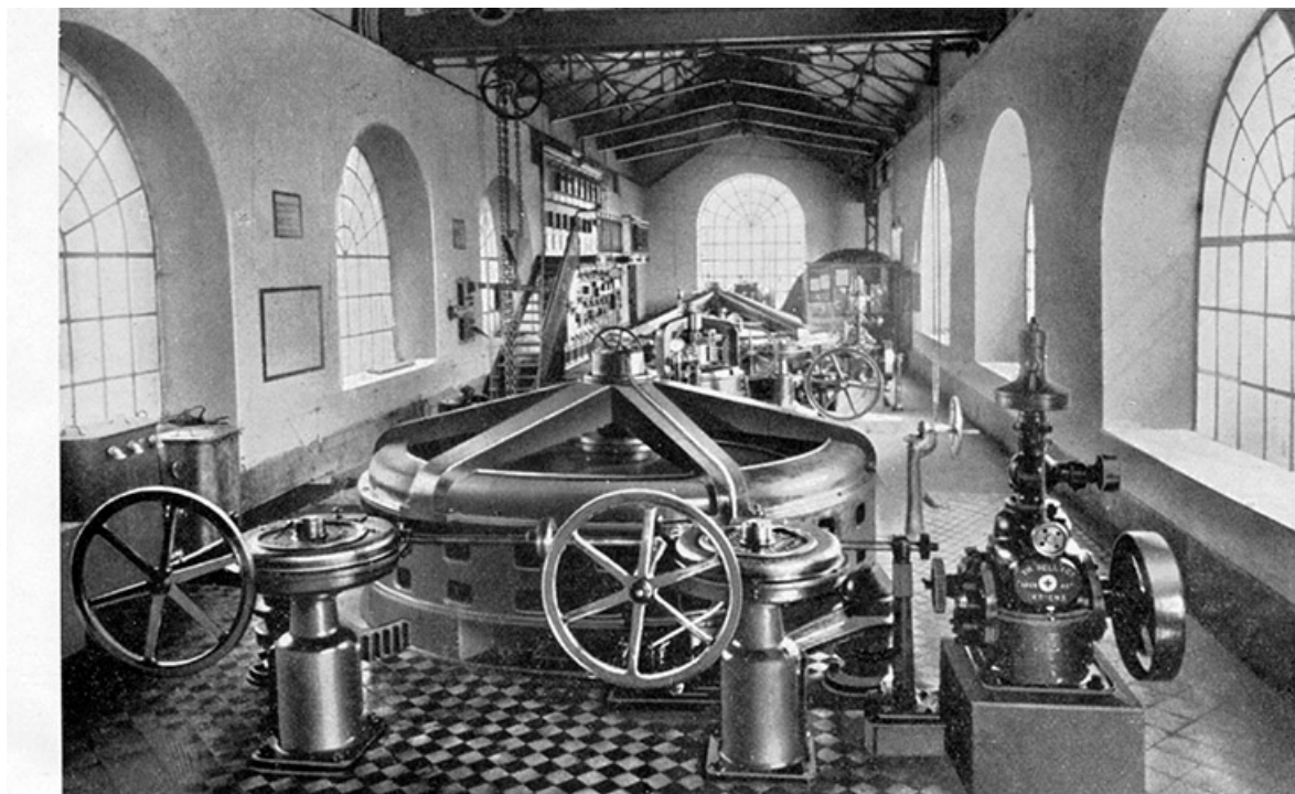
USINE DE BELCHAMP : Salle des machines comprenant 2 groupes à axe vertical de 350 CV chacun.

Usine de Belchamp. Salle des machines. Photogr., s.n., s.d. [vers 1935].