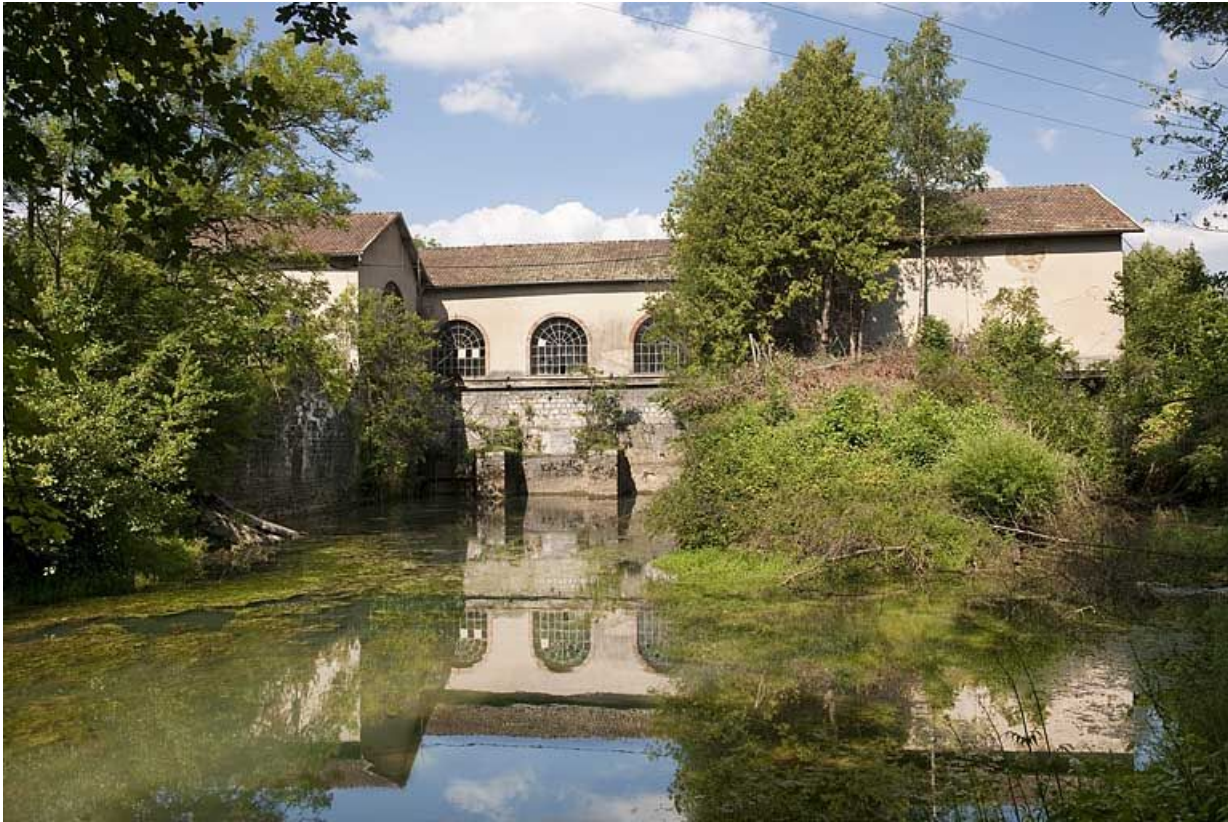
Vue d'ensemble depuis l'aval du bief.

25, Voujeaucourt, lieudit : la Grosse Pâtur