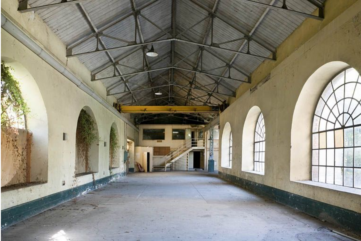
Vue intérieure de la salle des turbines.

25, Voujeaucourt, lieudit : la Grosse Pâtur