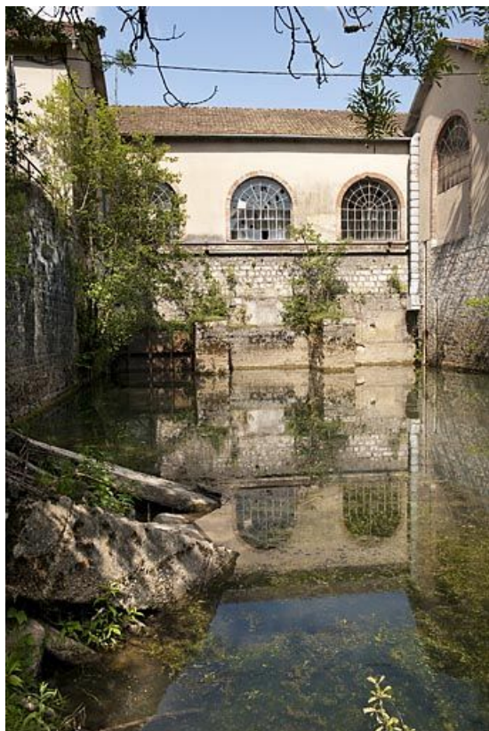
Mur oriental de la salle des turbines et canal de fuite.

25, Voujeaucourt, lieudit : la Grosse Pâtur