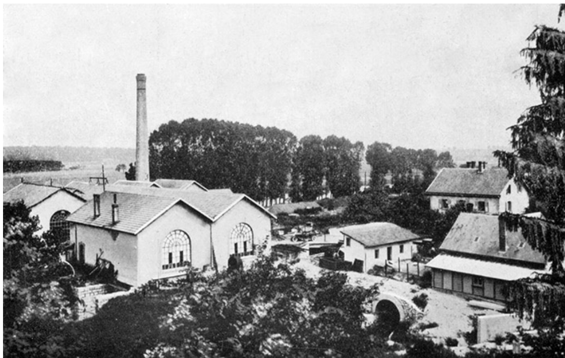
USINE DE BELCHAMP : Vue générale. Puissance 700 CV. Hauteur de chute : 4 m. 50.

Usine de Belchamp. Vue d'ensemble. Photogr., s.n., s.d. [vers 1935].