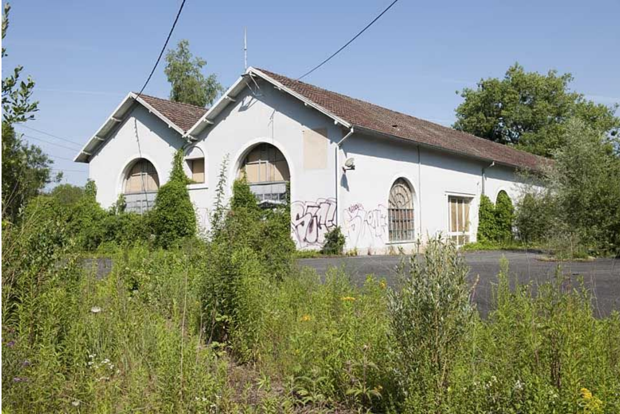
Vue d'ensemble depuis l'entrée.

25, Voujeaucourt, lieudit : la Grosse Pâtur