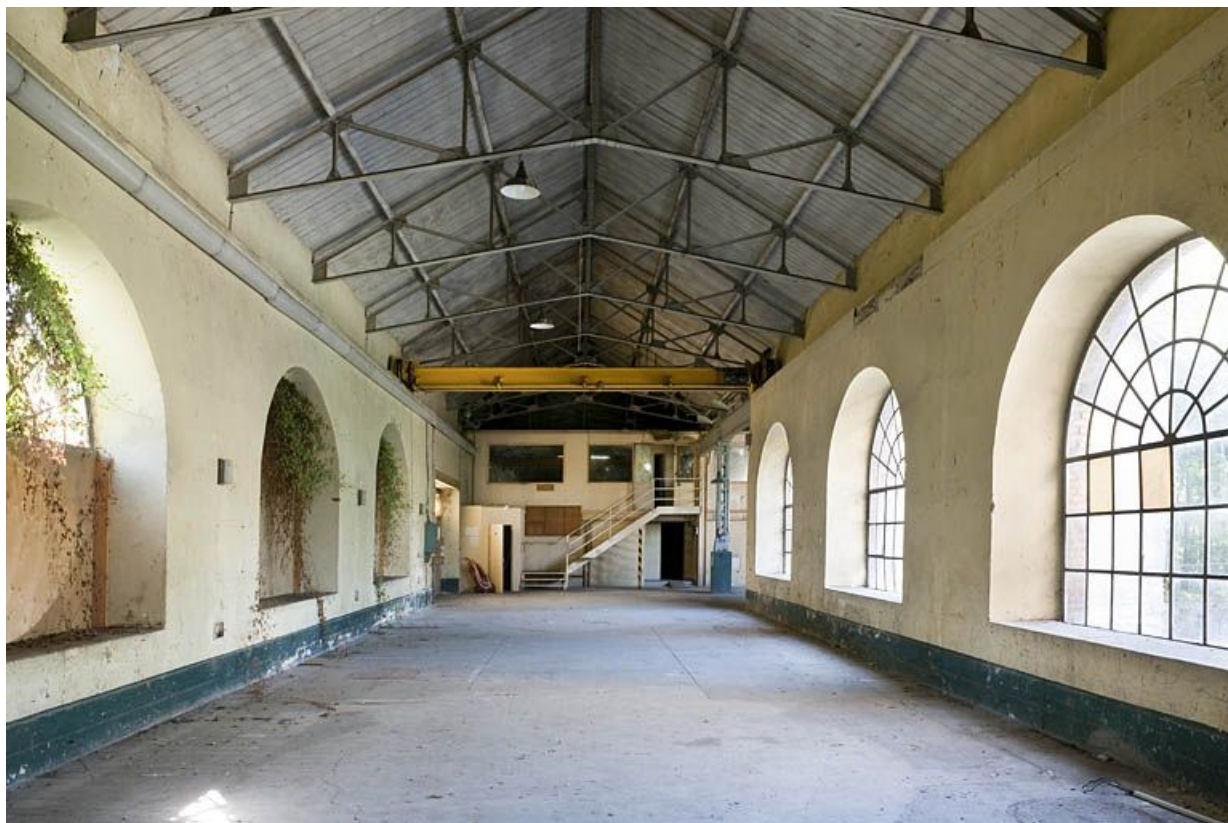
Vue intérieure de la salle des turbines.

25, Voujeaucourt, lieudit : la Grosse Pâtüre