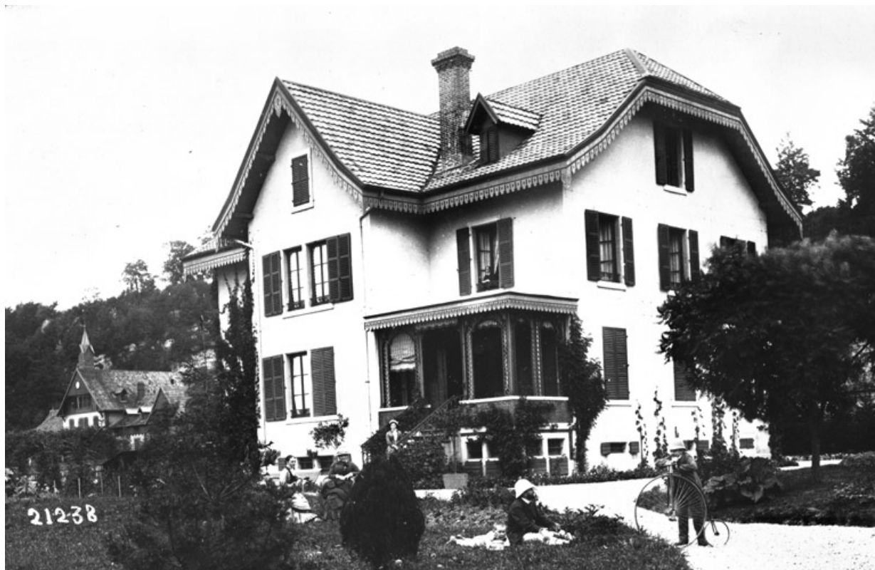
Vue d'ensemble depuis le jardin.

25, Valentigney, 6 route de Beaulieu, lieudit : les Prés du Comte