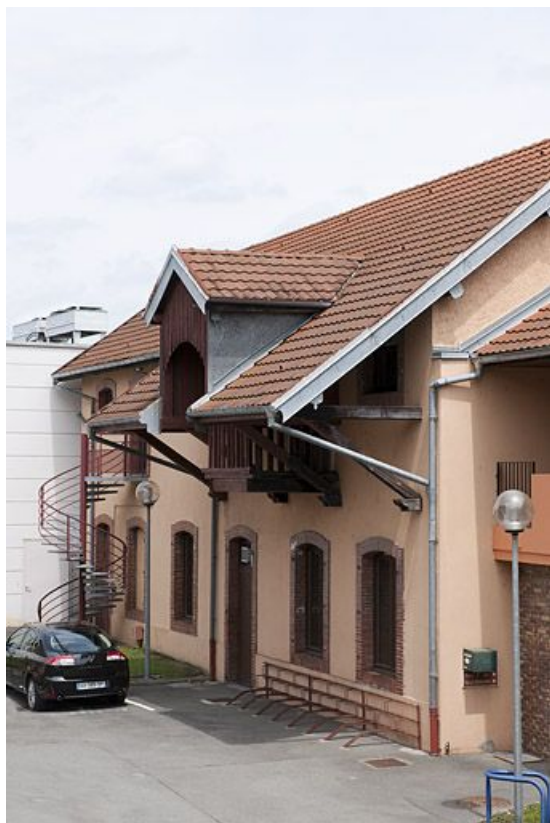
Façade des magasins de stockage.