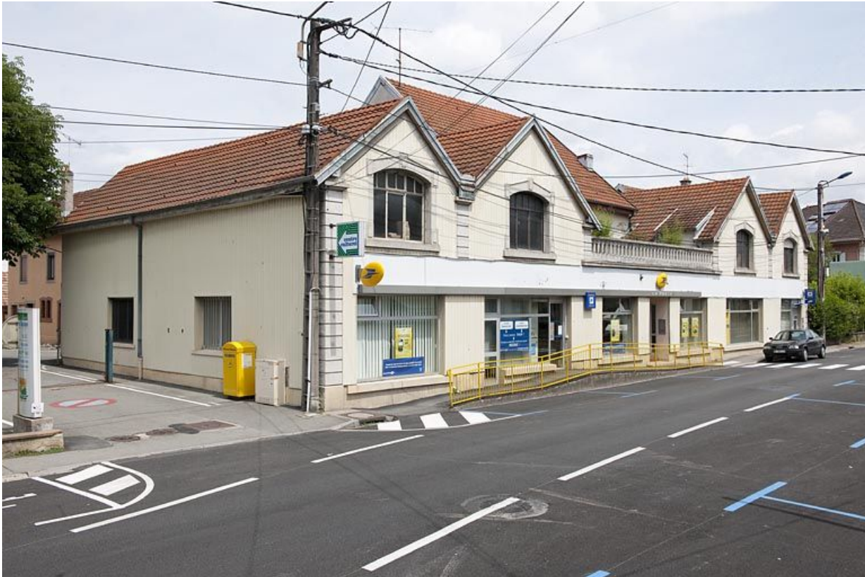
Vue de trois quarts droite depuis la rue.