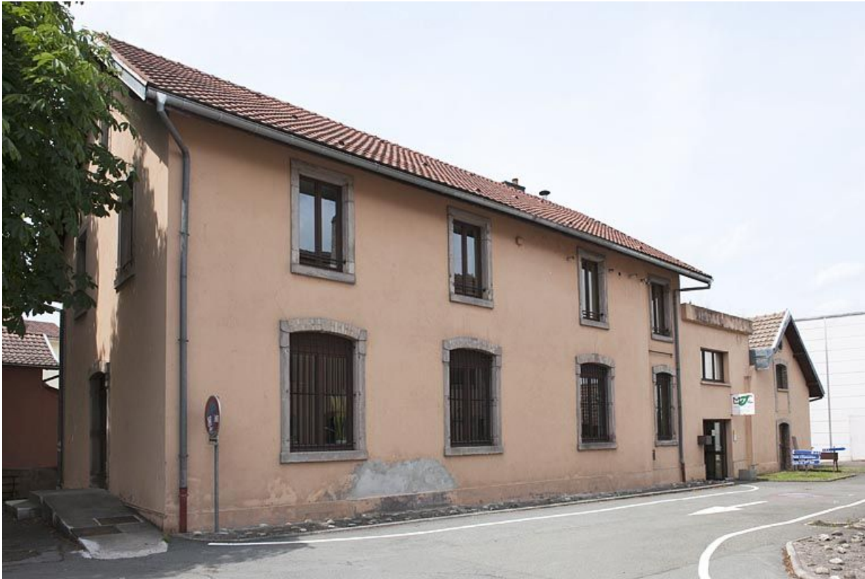
Ancien magasin de boucherie.