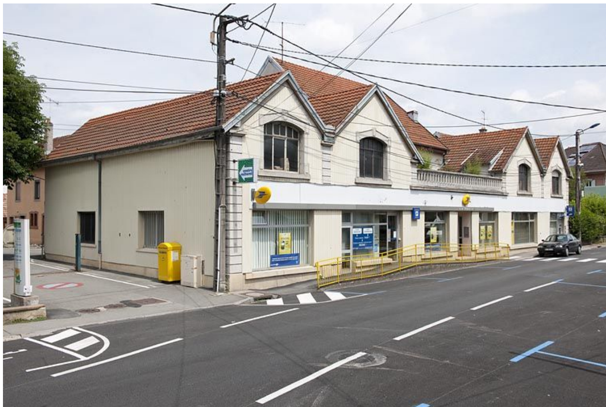
Vue de trois quarts droite depuis la rue.