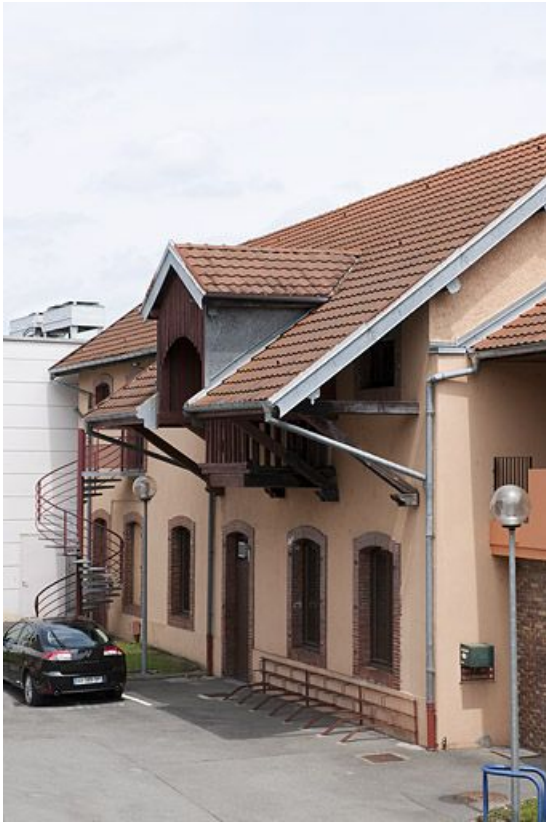
Façade des magasins de stockage.