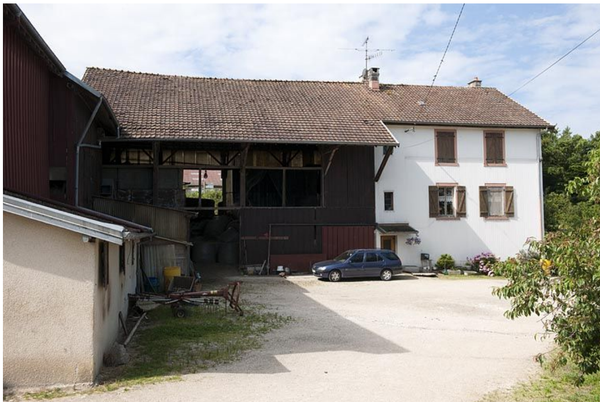
Second logement (extension ouest).