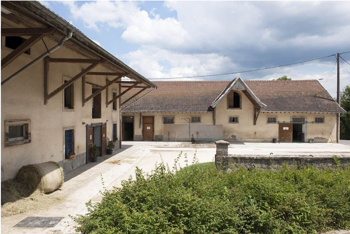
Bâtiments agricoles depuis le sud.