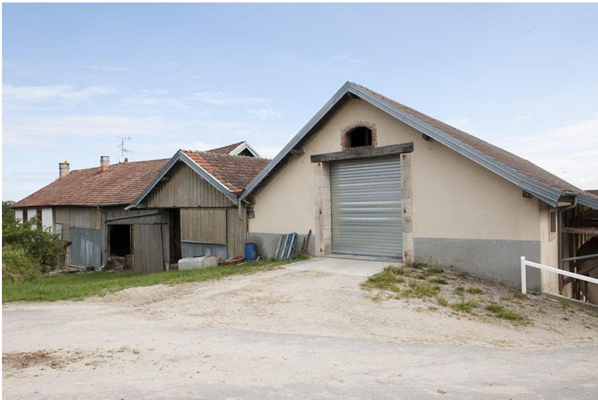
Pignons sud de l'écurie.