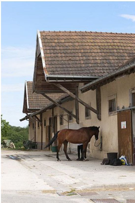
Ancienne étable. Vue de trois quarts.