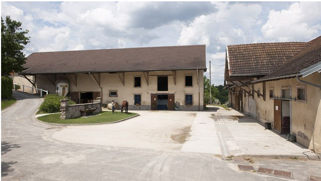
Cour de la ferme et bâtiments agricoles.