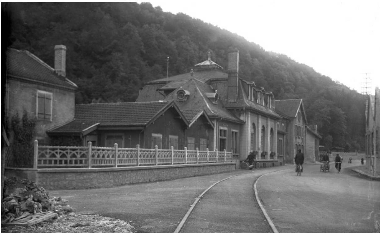
Le cercle de Beaulieu.