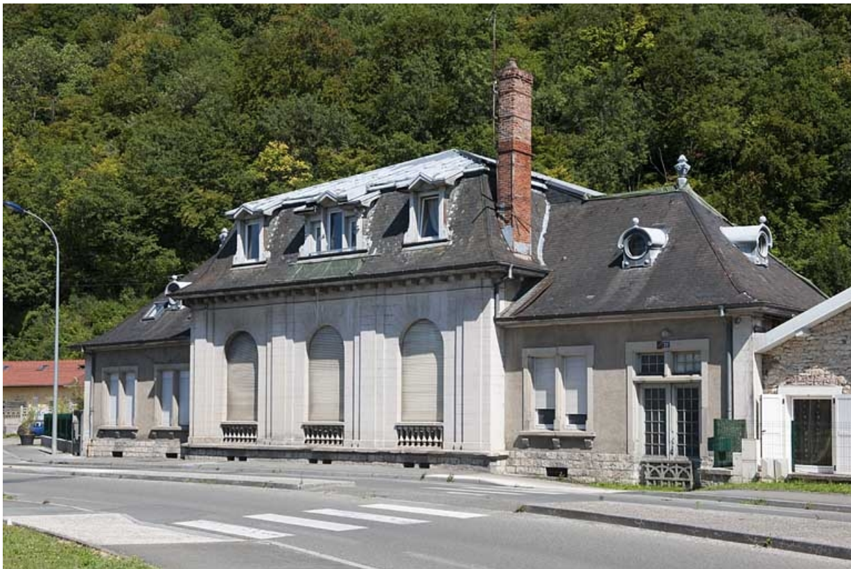
Vue de trois quarts droite.