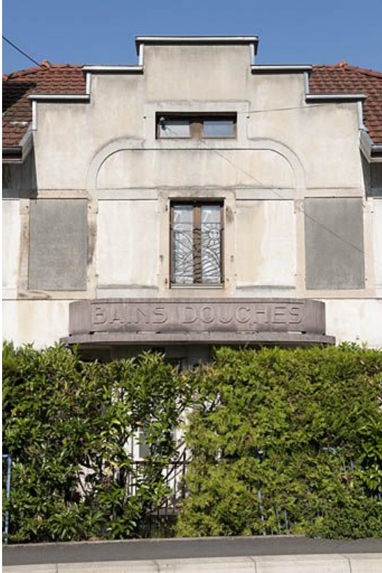
Détail de l'inscription de la façade.

25, Valentigney, 47, 49 rue des Gravieres