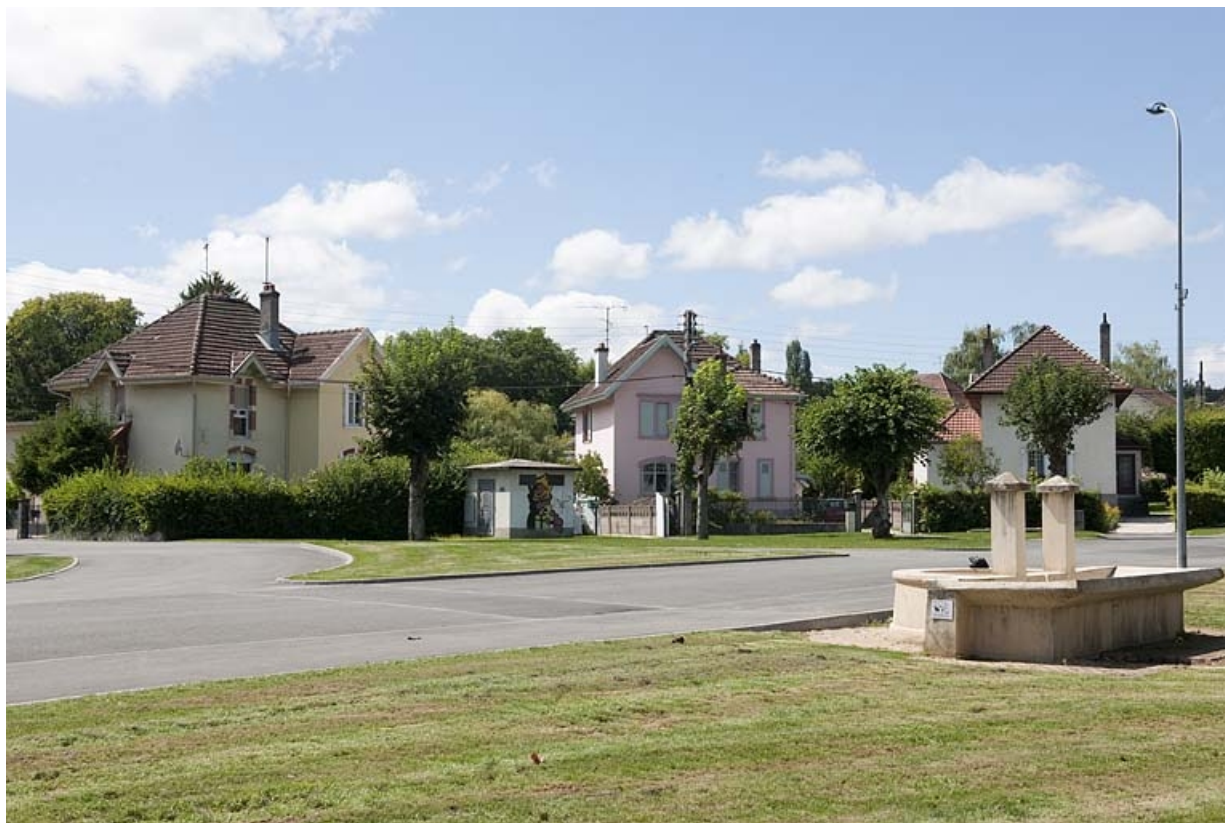
Maisons donnant sur la place semi-circulaire de l'avenue Frédéric Bataille.