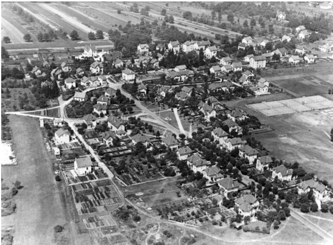
Vue aérienne depuis le sud-est.