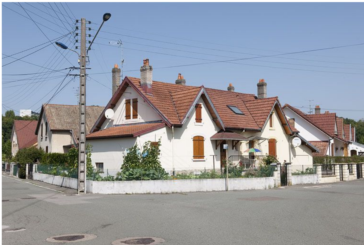
Maisons jumelées à l'intersection des rues des Pâquerettes et des Lavandes.