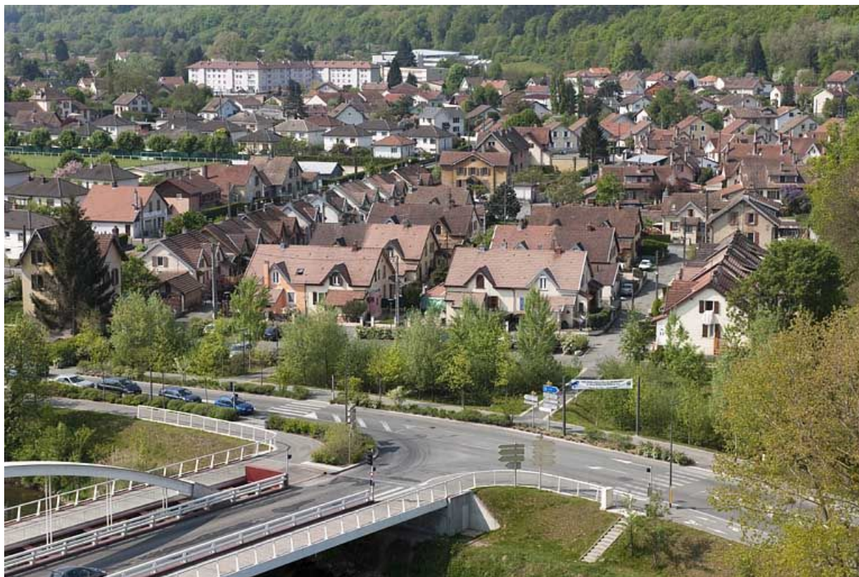
Vue plongeante depuis l'est.