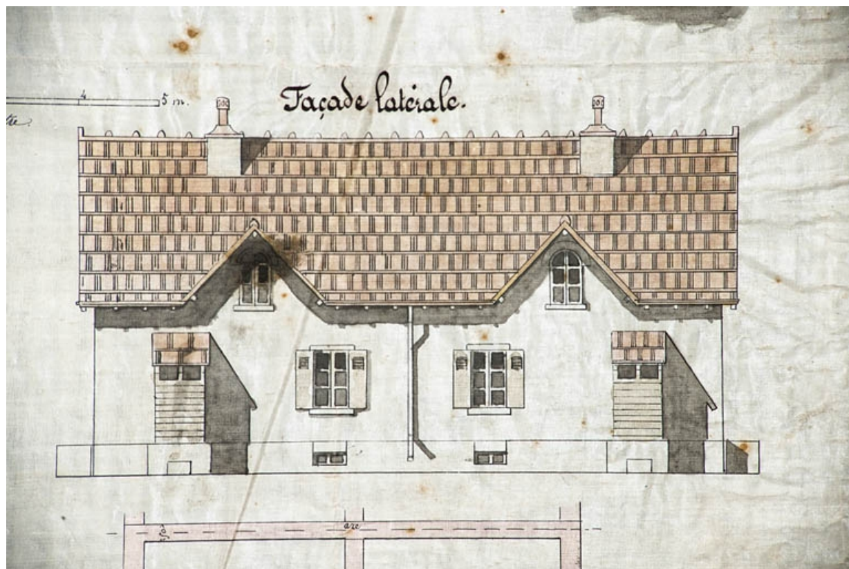
Cité Constant Peugeot et Cie. Maison à quatre logements. Façade latérale.