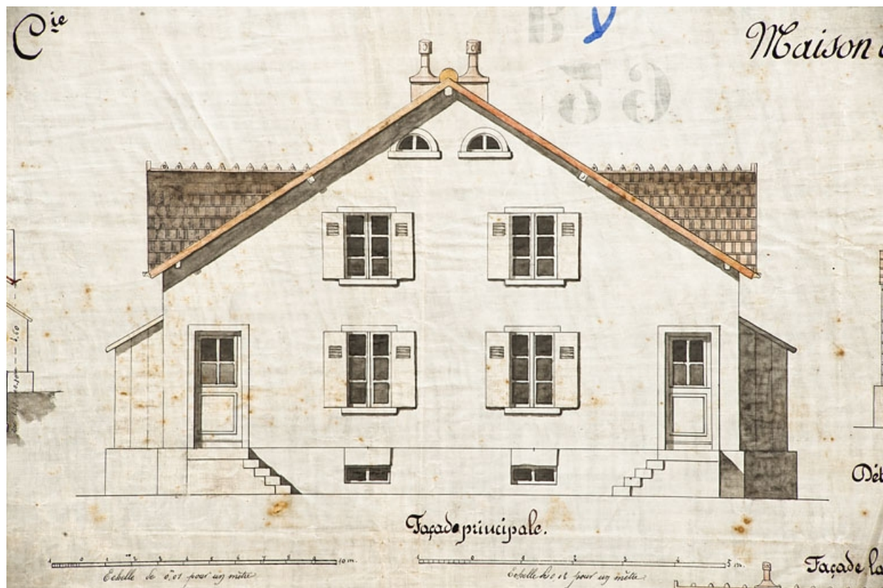
Cité Constant Peugeot et Cie. Maison à quatre logements. Façade principale.