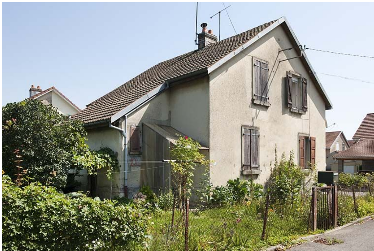
Maison jumelée vue de trois quarts gauche.