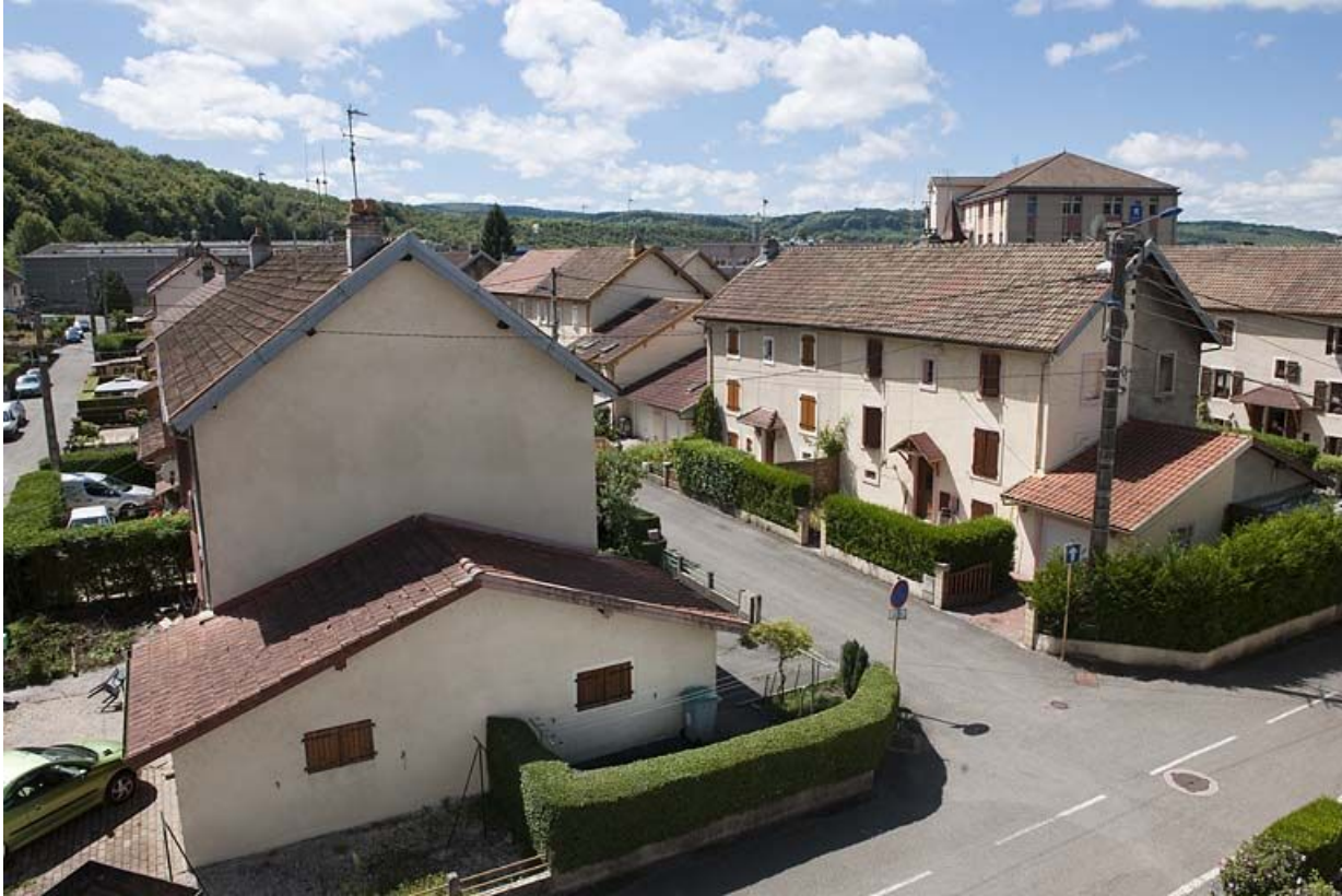
Vue plongeante depuis le nord.

25, Valentigney, lieudit : Cités blanches