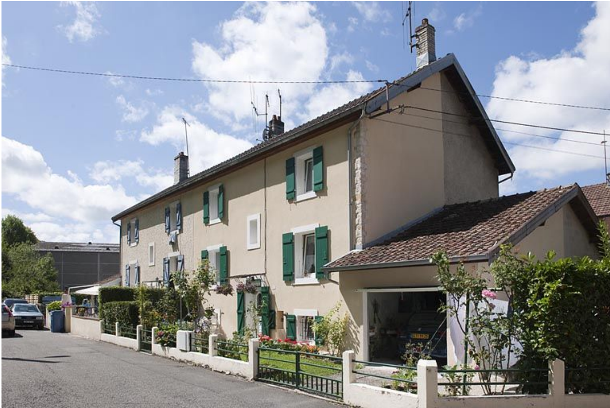
Habitation ouvrière vue de trois quarts droite.

25, Valentigney, lieudit : Cités blanches