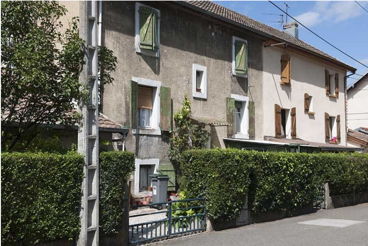
Détail d'une façade d'un habitation.

25, Valentigney, lieudit : Cités blanches