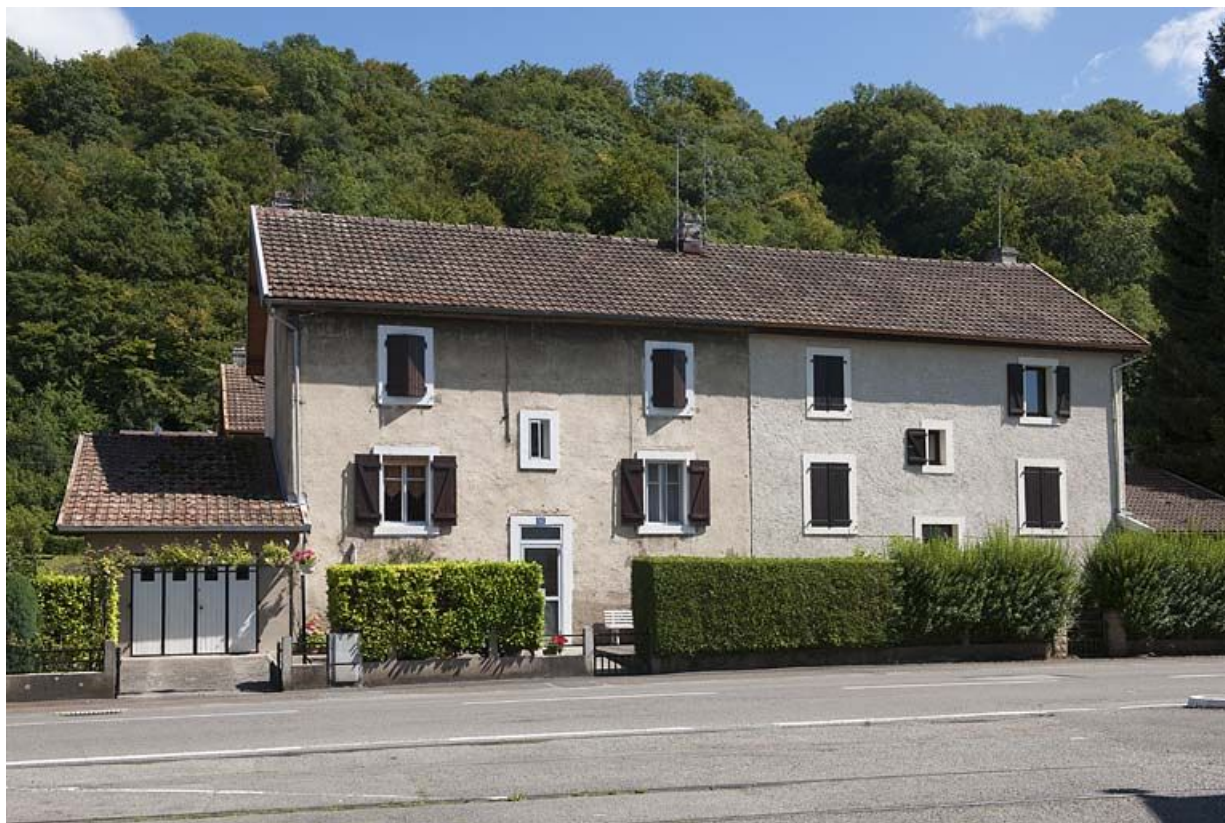
Façade ouest d'une habitation ouvrière.

25, Valentigney, lieudit : Cités blanches