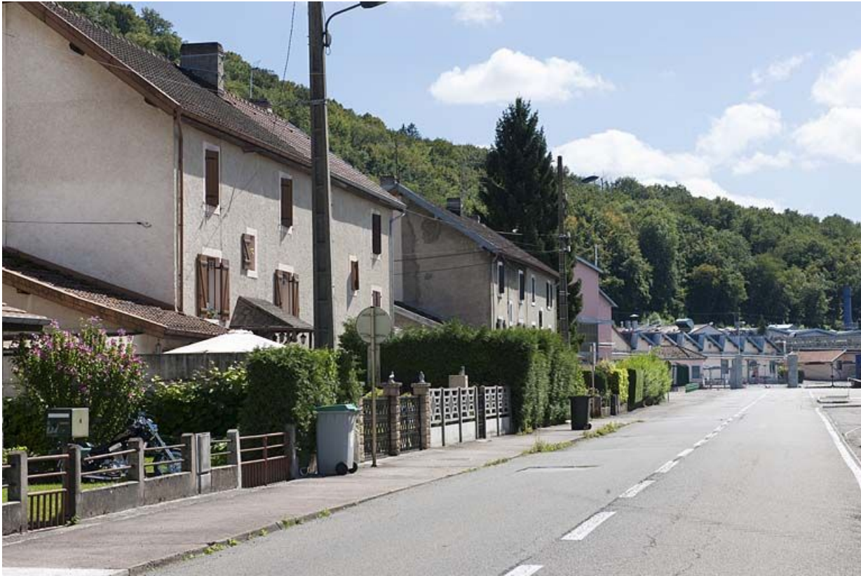
La cité ouvrière et l'usine de motocycles de Mandeure.

25, Valentigney, lieudit : Cités blanches