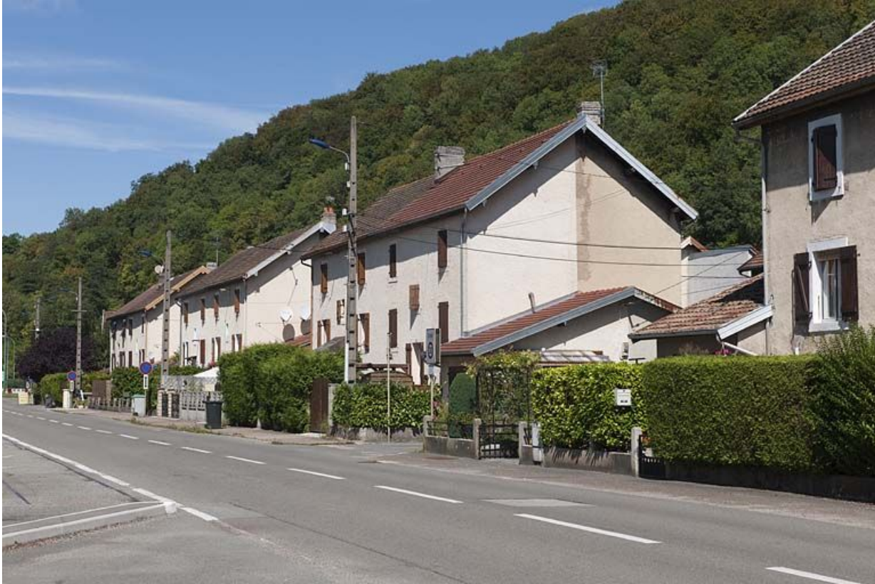
Maisons ouvrières rue des usines.

25, Valentigney, lieudit : Cités blanches