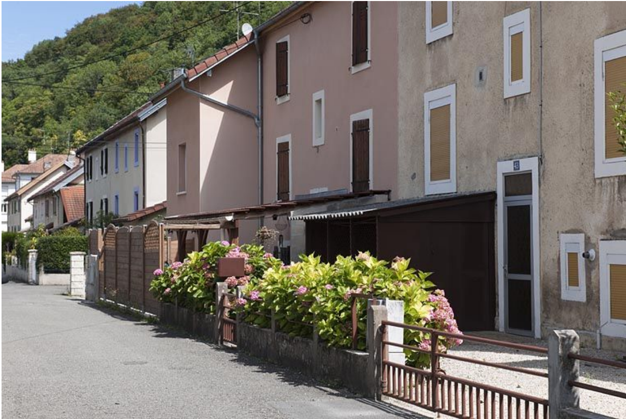
Façades ouest d'habitations ouvrières.

25, Valentigney, lieudit : Cités blanches