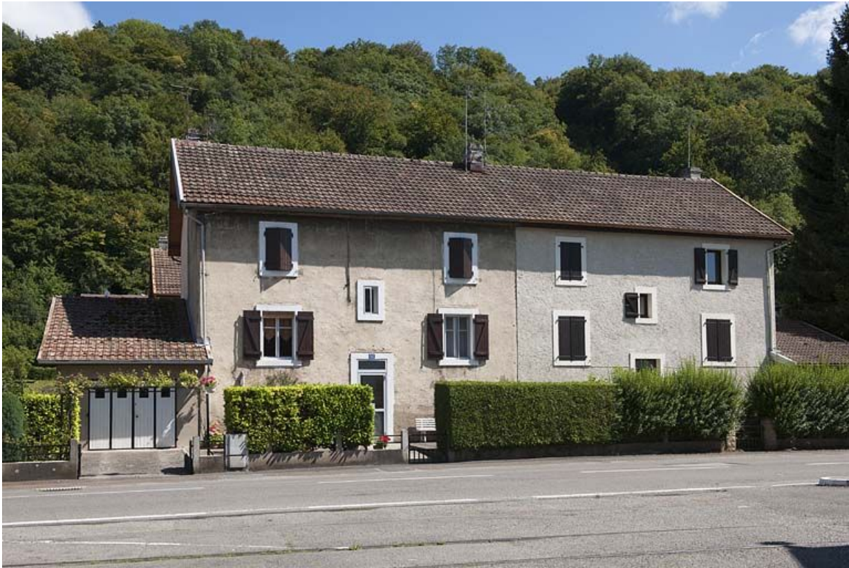
Façade ouest d'une habitation ouvrière.

25, Valentigney, lieudit : Cités blanches