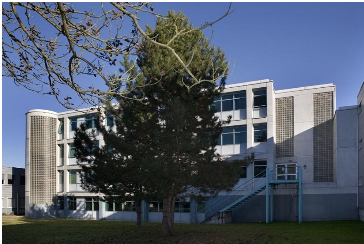
Bâtiment B. Vue de la façade antérieure. 25, Montbéliard rue Pierre Donzelot