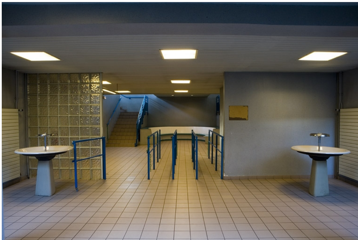
Bâtiment R. Vue de l'entrée à la salle de restauration.