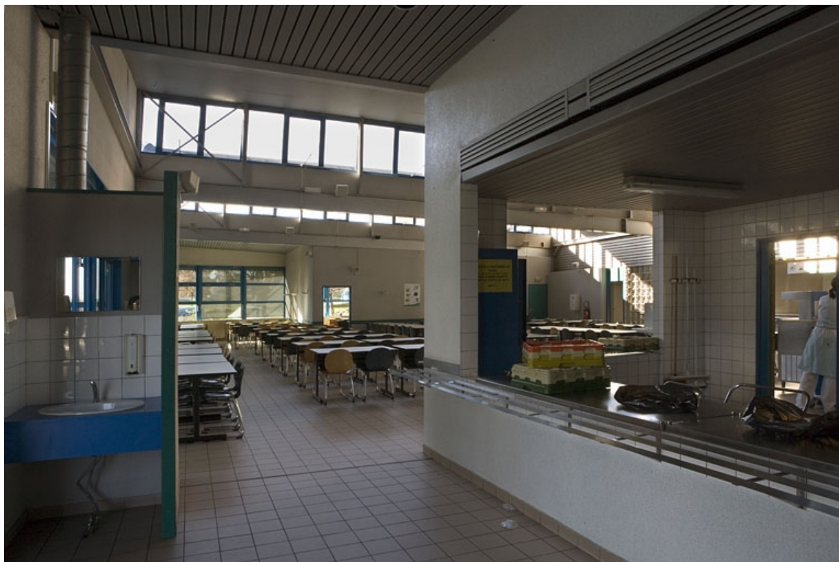
Bâtiment R. Vue de la salle de restauration. 25, Montbéliard rue Pierre Donzelot