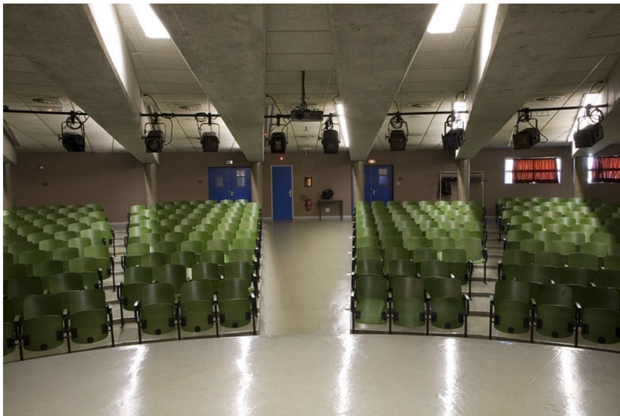
Bâtiment B. Vue de l'amphithéâtre depuis la scène.