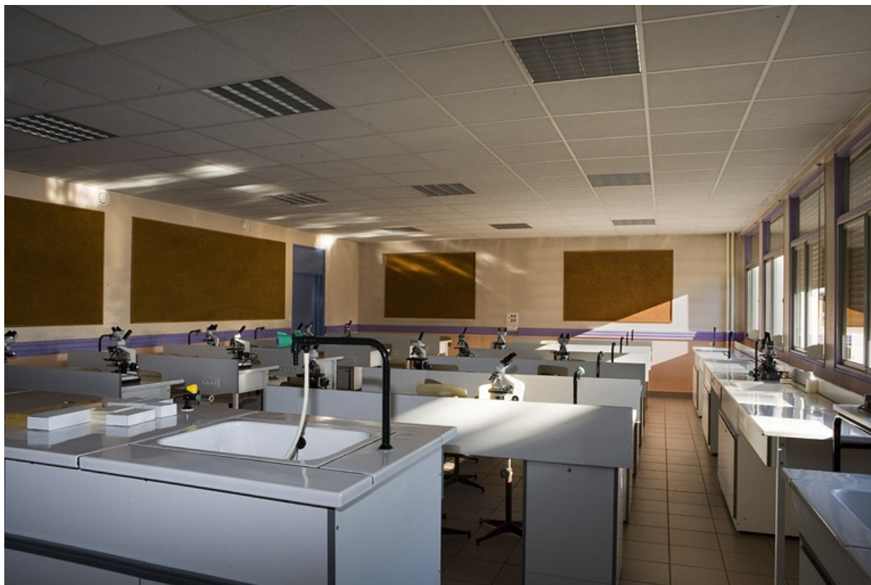
Bâtiment C. Vue d'un laboratoire pour les filières ST2S. 25, Montbéliard rue Pierre Donzelot