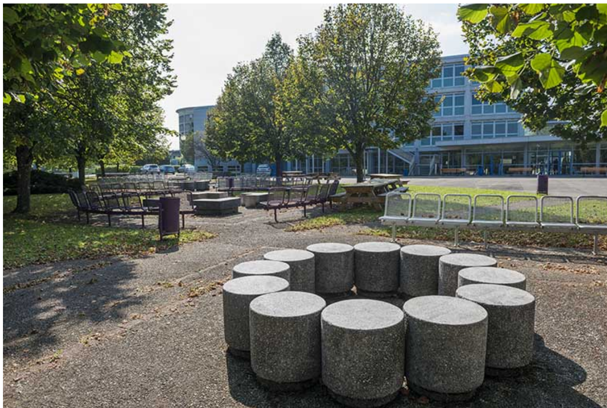
L'oeuvre dans son contexte, vue de l'est. 25, Montbéliard rue Pierre Donzelot