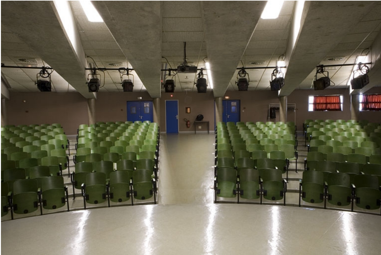
Bâtiment B. Vue de l'amphithéâtre depuis la scène.