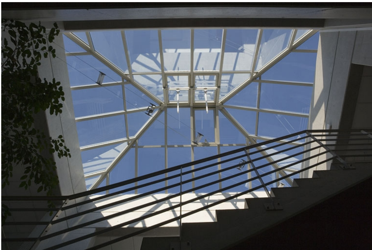
Bâtiment A. Détail de la verrière. 25, Montbéliard rue Pierre Donzelot