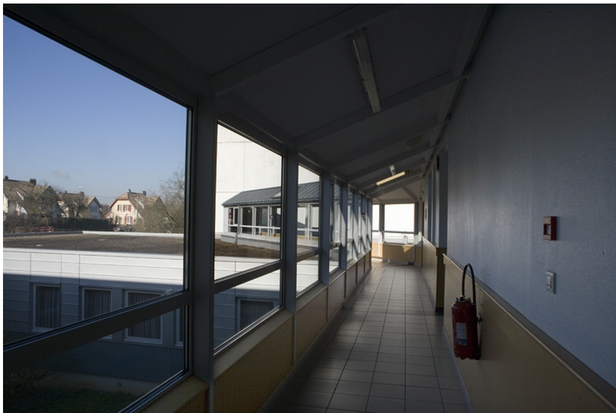
Bâtiment A. Vue de la passerelle. 25, Montbéliard rue Pierre Donzelot