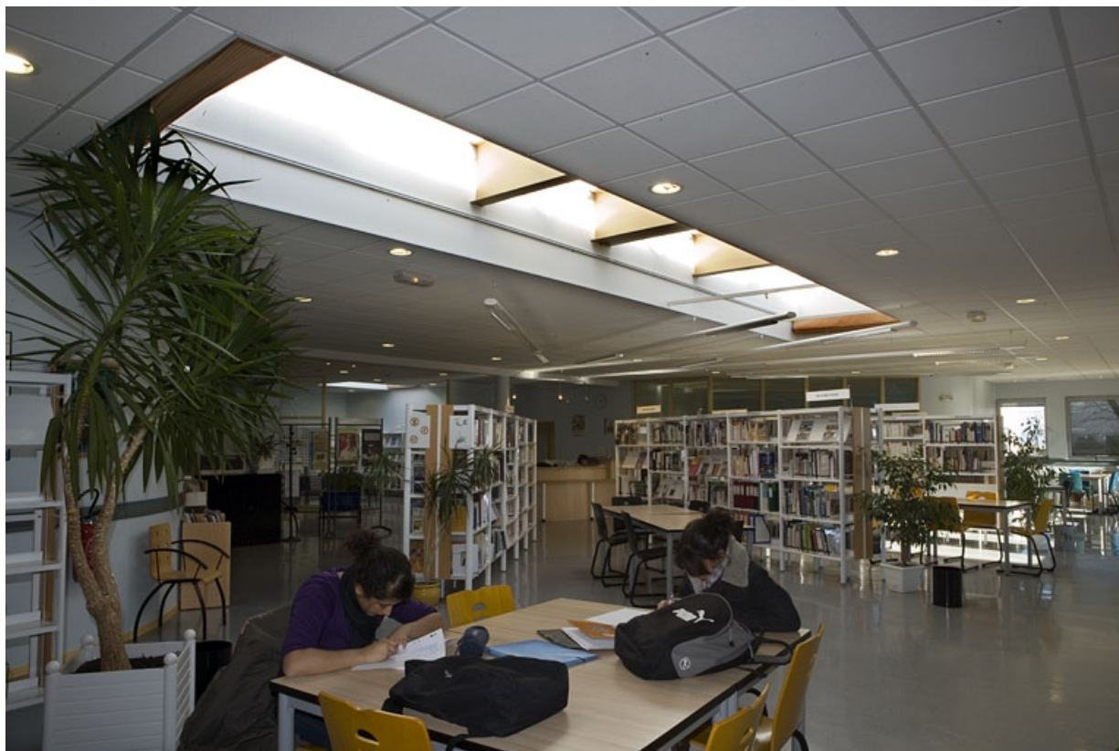
Bâtiment A. Vue intérieure du CDI. 25, Montbéliard rue Pierre Donzelot