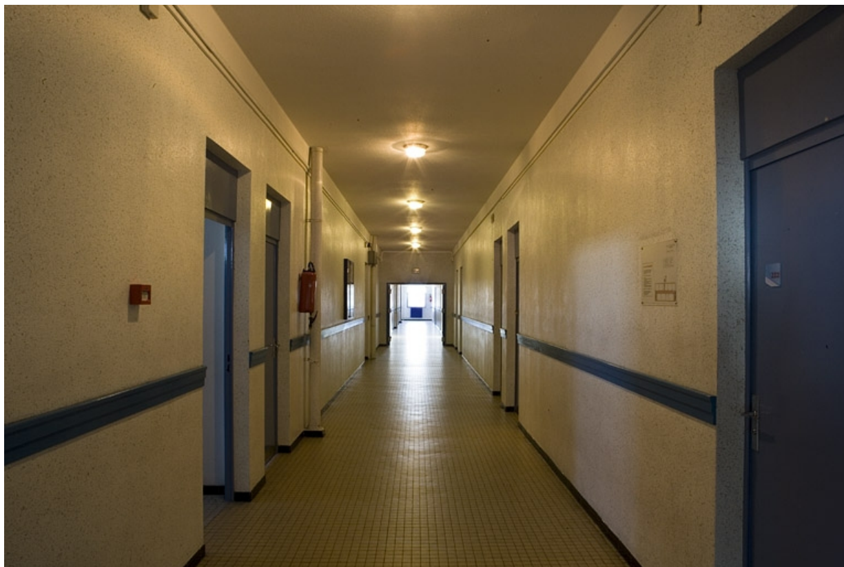
Bâtiment C. Vue du couloir.