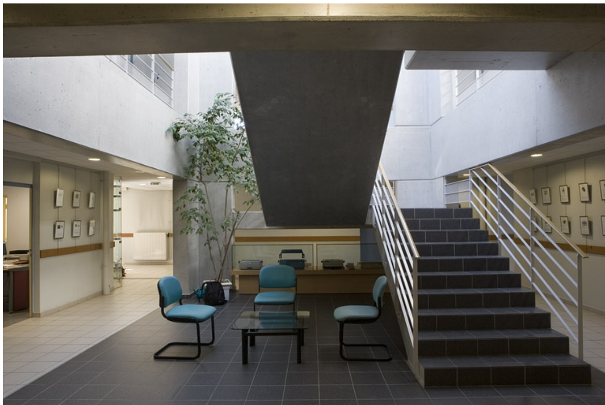
Bâtiment A. Vue du hall d'accueil. 25, Montbéliard rue Pierre Donzelot