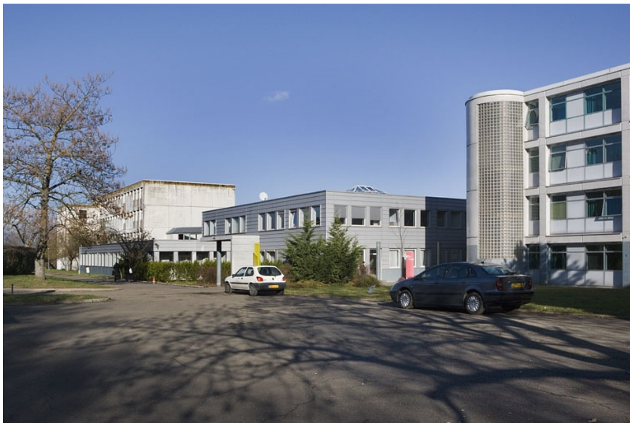
Vue d'ensemble depuis l'entrée principale. 25, Montbéliard rue Pierre Donzelot