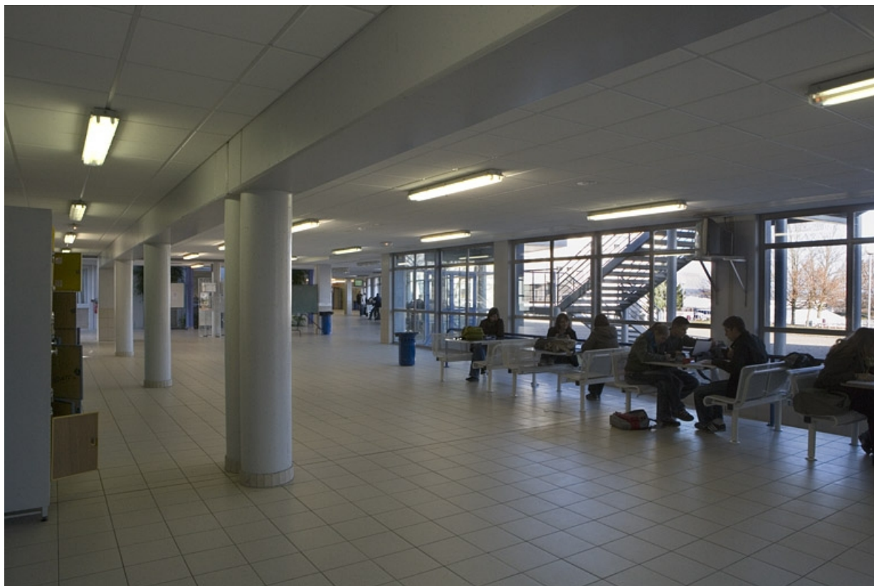
Bâtiment B. Vue du préau couvert.