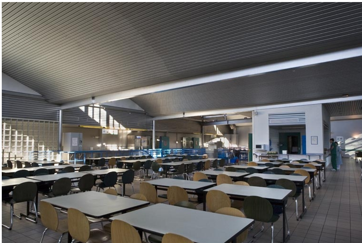
Bâtiment R. Vue de la salle de restauration. 25, Montbéliard rue Pierre Donzelot