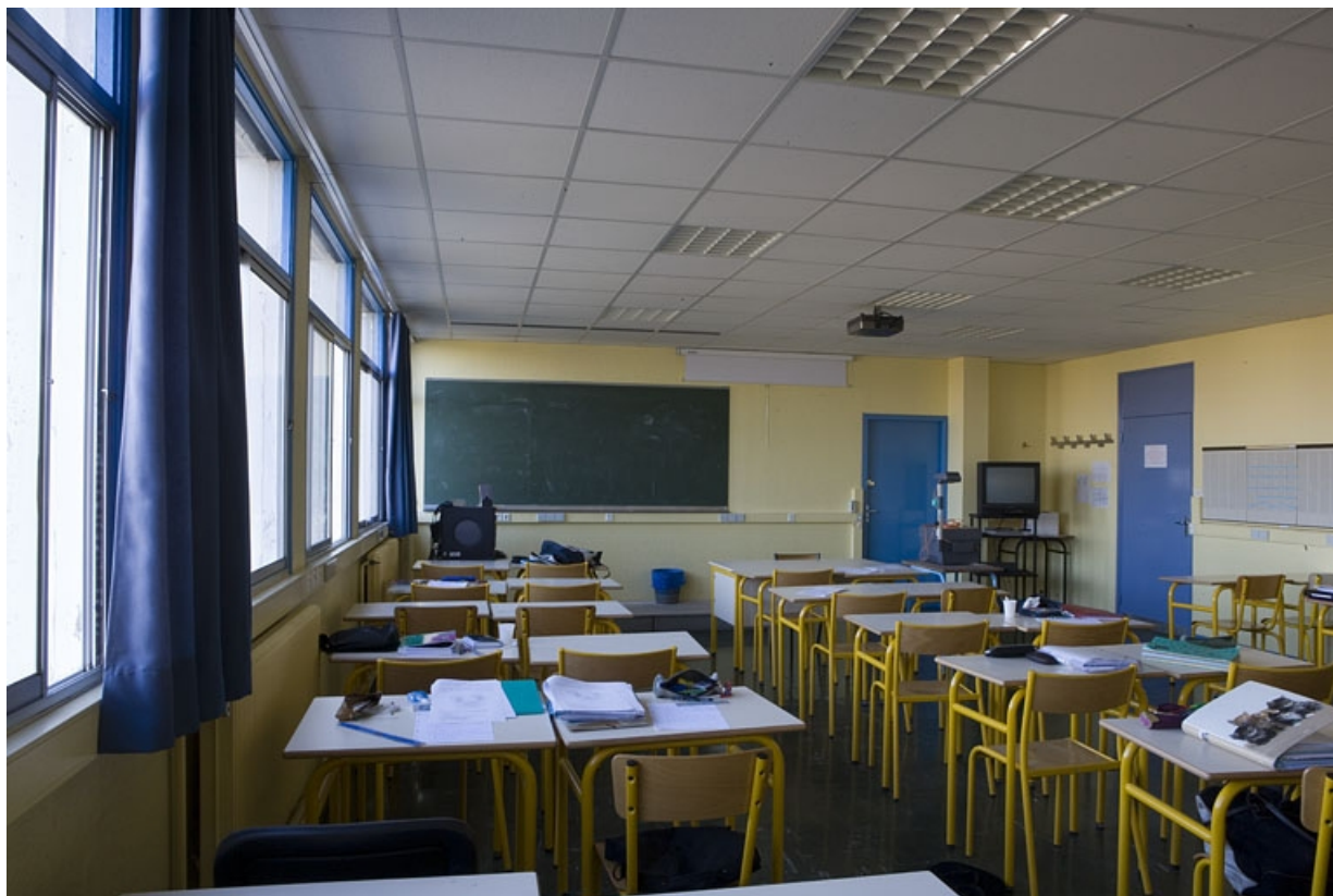
Bâtiment D. Vue d'une salle de cours théorique pour les formations métiers du tertiaire. 25, Montbéliard rue Pierre Donzelot