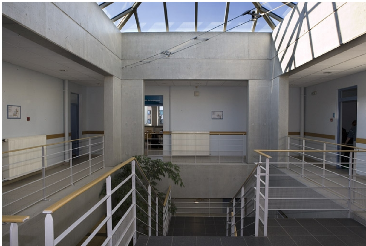
Bâtiment A. Vue de l'escalier de distribution.