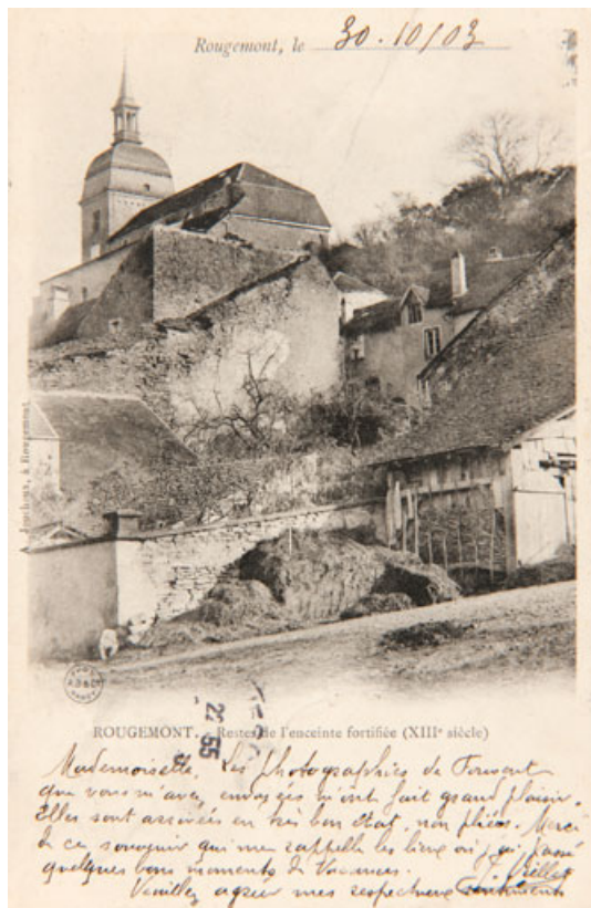
ROUGEMONT. Restes de l'enceinte fortifiée (XIIIe siècle). 25, Rougemont