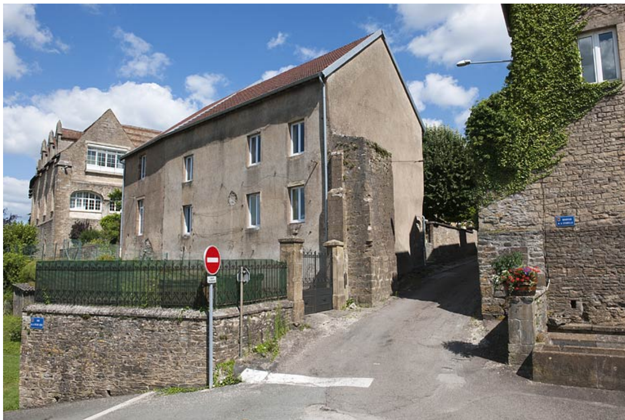
Vestige de la porte de l'ancienne basse-cour, Quartier de la Citadelle. 25, Rougemont