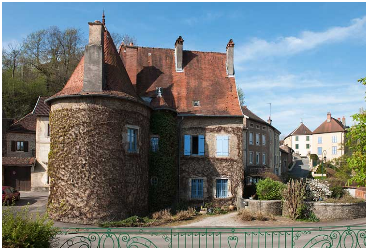
Vue rapprochée de la maison du Vieux Moulin. 25, Rougemont