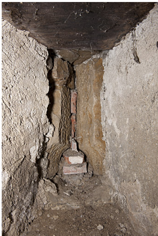
Archère-canonnrière en "trou de serrure", 2 rue du Carrefour des Halles. 25, Rougemont