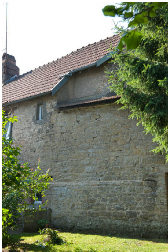
Construction élevée sur le mur d'enceinte, 7 rue du Vieux Moulin. 25, Rougemont