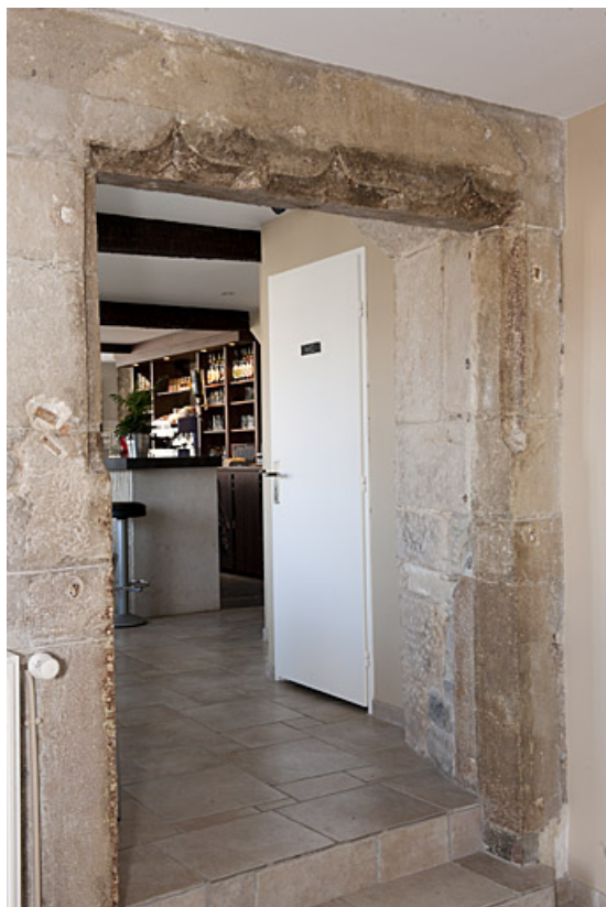
Ancienne baie d'une maison construite sur le mur d'enceinte, 1 place du Marché. 25, Rougemont