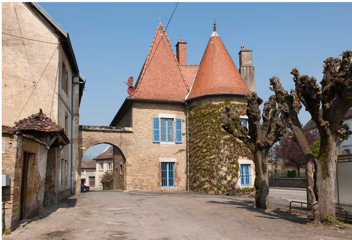
Vue d'ensemble de la porte du Vieux Moulin et de la maison du Vieux Moulin. 25, Rougemont