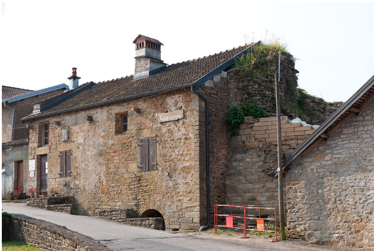
Vestiges d'une tour du château accolée à la "maison d'autrefois", Quartier de la Citadelle. 25, Rougemont, 4 quartier de la Citadelle