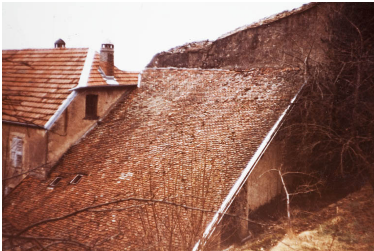
Ancien corps de bâtiment en appentis accolé au mur d'enceinte, 27 Grande Rue. 25, Rougemont