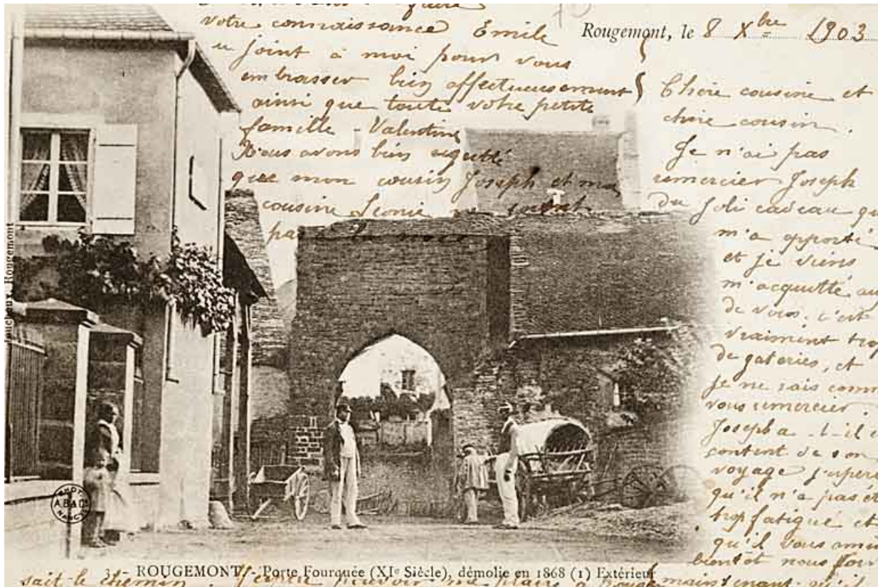
3.- Rougemont. Porte Fourquée (XI e siècle), démolie en 1868. Extérieur. 25, Rougemont