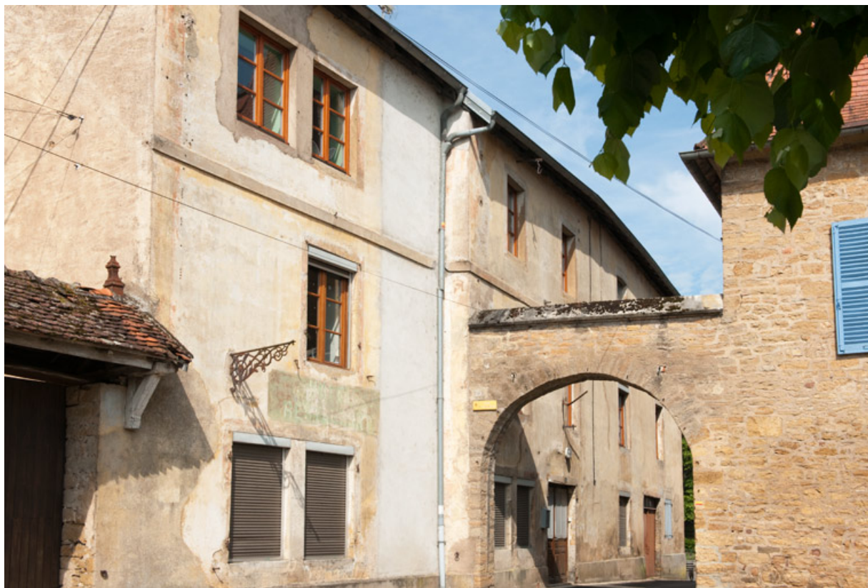
Vue rapprochée de l'hôtel de voyageurs. 25, Rougemont