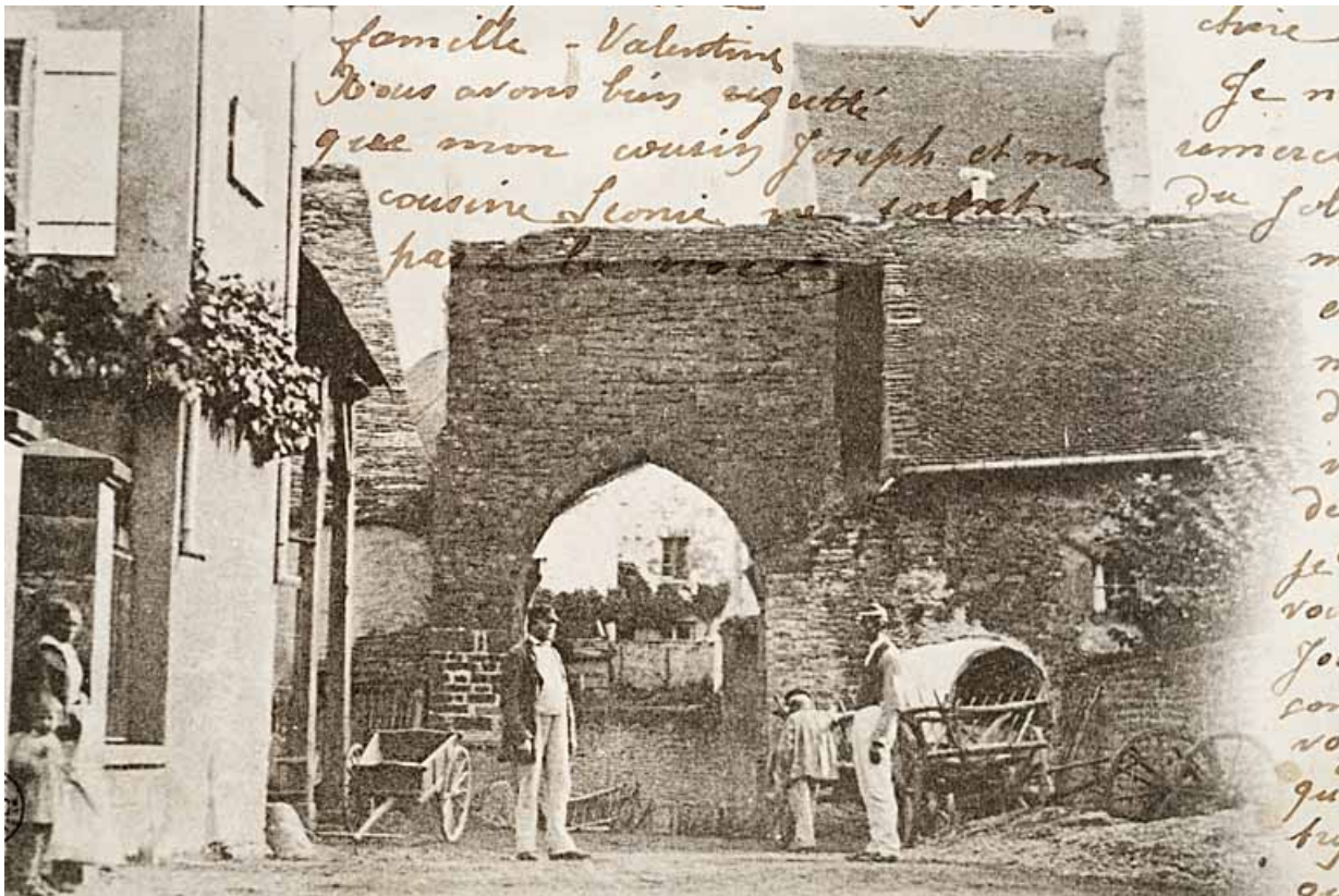
Recadrage de la carte postale précédente [Doc. 02 : Rougemont. Porte Fourquée (XIe siècle), démolie en 1868. Extérieur]. 25, Rougemont