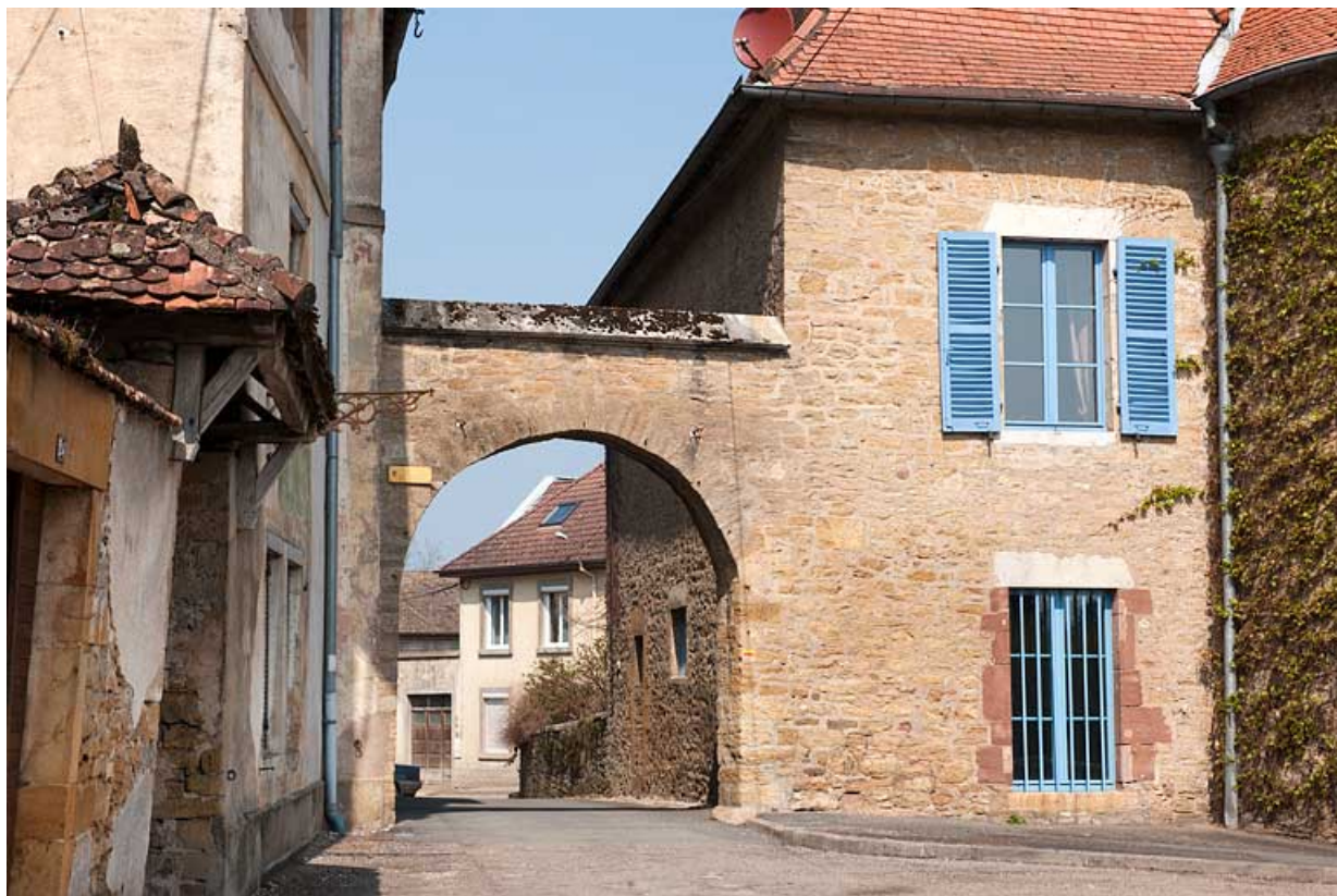
Vue rapprochée de la porte du Vieux Moulin et de la maison du Vieux Moulin. 25, Rougemont