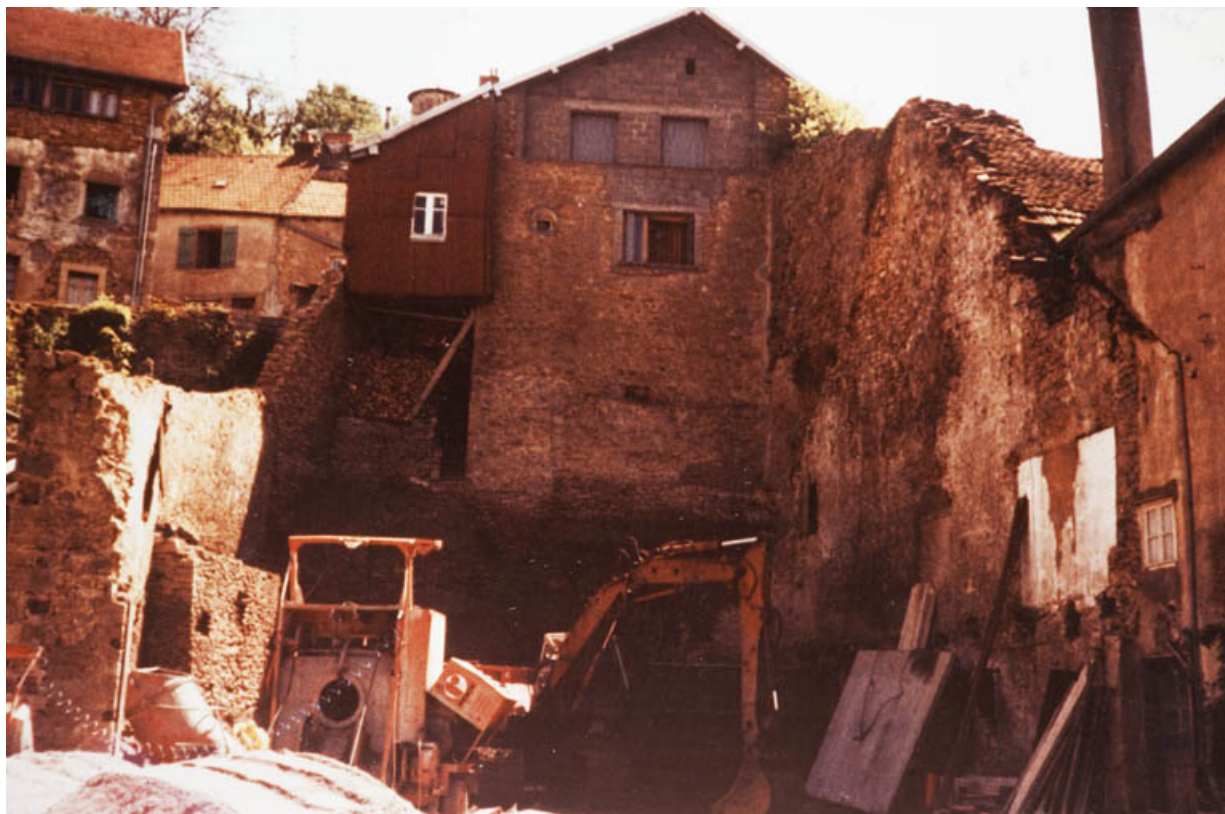
Une partie du mur d'enceinte en cours de destruction vers 1983-1984, 29 Grande Rue. 25, Rougemont