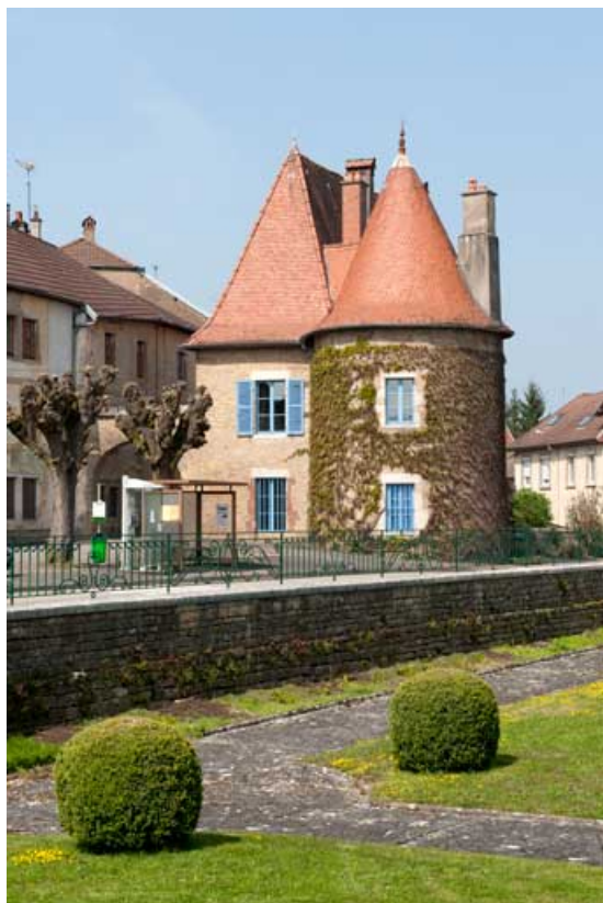
Vue de la maison du Vieux Moulin depuis le jardin de l'ancien château Vorget. 25, Rougemont