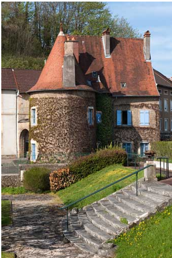
Vue générale de la maison du Vieux Moulin depuis le jardin de l'ancien château Vorget. 25, Rougemont