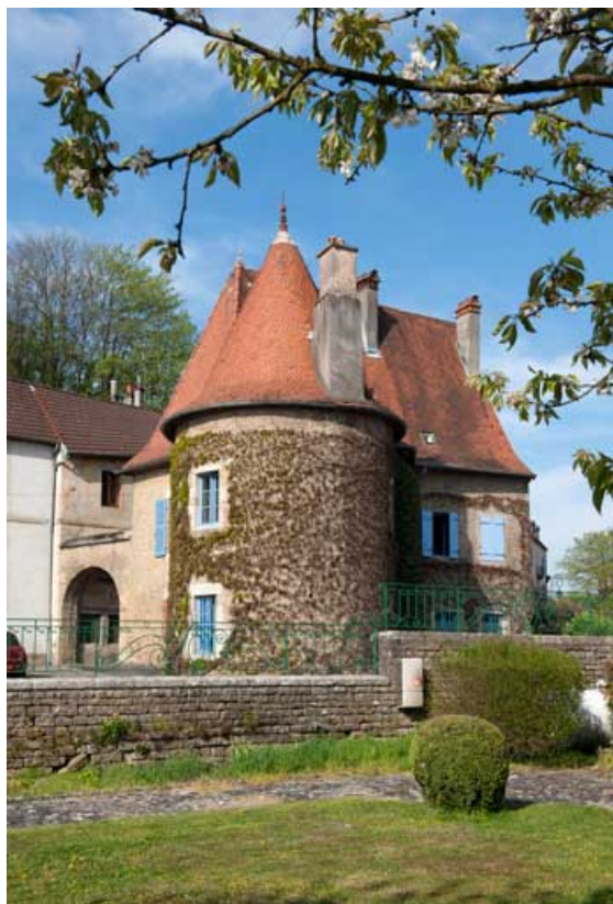
Vue d'ensemble de la porte du Vieux Moulin et de la maison du Vieux Moulin depuis le jardin de l'ancien château Vorget. 25, Rougemont