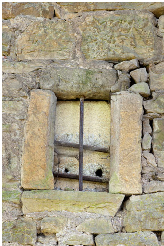
Ancienne baie encastrée dans le mur d'enceinte, 7 rue du Vieux Moulin. 25, Rougemont