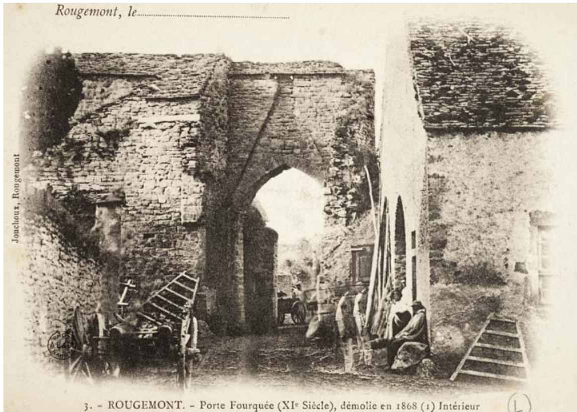
3.- Rougemont.- Porte Fourquée (XIe siècle), démolie en 1868. Intérieur. 25, Rougemont