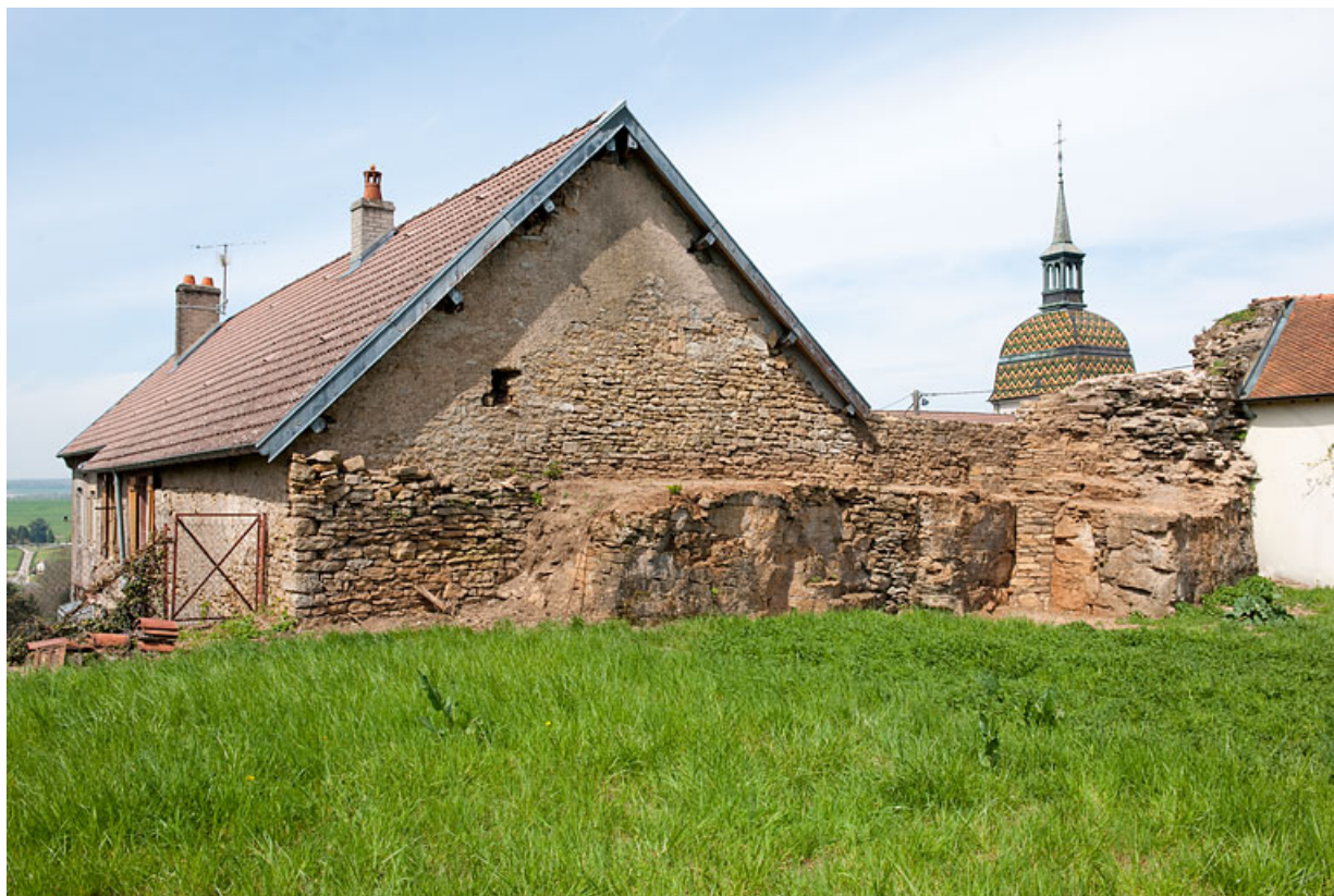
Revers des vestiges d'une tour du château accolée à la "maison d'autrefois", Quartier de la Citadelle. 25, Rougemont