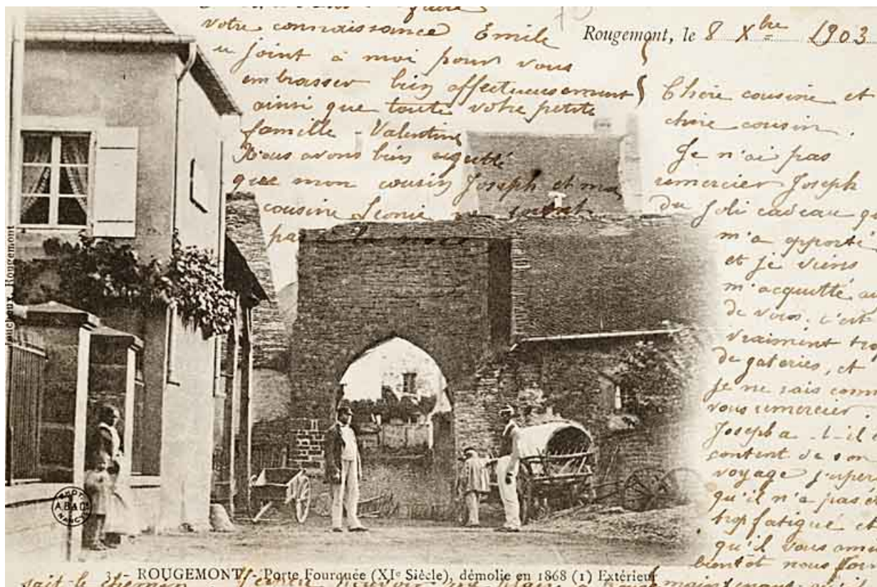
3.- Rougemont. Porte Fourquée (XIe siècle), démolie en 1868. Extérieur. 25, Rougemont