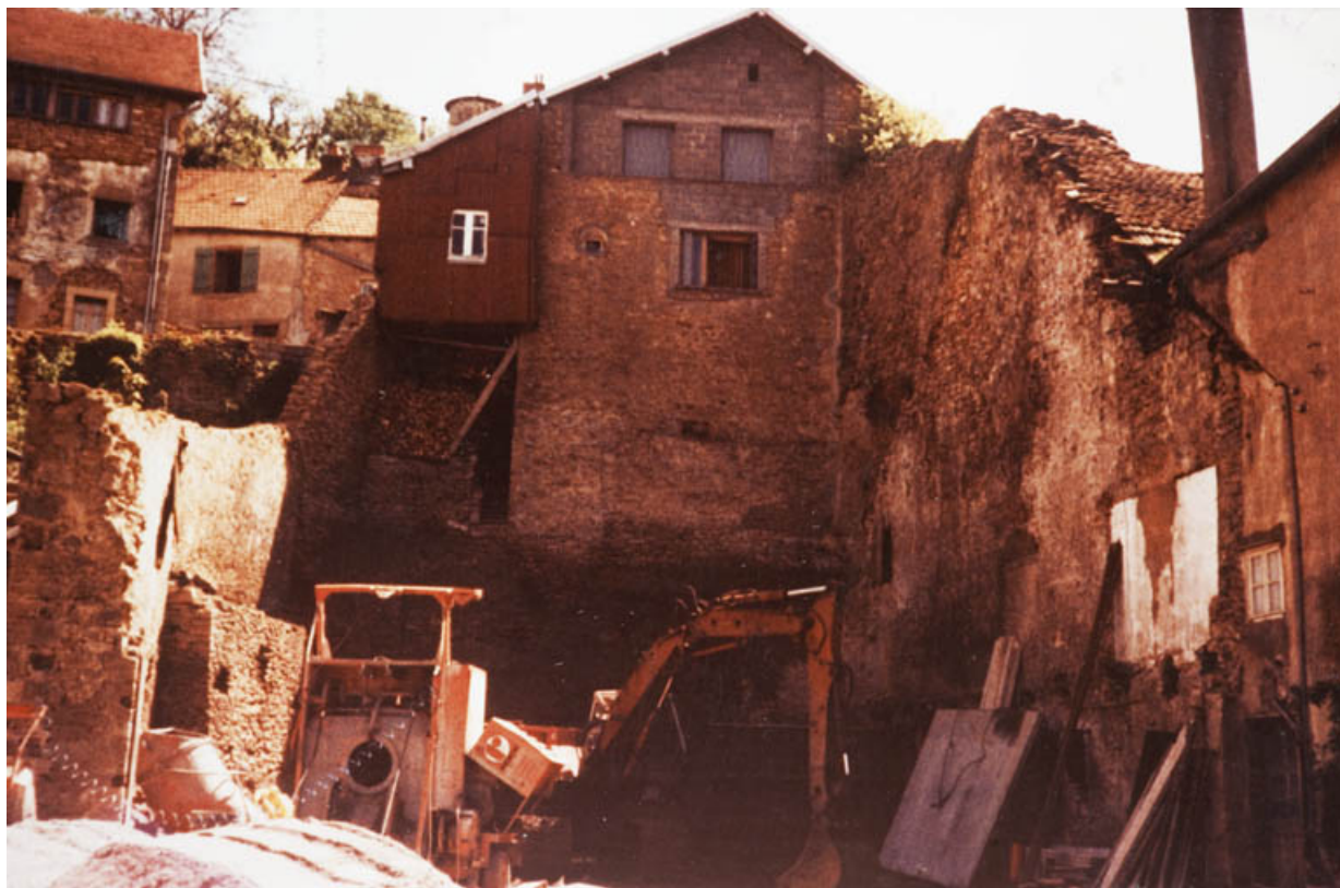
Une partie du mur d'enceinte en cours de destruction vers 1983-1984, 29 Grande Rue. 25, Rougemont