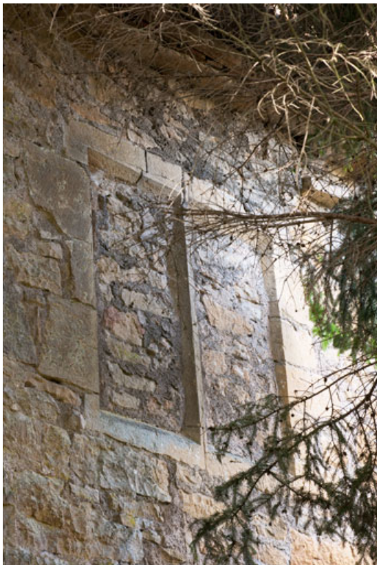
Exemple d'une baie à meneaux (16e siècle) aménagée dans le mur d'enceinte, 7 rue du Vieux Moulin. 25, Rougemont