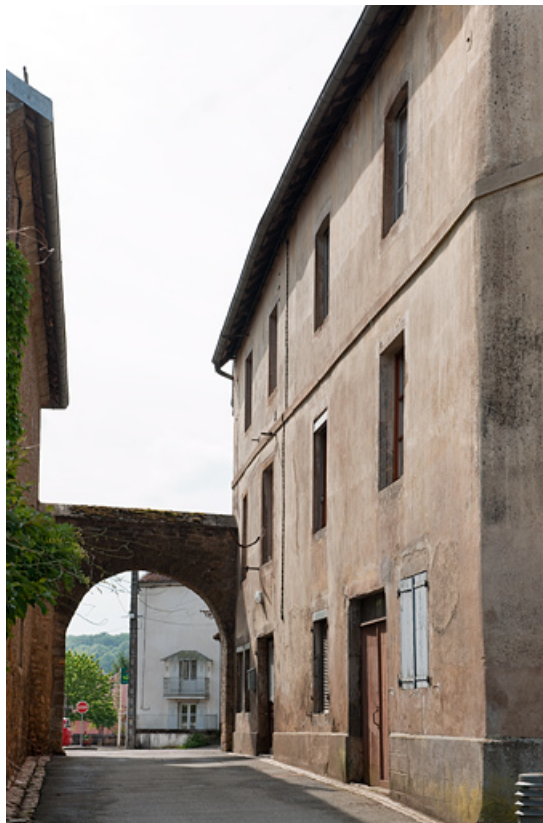
Vue de la porte du Vieux-Moulin et de la façade antérieure de l'hôtel. 25, Rougemont, 22 rue du Vieux Moulin