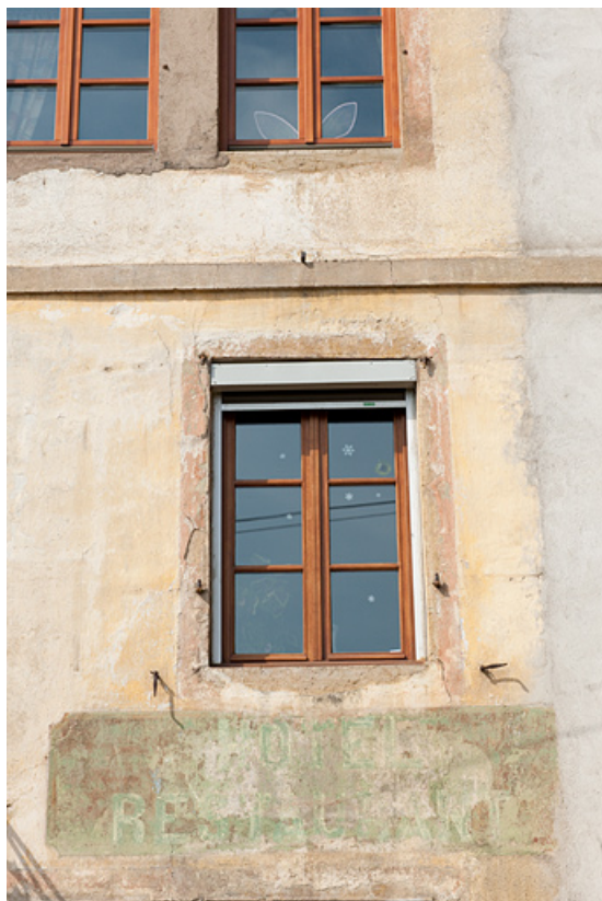
Inscription peinte [Hôtel Restaurant] au-dessus de la porte d'entrée de l'ancienne salle à manger. 25, Rougemont, 22 rue du Vieux Moulin