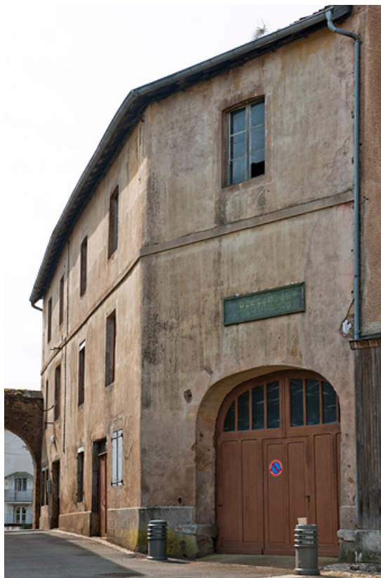
Vue générale de la façade antérieure.