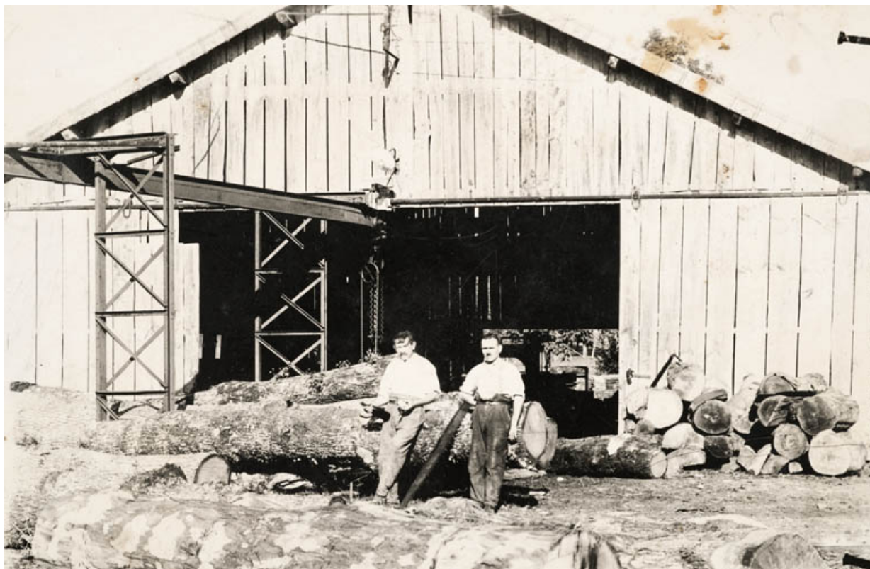
[La scierie avant l'incendie de 1943]