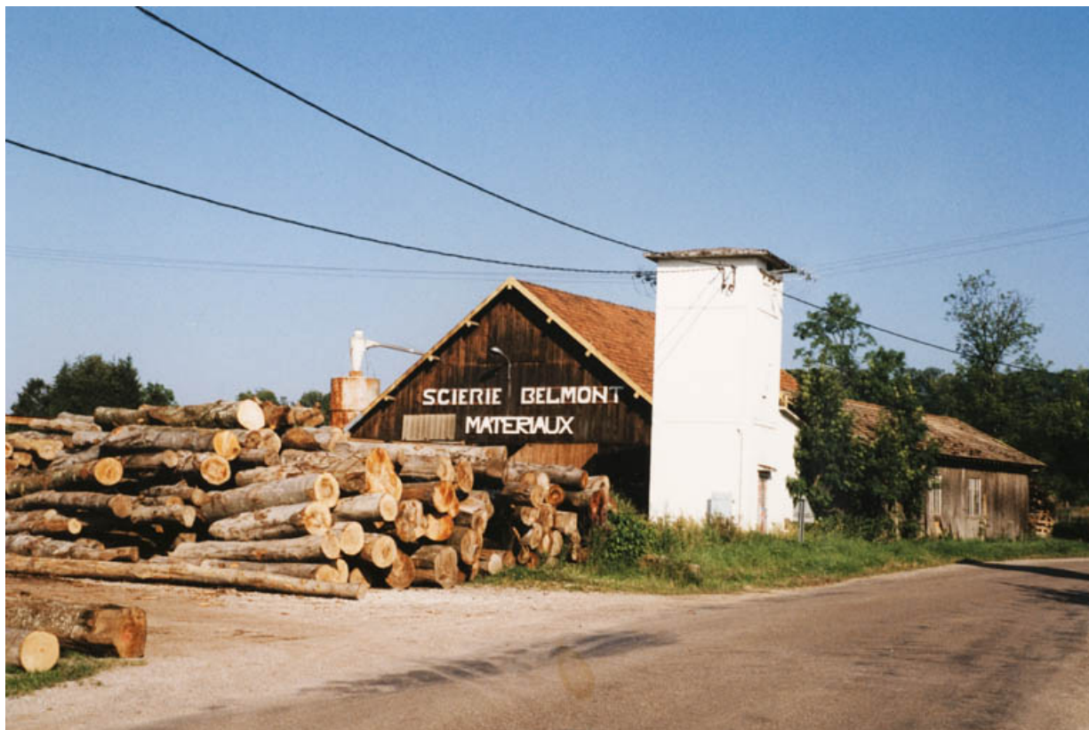
La scierie vers 1990.